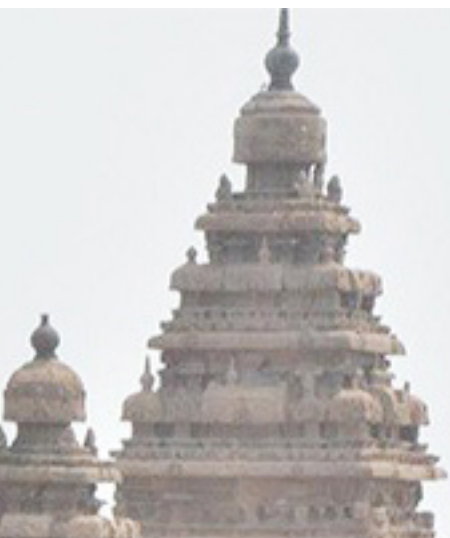
(13ஆம் பக்கம் பார்க்க)