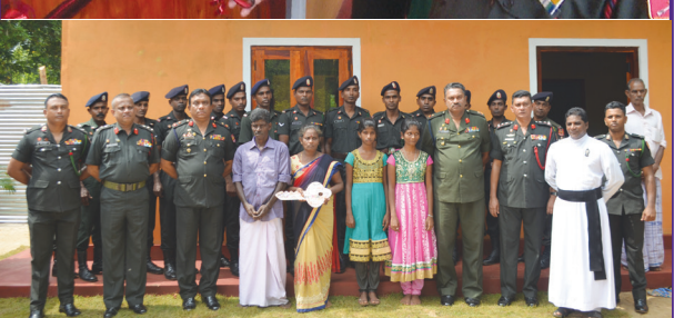
யாழ்ப்பாண மக்களுக்கு வீடுகளை அமைத்துக் கொடுக்கும் இராணுவத்தினரின் வாதாமக்கள் நலனோம்பும் திட்டத்தின்கீழ் பெரியவிளான்பகுதியில் 513 பிரிகேட்டிற்கு உட்பட்ட 14 ஆவது 'கெமுனு வோச்' படைப்பிரிவினால் அமைக்கப்பட்ட வீடு நேற்று உரிய சிவிலியனிடம் கையளிக்கப்பட்டது. யாழ்ப்பாணம், படைகளின் தளபதி மேஜர் ஜெனரல் தர்ஷன ஹெட்டியாராச்சி அந்த வீட்டைத் திறந்து வைத்து உரியவரிடம் கையளித்தார்.

ஆசிரியர்: வே. அன்பழகன் அவர்களின் தரம் - 5 புலமைப்பரிசில் பரீட்சை - 2018 வகுப்புகள் ஆரம்பமாகின்றன யாழ்ப்பாணத்தில்: அன்பொளி கல்வியகம், யாழ்ப்பாணம். இந்துக் கல்லூரி வீதி, யாழ்ப்பாணம். சாவகச்சேரியில்: அன்பொளி கல்வி நிலையம், தபாற்கந்தோர் வீதி, சாவகச்சேரி. அனுமதிக்களை 25.09.2017 திங்கட்கிழமை யிலிருந்து 02.10.2017 திங்கட்கிழமை வரை பிற்பகல் 3.00 - 5.30 மணிவரை பெற்றுக்கொள்ளலாம். குறிப்பு: பெற்றோர் கலந்துரையாடலுடன் வகுப்புகள் ஆரம்பிப்பது பற்றிய மேலதிக விவரங்கள், நேர அட்டவணை நேரில் வழங்கப்படும். - சின்ன விழி அசைத்துச் சிரித்து வரும் சித்திரங்களை அள்ளி அனைத்து அரிய கல்வி மகிழ்வுடன் ஊட்டிடுவோம் - - இயக்குநர்கள்.