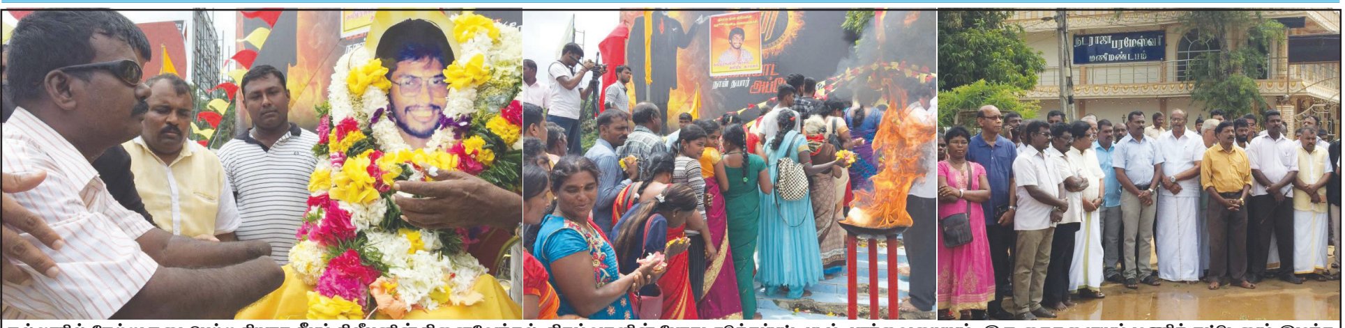
நல்லூரில் நேற்று நடைபெற்ற தியாக தீபம் திலீபனின் நினைவேந்தல் நிகழ்வுகளின் போது எடுக்கப்பட்ட படம். பார்வையையும், இரு கைகளையும் மணிக் கட்டுதலும் இழந்த போராளி ஒருவர் அஞ்சலி செலுத்துகிறார். நிகழ்வில் திரண்டிருந்த பொது மக்கள் மற்றும் பிரமுகர்கள் அடுத்த படங்களில்.

விழயல் 01 வள்ளுவர் ஆண்டு 2048 புரட்டாதி 11, புதன்கிழமை 27.09.2017 கதிர் 325