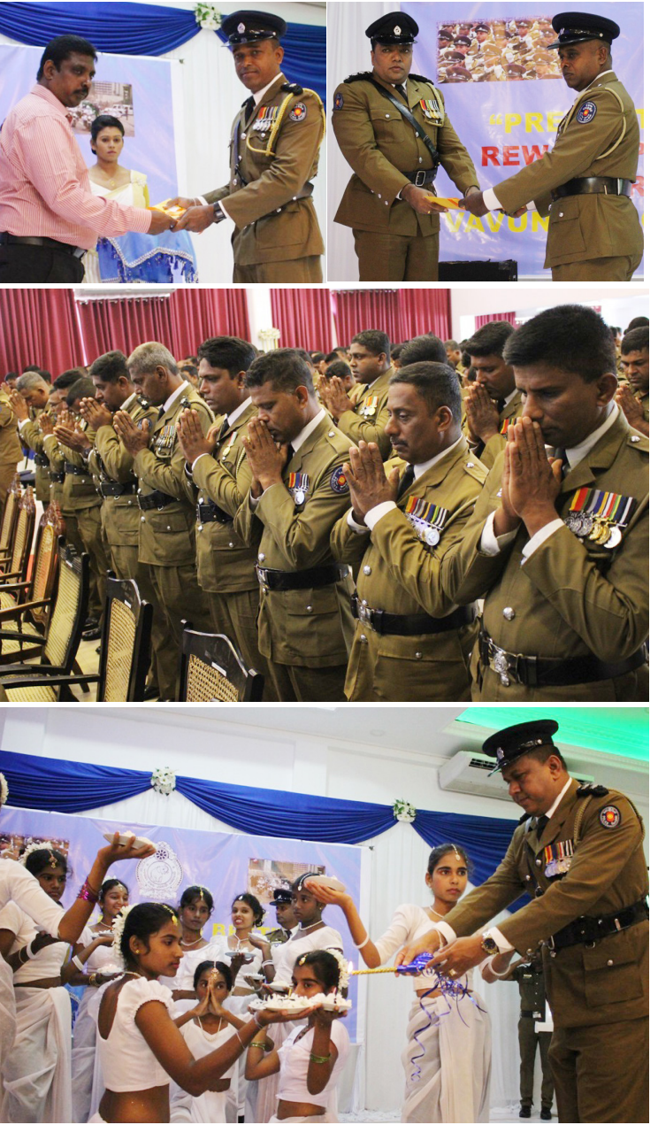
அர்ப்பணிப்புடன் பணியாற்றிய வவுனியா மாவட்ட பொலிஸாருக்கு வெகுமதி வழங்கும் நிகழ்வு நேற்று மில் வீதியில் அமைந்துள்ள தனியார் விருந்தினர் விடுதியில் நடைபெற்றது. வவுனியா மாவட்ட உதவி