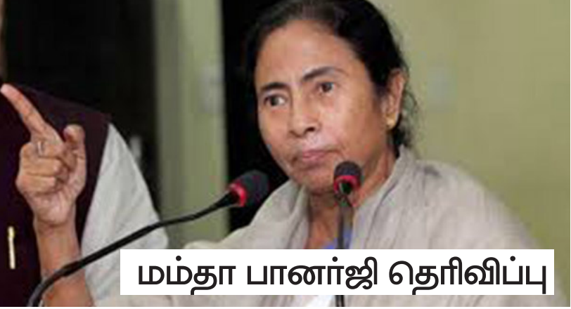
மம்தா பானர்ஜி தெரிவிப்பு

கொல்கத்தா, ஓக்.20 நாட்டின் பெயரைக் கூட பா.ஜ.கவினர் நமக்குத் தெரியாமல் மாற்றிவிடுவார்கள் என்று மேற்குவங்க முதல்வர் மம்தா பானர்ஜி கடுமையாக விமர்சித்துள்ளார். மேற்குவங்க மாநில முதல்வர் மம்தா பானர்ஜி நேற்று முன்தினம் செய்தியாளர்களை சந்தித்துப் பேசினார். அப்போது உலக அதிசயங்களுள் ஒன்றான தாஜ்மஹால் குறித்து பா.ஜ.கவின் எம்.எல்.ஏ. சங்கீத் சோம் தெரிவித்த கருத்து குறித்து அவரிடம் செய்தியாளர்கள் கேள்வி எழுப்பினர். அதற்கு அளித்த பதிலில் மம்தா பானர்ஜி கூறியவை வருமாறு:- இது பாரதீய ஜனதா கட்சியின் அரசியல் கொள்கை. தற்போது அது வெளிப்படையாகத் தெரிகின்றது. ஒரு நாட்டின் நினைவுச் சின்னத்தை எப்படி மதத்தின் பெயரால் அந்த நாட்டின் வரலாற்றில் இருந்து பிரிக்க முடியும். மிகவும் தவறான பாதையில் பா.ஜ.க