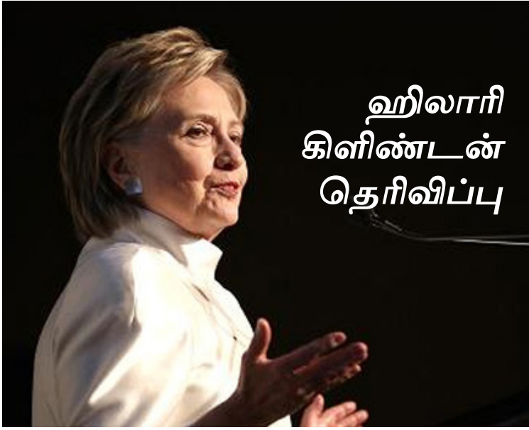
ஹிலாரி கிளிண்டன் தெரிவிப்பு

ஐ.நா. மற்றும் உலக நாடுகளின் எதிர்ப்பை மீறி ஆயுத பரிசேதனைகளில் ஈடுபட்டு வரும் வடகொரியாவின் நடவடிக்கையால் அமெரிக்கா-வடகொரியா இடையே மோதல் நிலை ஏற்பட்டு வருகின்றது. கடந்த மாதம் 3ஆம் திகதி வடகொரியா நடத்திய 6 ஆவது மற்றும் மிகப்பெரிய அணு ஆயுத சோதனையும், ஜப்பானுக்கு மேலே ஏவுகணை பறக்க விட்ட சம்பவமும் சமீப காலமாக அங்கு போர்ப் பதற்றத்தை ஏற்படுத்தியுள்ளன.