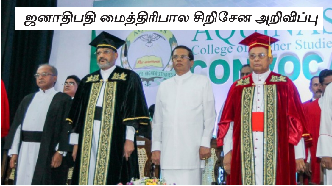
ஜனாதிபதி மைத்திரிபால சிறிசேன அறிவிப்பு

சைட்டம் நிறுவனம் தொடர் பான பிரச்சினைகளைத் தீர்ப் பதற்காகக் கடந்த காலத்தில் அரசு பல்வேறு நடவடிக்கை களை எடுத்தபோதும் அந்தத்