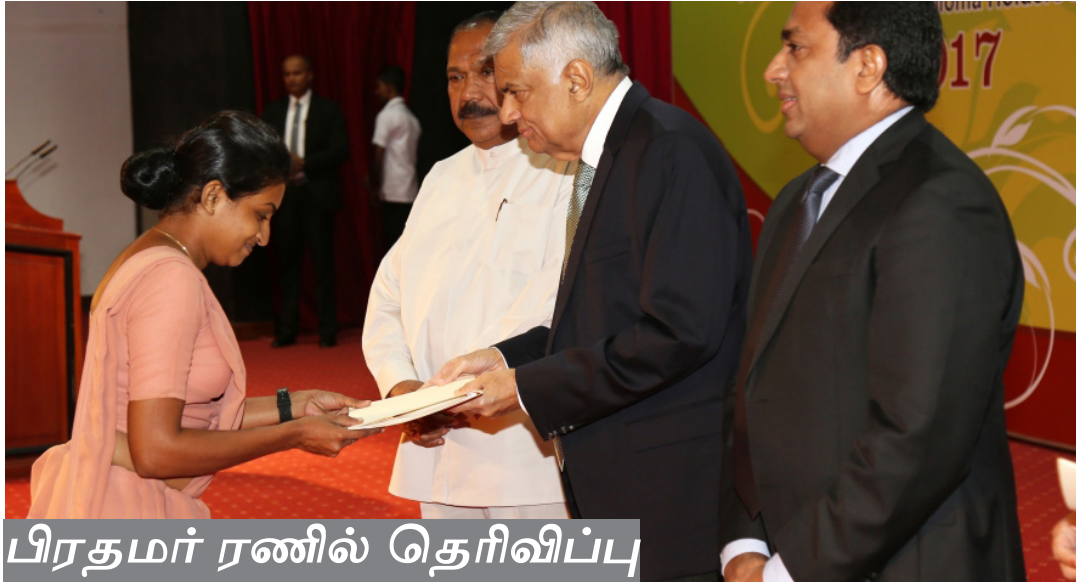
பிரதமர் ரணில் தெரிவிப்பு

தற்போது நாட்டில் மொத்த ஆசிரியர் தொகையில் 60 சதவீதமானோர் டிப்ளோமா அல்லது பட்டப்படிப்பு தகுதி இன்றி கற்பித்தல் நடவடிக்கையில் ஈடுபட்டுள்ளனர்.