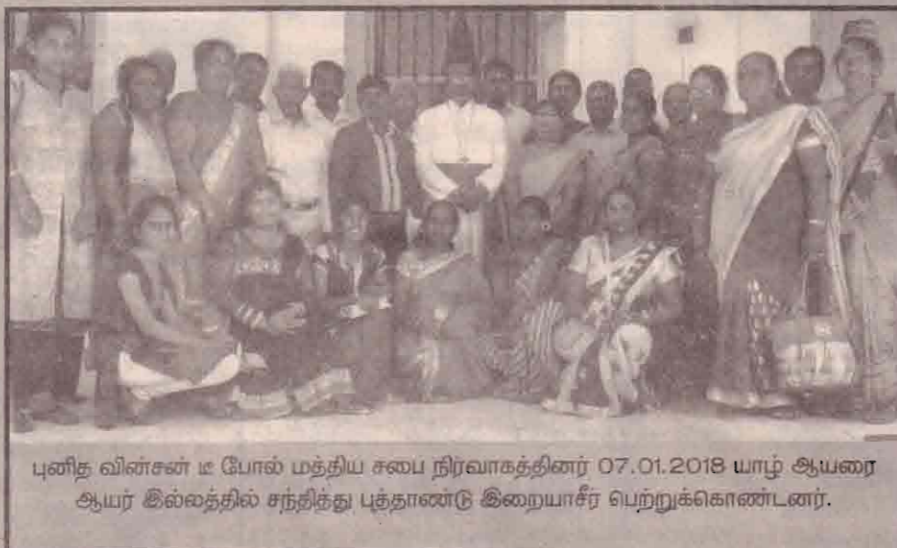
புனித வின்சன் டீ போல் மத்திய சபை நிர்வாகத்தினர் 07.01.2018 யாழ் ஆயுரை ஆயர் இல்லத்தில் சந்தித்து புத்தாண்டு இறையாசீர் பெற்றுக்கொண்டனர்.