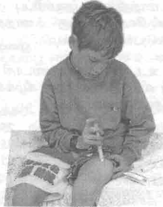
இன்கலின் ஏற்றும் சிறுவன்

நீரிழிவு நோய்க்கென டயனில் (Daonil), மெற்போமின் (Metformin) முதலிய மருந்துகள் ஆங்கில மருத்துவத்தில் உள்ளன. இவற்றை மருத்துவரின் ஆலோசனையின் பிரகாரம் விற்றமின் களையும் சேர்த்துப் பயன்படுத்த வேண்டும். நீரிழிவு நோயாளர் அருந்தக் கூடிய வகையில் சில பானங்களும், இனிப்பு வகைகளும், கொழுப்பற்ற பால்மா வகைகளும் தற்போது கடைகளில் விற்கப்படுகின்றன. ஐரோப்பிய நாடுகளில் நீரிழிவு நோயாளர்க்கென தனியாக எல்லா வித உணவுகளும் பானங்களும் விற்கப்படுகின்றன.