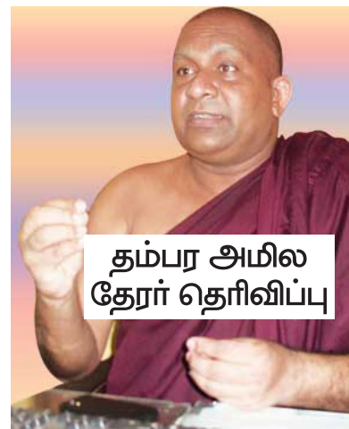
தம்பர அமில தேரர் தெரிவிப்பு

விடயங்களைத் திருத்தி அமைக்குமாறு கோரும் உரிமை பெளத்த மாநாயக்க தேரர்களுக்கும் பொது மக்களுக்கும் உண்டு.