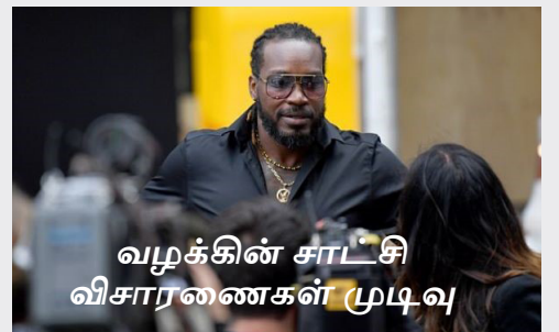
வழக்கின் சாட்சி விசாரணைகள் முடிவு

கிறிஸ் கெய்லின் ஓய்வறைக்கு அறைப் பணிகளை மேற்கொள்ள வந்த பணி பெண்ணிடம் என்ன தேடுகிறாய் என கிறிஸ் கேட்ட போது துவாயை தேடுவதாக பணிப்பெண் பதிலளித்துள்ளார். கிறிஸ்