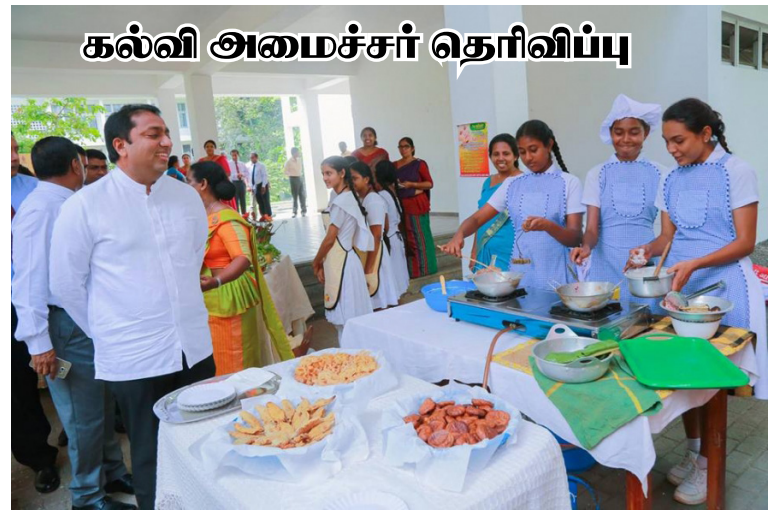
கல்வி அமைச்சர் தெரிவிப்பு

இந்த நிகழ்வில், மாணவர்களுக்குப் பகலுணவை வழங்க வேண்டும் என்பது தமது நீண்டகாலக் கனவாகும். இந்த கனவை நனவாக்குவதற்காக ஊழல்மற்றும் முறைகேடுகளை கல்வி அமைச்சில் இல்லா