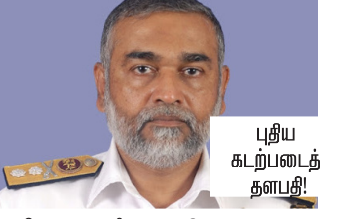
புதிய கடற்படைத் தளபதி!