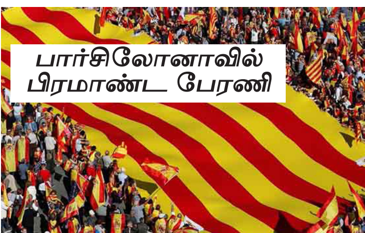
பிரிந்து சுதந்திர கட்டலோனியா பிறந்துவிட்டதாக நாடாளுமன்றத்தில் அறிவிக்கப்பட்டது.

பார்சிலோனா, ஓக். 31 கட்டலோனியா தனிநாடு கோரிக்கைக்கு எதிர்ப்பு தெரிவித்து பார்சிலோனாவில் நேற்று நடைபெற்ற பேரணியில் சுமார் மூன்று லட்சம் பேர் கலந்து கொண்டனர். ஸ்பெயினின் தன்னாட்சி பெற்ற மாகாணமாகக் கட்டலோனியா தனிநாடாகப் பிரிவது தொடர்பாக வாக்கெடுப்பு நடத்தியிருந்தது. அதற்கு 90 வீத மக்கள் ஆதரவாக வாக்களித்திருந்த நிலையில், கடந்த வெள்ளிக்கிழமை தனிநாடாக அறிவித்துப் பிரகடனம் செய்தது. ஸ்பெயினில் இருந்து