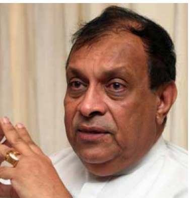
கப்பட்டுள்ளது என்றும் அவர் கூறியுள்ளார்.

கொழும்பு, ஒக். 31 இலங்கையில் ஜனநாயக மறுசீரமைப்புப் பணிகளுக்காக அமெரிக்கா ஒரு கோடியே 40 லட்சம் டொலர்களை வழங்கியுள்ளது. இலங்கை நாடாளுமன்ற சபாநாயகர் கரு ஜெயசூரிய நேற்று முன்தினம் இந்தத் தகவலை வெளியிட்டுள்ளார். நாடாளுமன்றக் குழு முறையை முன்னேற்றுவதற்கும், நாடாளுமன்ற உறுப்பினர்கள் மற்றும் ஏனையோரின் ஆற்றலை விருத்தி செய்வதற்குமே இந்த நிதி வழங்