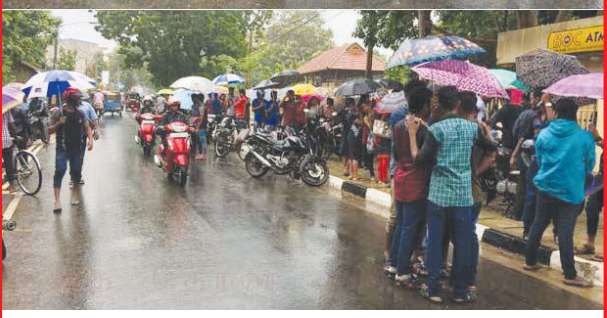
அரசியல் கைதிகளின் விடுதலை கோரி யாழ். பல்கலைக் கழகமாணவர்கள் நேற்றுப் போராட்டத்தில் ஈடுபட்டபோது...