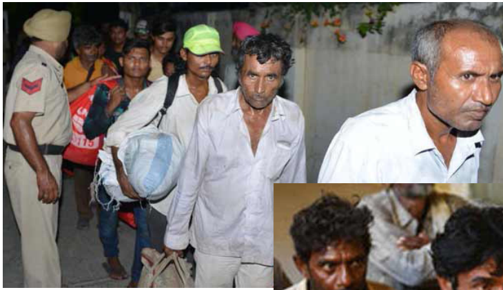
மீனவர்கள் விடுதலை செய்யப்படுவது வழக்கம்.

இரு நாட்டுத் தூதரகங்களும் செய்து கொண்ட உடன்படிக்கையின்படி நல்லெண்ண அடிப்படையில்