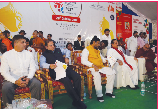
நேற்றுமுன்தினம் இந்தியாவின் மத்தியப் பிரதேசம் அவுங்கராபாத்தில் நடைபெற்ற பௌத்த திருவிழாவில் முன்னாள் இலங்கை ஜனாதிபதி மஹிந்த ராஜபக்ஷ பிரதம அதிதியாகக் கலந்துகொண்டபோது எடுக்கப்பட்ட படம்.