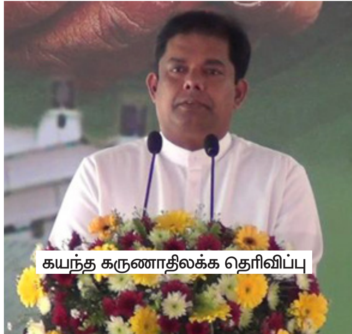
கயந்த கருணாதிலக்க தெரிவிப்பு

தனக்கு ஒரு நிலம் இல்லை. வீடு இல்லை என வேதனையுடன் தேயிலைச் செடிக்கு