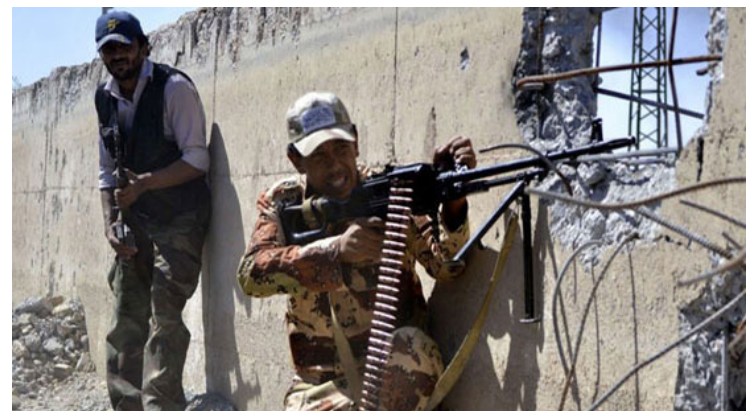
தியை மீட்பதற்காகக் கடந்த