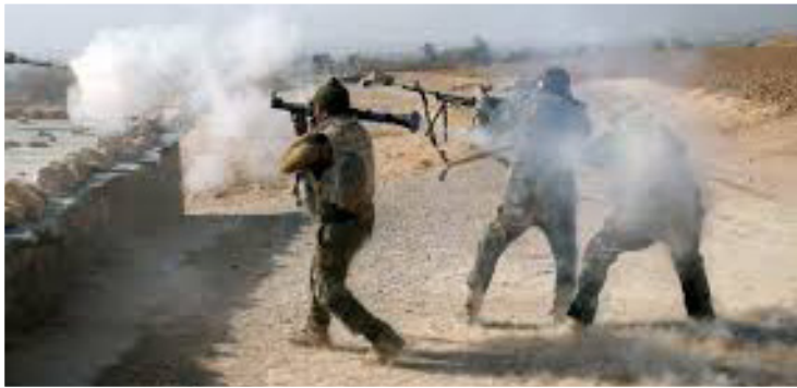
எஸ்ஸார் நகரின் முக்கிய பகு

பெற்று வரும் உள்நாட்டுப் போரில் 3 லட்சத்துக்கும் அதிகமான மக்கள் பலியாகியுள்ளனர். அங்கு போராளிகள் பிடியில் இருக்கும் முக்கிய பகுதிகளைக் கைப்பற்றவும் அரசுப் படைகள் முனைப்புடன் தாக்குதல் நடத்தி வருகின்றன. இந்த நிலையில், சிரிய நாட்டின் கிழக்கே உள்ள டேயர்