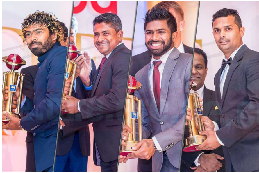
அவர் தட்டிச் சென்றார்.

இதேவேளை, இலங்கை அணியின் நட்சத்திர வேகப்பந்து வீச்சாளரான லசித் மலிங்க, வருடத்தின் சிறந்த றி-20 பந்துவீச்சாளருக்கான விருதைத் தட்டிச் சென்றமை குறிப்பிடத்தக்கது.