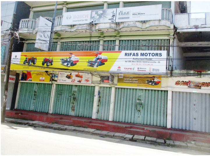
வர்த்தமானியில் பிரகடனம் செய்யுமாறு வலியுறுத்தி மூன் றாவது நாளாக பூரண ஹர்த்தால் அனுஷ்டிக்கப்பட்டது.