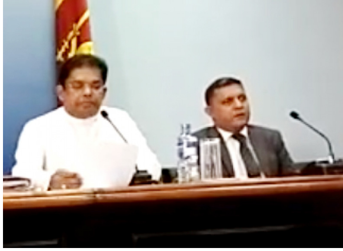
நடுத்தர அளவிலான தொழில் தொகையை வழங்க முடியும் லாளர்களுக்கான சலுகைகடன் என்று எதிர்பார்க்கப்படுகின்

இந்தக்கடன் திட்டத்திற்கான கேள்விகள் அதிகரித்து வரு கின்றமையினால் குறித்த வேலைத்திட்டத்தின் கால எல்லை நிறைவடைவதற்கு முன்னர், முழு நிதியையும் பயன்படுத்தி சிறு மற்றும்