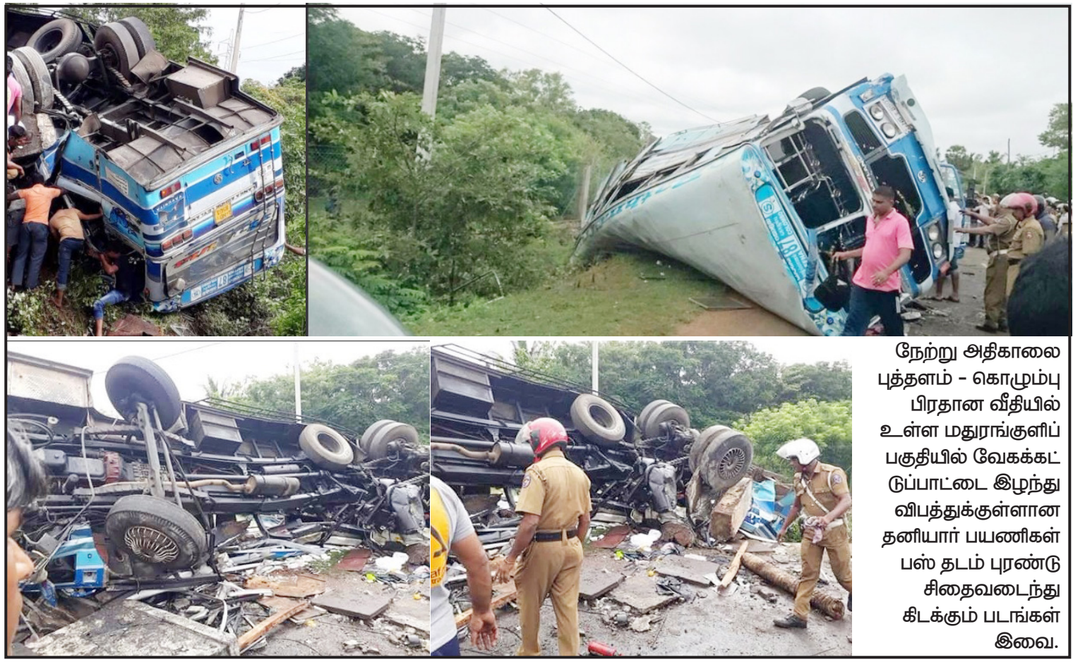
நேற்று அதிகாலை புத்தளம் - கொழும்பு பிரதான வீதியில் உள்ள மதுராங்குளிப் பகுதியில் வேகக்கட்டுப்பாட்டை இழந்து விபத்துக்குள்ளான தனியார் பயணிகள் பஸ் தடம் புரண்டு சிதைவடைந்து கிடக்கும் படங்கள் இவை.

எனவே உடனடியாக மருத்துவபீட மாணவர்கள் விரிவுரைகளுக்கு செல்ல வேண்டும். - என அறிவிக்கப்பட்டுள்ளது.