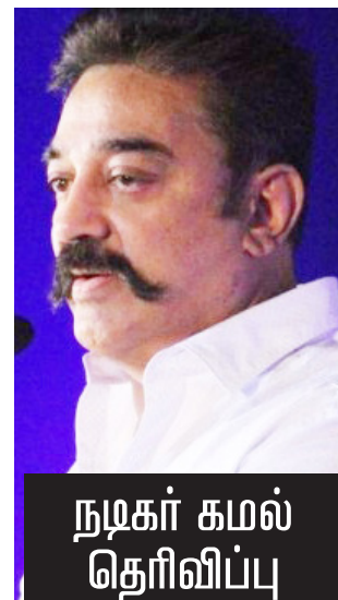
நடிகர் கமல் தெரிவிப்பு

மேலும் நான் சுவில் வங்கியில் இருக்கும் பணத்தை மீட்க முயற்சிப்பேனே தவிர, அந்த வங்கியில் பணத்தைப் போடமாட்டேன். துவக்க கூட்டம் தான் இது, இதே போன்று 50 கூட்டங்களை நடத்த வேண்டும் என கூறினார்.