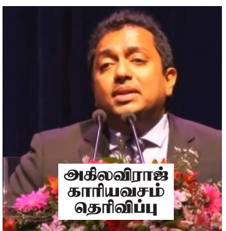
அகிலவிராஜ் காரியவசம் தெரிவிப்பு

கொழும்பு, நவ. 07 ஆசிரியர் தொழிற்றுறையை ஆகக் கூடிய சம்பளத்தொகையைக் கொண்ட தொழிற்றுறையாகத் தரம் உயர்த்துவதே தமது எதிர்பார்ப்பாகும் என்று கல்வி அமைச்சர் அகிலவிராஜ் காரிய வசம் தெரிவித்துள்ளார். மேல்மாகாண நுண்கலை கேந்திர நிலையத்தில் கொழும்பு ஆனந்தாமகனிர் கல்லூரியின் வருடாந்த பரிசளிப்பு நிகழ்வில் கலந்து கொண்டு உரையாற்றுகையிலேயே அவர் இவ்வாறு தெரிவித்துள்ளார். இதுதொடர்பில் அவர் மேலும் தெரிவித்தவை வருமாறு:-