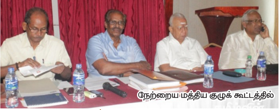
நேற்றைய மத்திய குழுக் கூட்டத்தில்

யாழ்ப்பாணம், நவ.13 “தமிழ்த் தேசியப் பற்றுதியும் ஆளுமையும் உள்ள மக்கள் பிரதிநிதிகள் உருவாக்கப்பட வேண்டும். அதற்கான வழிமுறை களையும் கலந்துரையாடல்களையும் தமிழ் மக்கள் பேரவை ஆரம்பித்துள்ளது.” நேற்று யாழ்ப்பாணத்தில் பேரவை நடத்திய கூட்டத்தின் பின்னர் விடுக்கப்பட்ட அறிக்கையிலேயே இவ்விவரம் தெரிவிக்கப்பட்டுள்ளது. அந்த அறிக்கையில் பக்கம் 18 >>>