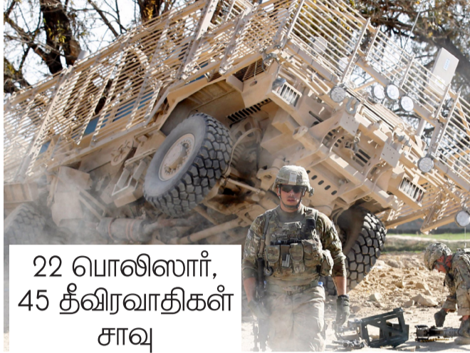
22 பொலிஸார், 45 தீவிரவாதிகள் சாவு

காபுல், நவ. 16 ஆப்கானிஸ்தான் நாட்டில் உள்ள கந்தஹார் மாகாணத்தில் 15 சோதனைச் சாவடிகளின் மீது தலிபான் தீவிரவாதிகள் நடத்திய ஆவேச தாக்குதலில் 22 பொலிஸார் உயிரிழந்தனர். 45 தீவிரவாதிகள் கொல்லப்பட்டனர் எனத் தெரிவிக்கப்படுகிறது. ஆப்கானிஸ்தானில் ஆதிக்கம் செலுத்திவரும் தலிபான் தீவிரவாதி