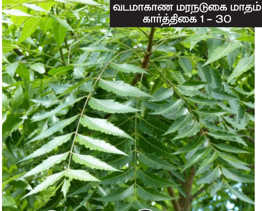
வடமாகாண மரநடுகை மாதம் கார்த்திகை 1 - 30