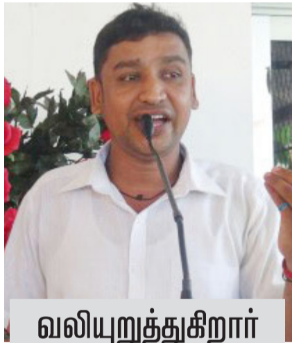
வலியுறுத்துகிறார் தமிழ் மக்கள் விடுதலை புலிகளின் கட்சிச் செயலர்

கிழக்கு மாகாணசபைத் தேர்தலில் பிள்ளையானைத் தோற்கடிக்க நினைத்த தமிழ்த் தேசியக் கூட்டமைப்பு 11ஆசனங்களுடன் 07ஆசனங்களைக் கொண்ட சமூகத்திடம் ஆட்சி