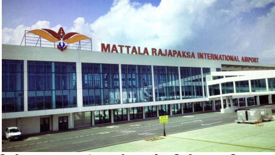
இந்தியாவுடனான கூட்டு முயற்சித் திட்டங்களுக்கு சீனா முழுமையான ஒப்புதலை வழங்கியுள்ளது.

மூலப்பாய முக்கியத்துவம் வாய்ந்த மத்தள விமான நிலைய அபிவிருத்தித் திட்டம், திருகோணமலை எண்ணெய்தாங்கி அபிவிருத்தித் திட்டம் உள்ளிட்ட