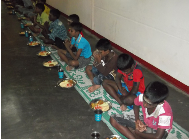
கொழும்பு, நவ. 27

சிறுவர்களை சிறுவர் இல்லங்களில் தங்கவைக்காது பெற்றோரால் அர்ப்பணிப்புடன் பராமரிக்கும் முறை ஒன்றை அறிமுகம் செய்வதில் தேசிய சிறுவர் பாதுகாப்பு அதிகாரசபை கவனம் செலுத்தியுள்ளது.