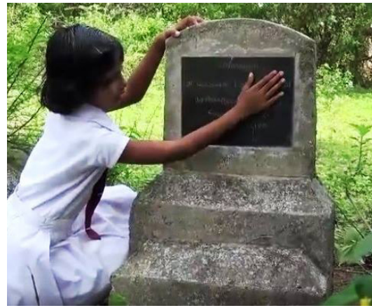
உரிமைகள் கிடைப்பதற்கான ஏதுக்கள் ஏதுமில்லை என்பதால் நாமே எமது

சிங்களதேச பிரதான அரசியல் கட்சிகள் எவையும் தமிழரின் தேசிய இனப் பிரச்சினையின் அடிப்படைகளைக் கூட அங்கீகரிக்கத் தயாராக இருக்கவில்லை. வடக்கு - கிழக்கு மாநிலம் தமிழர்களின் வரலாற்றுத் தாயகம் என்பதையோ, தமிழர்கள் ஒரு தனித்துவமான இனக்கட்டமைப்பைக் கொண்ட மக்கள் சமூகம் என்பதையோ, தமிழீழ மக்களுக்கு பிரிந்து செல்லும் உரிமையுடனான சுயநிர்ணய உரிமை உண்டு என்பதையோ எந்தவொரு சிங்கள அரசியல் இயக்கமும் ஏற்றுக்கொள்ளவில்லை.