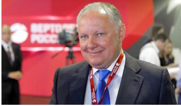
பலை விற்கும் உடன்பாட்டில் கையெழுத்திடுவதற்காக, ரஷ்யாவின் Rosborono

இந்தக் குழுவினர் ஏனைய ரஷ்ய பாதுகாப்பு கருவிகளை வழங்குவது குறித்தும் பேச்சுக்களை நடத்துவர் என்று எதிர்பார்க்கப்படுகிறது. இந்த ரஷ்ய நிறுவனம், போர் டாங்கிகள், சண்டை வாகனங்கள், போர் பயிற்சி விமானங்கள், குண்டு வீச்சு விமானங்கள், விமானங்கள், ஹெலிகொப்டர்கள், கப்பல்கள், படகுகள், நீர்மூழ்கிகள், ஆயுதங்கள், வெடிபொருள்களையும் வழங்க முன்வந்துள்ளது. இலங்கைக்குப் போர்க்கப்