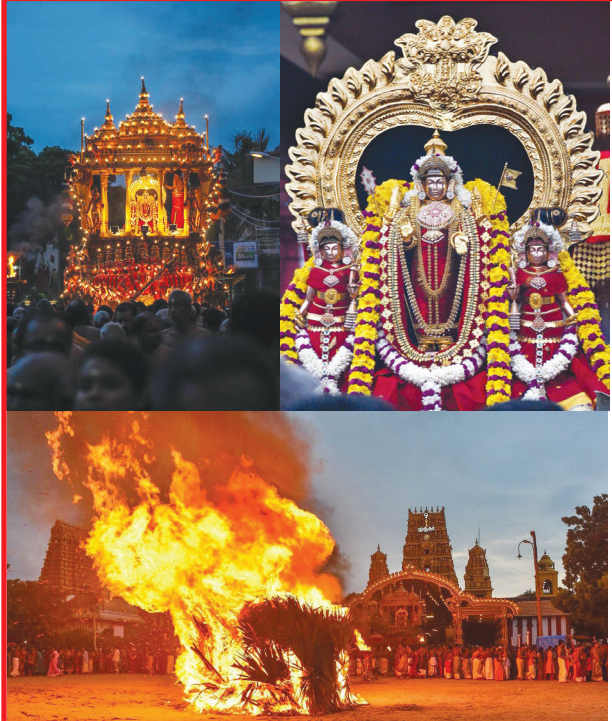
திருக்கார்த்திகையை முன்னிட்டு நேற்று முன்தினம் நல்லூர் கந்தன் ஆலயத்தில் விசேட உற்சவமும், சொக்கப்பனை ஏற்றும் நிகழ்வும் இடம்பெற்றன. பெரும் எண்ணிக்கையான பக்தர்கள் இதில் கலந்துகொண்டனர்.