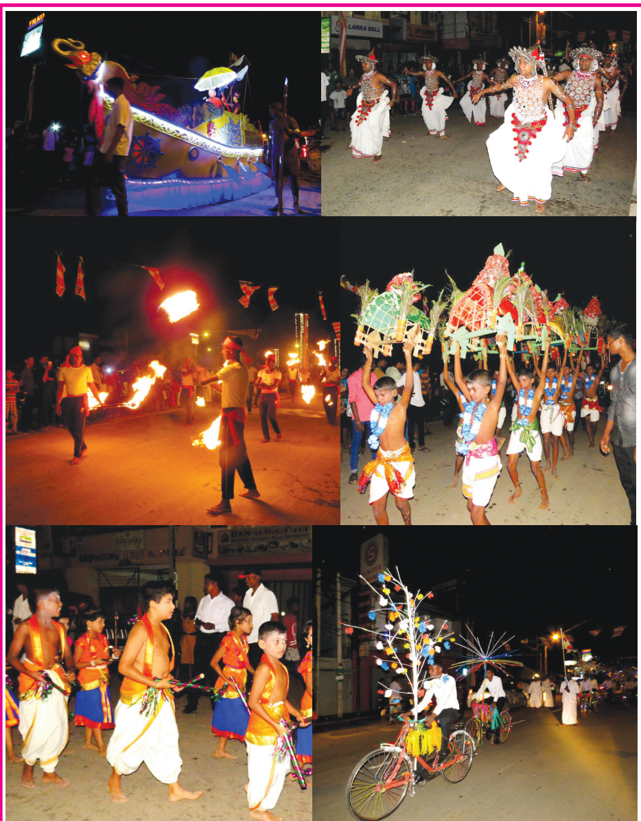
யாழ்ப்பாணம் ஆரியகுளம் சந்தியில் அமைந்துள்ள நாகவிகாரையில் ஏற்பாட்டில் நேற்றைய தினம் இடம்பெற்ற பெரஹரா நிகழ்வுகளின் போது எடுக்கப்பட்ட படங்கள்.

மீட்கப்பட்ட மதுபானப் போத்தல்கள் யாழ். பொலிஸு நிலையத்துக்கு எடுத்துச் செல்லப்பட்டன. கைது செய்யப்பட்டவரை அவரிடம் இருந்து மீட்கப்பட்ட மதுபானப் போத்தல்களுடன் நீதிமன்றத்தில் முற்த்துவதற்கான நடவடிக்கையை பொலிஸார் மேற்கொண்டு வருகின்றனர். (ஐ-7)