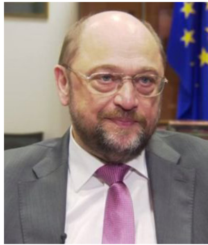
கொண்டிருப்பது நினைத்தும் பார்க்க முடியாத ஒன்று.” ஜனாதிபதி ஸ்ரைன்மையர், இவரின்

இந்த போக்கை அங்கத்தவர் களுக்கு விளங்கப்படுத்தி கட்சியை மாற்றுவதற்கு தயாரிப்பு செய்வது இப்போது கட்சி தலைவர் சூல்ஸிடம் விடப்பட்டுள்ளது. இது தான் SPD தலைமையகமான வில்லி பிராண்ட் இல்லத்திலிருந்து வரும் தகவலாகும். அரசில் SPD பங்கெடுப்பதன் மீது அங்கத்தவர்களிடையே அவர் வாக்கெடுப்பு நடத்தவிருப்பதாக சூல்ஸ் ட்வீட்டரில் அறிவித்தார். டிசம்பர் ஆரம்பத்தில் கட்சி மாநாட்டை நடத்த SPD திட்டமிட்டுள்ளது.