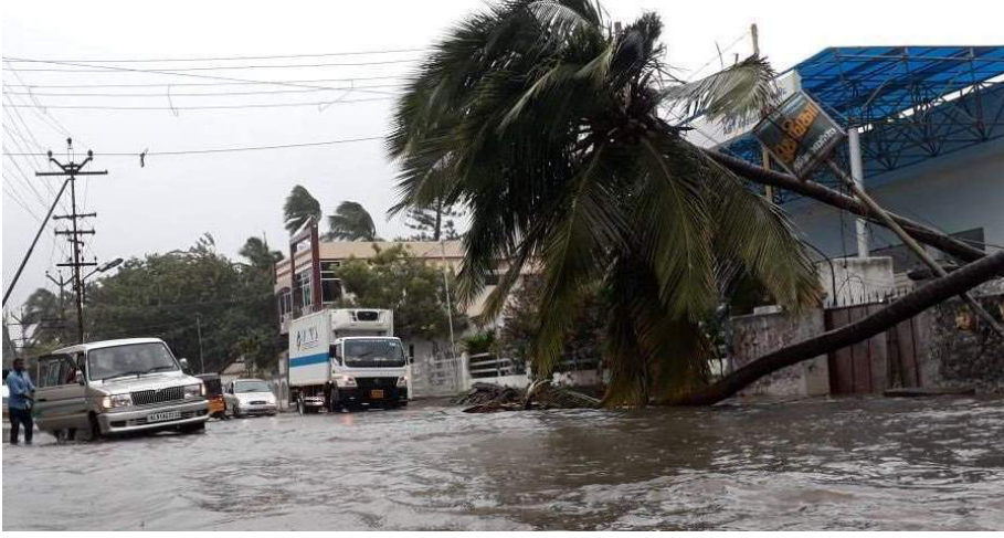
எச்சரிக்கைகளை மக்களுக்கு விடுத்திருந்தால் இழப்புக்களை வரையறுத்திருக்கலாம் எனச் சுட்டிக்காட்டப்பட்டுள்ளது.

கொழும்பு, டிசெ. 04 காலநிலை அபாயம் தொடர்பில் சர்வதேச ஊடகங்களால் விடுக்கப்பட்ட எச்சரிக்கை உதாசீனம் செய்யப்பட்டுள்ளது எனக் குற்றம் சுமத்தப்பட்டுள்ளது. கொழும்பு ஊடகமொன்றே இந்த குற்றச்சாட்டை முன்வைத்துள்ளது. இதன் அடிப்படையில், ஓக்கி சூறாவளி தொடர்பில் சர்வதேச ஊடகங்கள் முன்கூட்டியே எச்சரிக்கை விடுத்திருந்தன. எனினும், இந்த எச்சரிக்கையை இலங்கை வளிமண்டலவியல் திணைக்களம் உதாசீனம் செய்துள்ளது எனத் தெரிவிக்கப்படுகிறது. ஓக்கி சூறாவளி தொடர்பில் வளிமண்டலவியல் திணைக்களம் உரிய