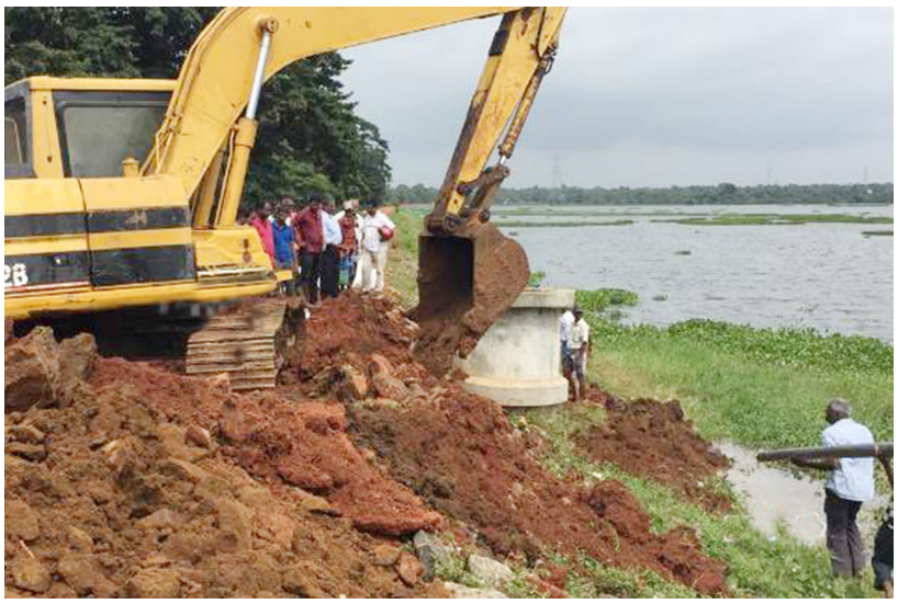
அமைப்பு மற்றும் நீர்ப்பாசன திணைக்களத்தினர் விரைந்து செயற்பட்டு குளக்கட்டை புனரமைத்து வருகின்றனர். இதன் காரணமாக உடைப்

வவுனியா, டிசெ. 04 வவுனியா குளம் உடைப்பெடுக்க இருந்த நிலையில், நீர்ப்பாசன திணைக்களத்தின் துரித பணியில் அனர்த்தம் ஒன்று தவிர்க்கப்பட்டுள்ளது. வவுனியா குளத்தில் துளுசு அமைந்திருந்த பகுதியை சூழ மண் அரிப்பு ஏற்பட்டு குளத்தின் உட்புறமாக பெரிய துவாரம் ஏற்பட்டு குளக்கட்டு உடையும் நிலை ஏற்பட்டிருந்தது. நேற்றுக் காலை குளத்தில் மீன் பிடியில் ஈடுபட்டிருந்தவர்கள் குளக்கட்டில் நீரின் போக்கு வழமைக்கு மாறாகக் காணப்பட்டதை அடுத்து நீர்ப்பாசனத் திணைக்களத்திற்கு அறிவித்துள்ளனர். இதனையடுத்து கமக்காரர்