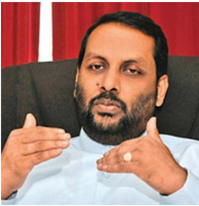
வெளியிட்டார். இதுதொடர்பில் அவர் மேலும் தெரிவித்தவை வருமாறு:- இருநாட்டு மீனவப் பிரச்சி

கொழும்பு, டிசெ. 06 இலங்கைக் கடற்பரப்பில் அத்து மீறுகின்ற இந்திய மீனவர்களைக் கைது செய்யவும், அவர்களிடம் இருந்து தண்டப் பணம் பெற்றுக் கொள்வதோடு படகுகளையும் பறிமுதல் செய்யும் திட்டத்தை அமுல் படுத்தவும் எதிர்பார்ப்பதாக ஹீலங்கா மீன்பிடி அமைச்சர் மஹிந்த அமரவீர அறிவித்துள்ளார்.