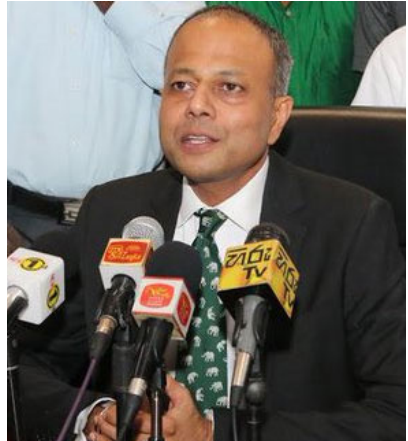
அதிரடிப்படையினர் நீக்கப்பட வில்லை. எதிர்காலத்தில் இவ்வா றான நிலைமை ஏற்படுவதைத் தடுப்பதற்காக பொலிஸ் சோதனை பிரிவொன்று அமைக்கப்பட்டுள் ளது.

கொழும்பு, டிசெ. 06 பொலிஸாரும் முப்படையின ரும்பொறுப்புடன்செயற்பட்டமை யாலேயே சமீபத்திய ஹிந் தோட்டை சம்பவத்தைக் கட்டுப் படுத்த முடிந்ததென்று சட்டம் ஒழுங்கு மற்றும் தெற்கு அபிவி ருத்தி அமைச்சர் சாகல ரத்னாயக்க நேற்று நாடாளுமன்றத்தில் தெரி வித்தார்.