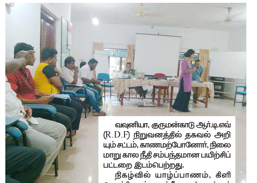
வவுனியா, குருமன்காடு ஆர்.டி.எஸ் (R.D.F) நிறுவனத்தில் தகவல் அறியும் சட்டம், காணமற்போனோர், நிலைமாறு கால நீதி சம்பந்தமான பயிற்சிப்பட்டறை இடம்பெற்றது. நிகழ்வில் யாழ்ப்பாணம், கிளிநொச்சி, முல்லைத்தீவு, மன்னார், புத்தளம் ஆகிய பகுதிகளில் வருகை தந்தவர்களுடனான கலந்துரையாடல் இடம்பெற்றபோது... (இ-19)