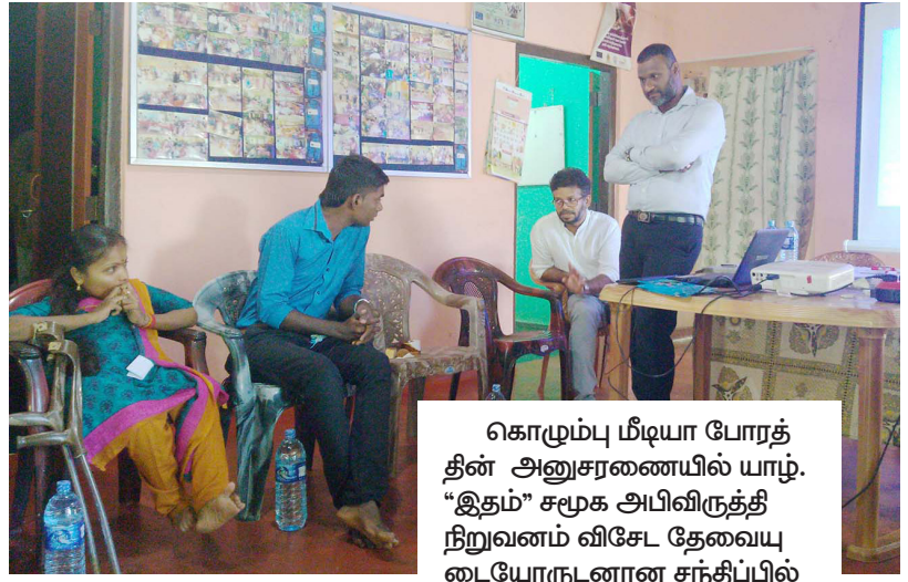
கொழும்பு மீடியா போரத்தின் அனுசரணையில் யாழ். "இதம்" சமூக அபிவிருத்தி நிறுவனம் விசேட தேவையுடையோருடனான சந்திப்பில் கொக்குவில், பருத்தித்துறை, கற்கோவளம் ஆகிய பகுதிகளில் வசிக்கும் விசேட தேவையுடையோருடன் அவர்களின் பிரச்சினைகள் பற்றி ஆராயப்பட்டது. அந்த நிகழ்வின் பதிவுகள்... (இ-19)