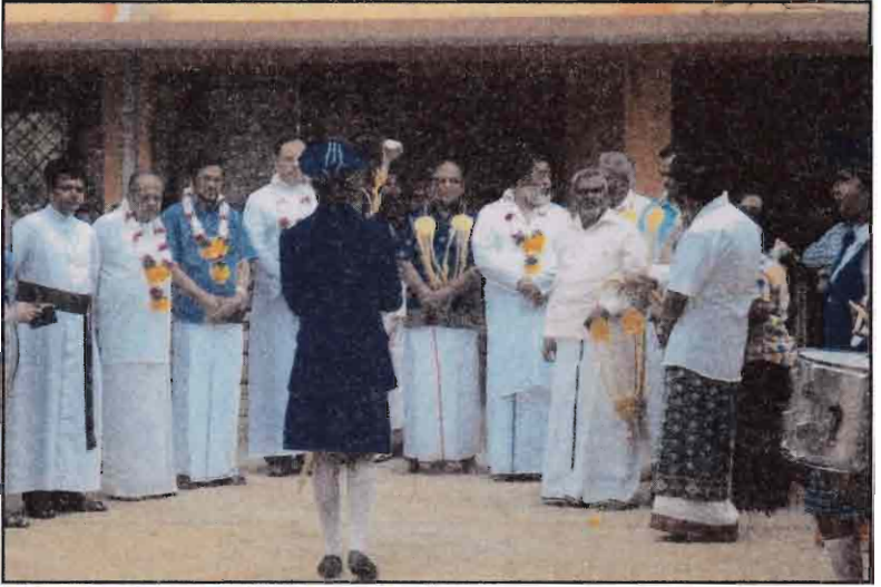
மாகாண பொங்கல் தின நிகழ்வில் விருந்தினர் வரவேற்பு - 2017