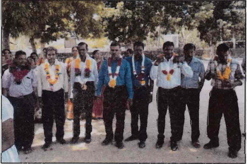
ஆசிரியர் தின நிகழ்வில் விருந்தினர் வரவேற்பு - 2016