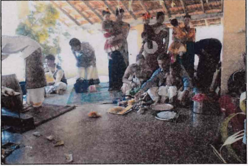
விஜயதசமி நிகழ்வில் ஏடு தொடக்குதல் - 2016