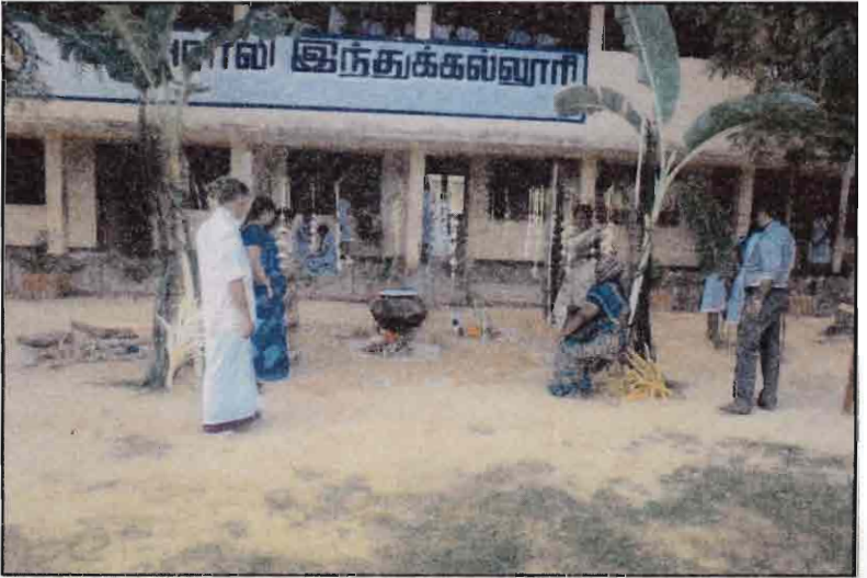
பாடசாலையின் பொங்கல் விழா - 2017