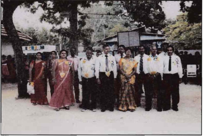
வருடாந்த இல்ல மெய்வல்லுநர் நிகழ்வில் விருந்தினர் வரவேற்பு - 2017