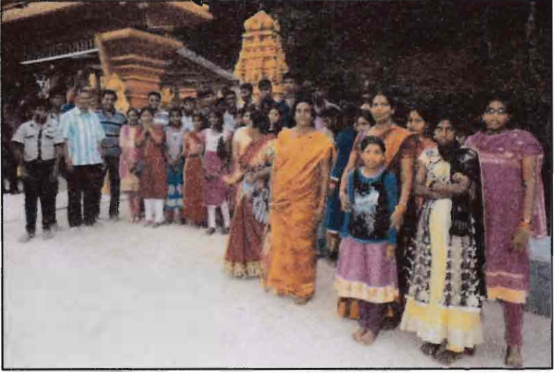
பாடசாலை கல்விச் சுற்றுலாவின் போது சீத்தாளலிய கோவிலில்