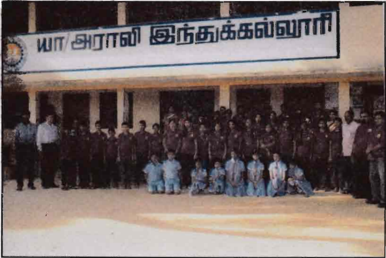
கண்டி தலாத்துலுயா தமிழ் மகா வித்தியாலய மாணவர்கள் பாடசாலைக்கு வருகை தந்த போது