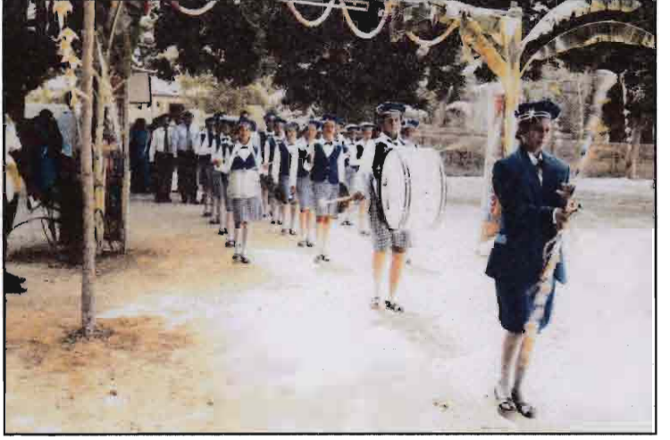
பாடசாலையின் பரிசளிப்பு நிகழ்வில் விருந்தினர் வரவேற்பு - 2016