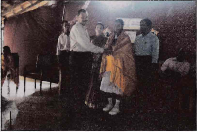
க.பொ.த சாதாரண தரத்தில் 8A,B பெறுபேற்றைப் பெற்ற மாணவியை கௌரவிக்கும் நிகழ்வு