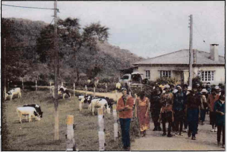
பாடசாலையின் கல்விச் சுற்றுலாவின் போது அம்பேவெல NLDB (f) பாமில்