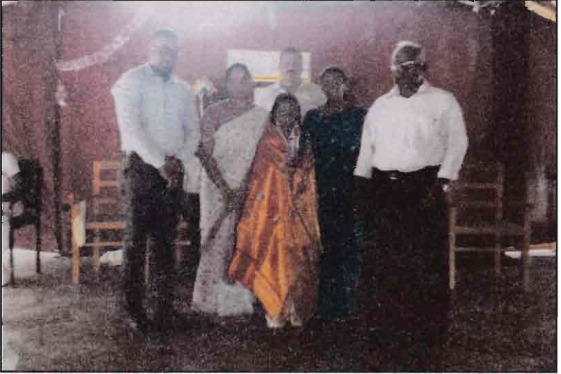
புலமைப்பரிசில் சித்தியடைந்த மாணவியை கௌரவிக்கும் நிகழ்வு