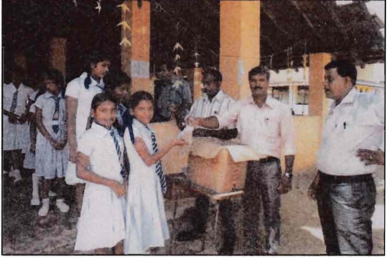
சிறுவர் தின நிகழ்வில் மாணவர் கௌரவிப்பு - 2016