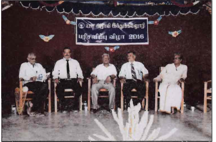
பரிசளிப்பு நிகழ்வில் விருந்தினர்கள் - 2016