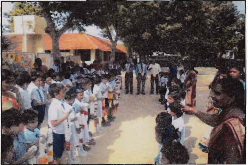
கால்கோள் விழா நிகழ்வில் விருந்தினர் வரவேற்பு - 2017