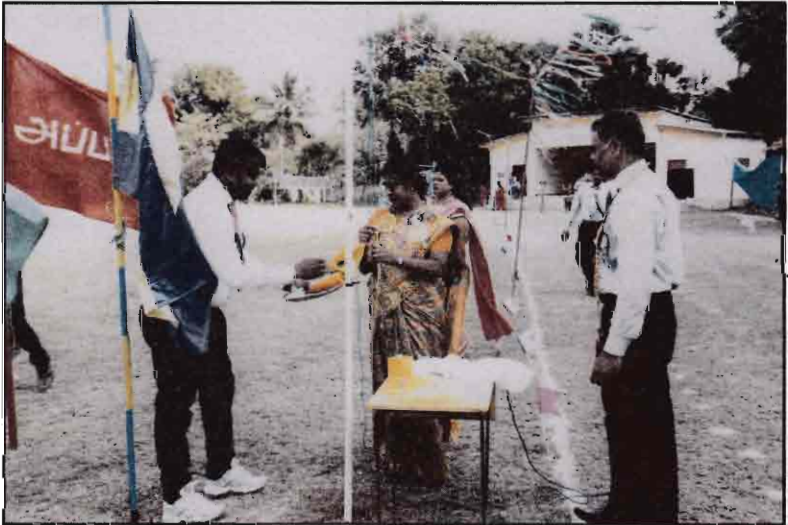
வருடாந்த இல்ல மெய்வல்லுநர் நிகழ்வில் கொடியேற்றுதல் - 2017