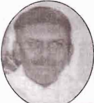
வண.எஸ்.ச. சூனமல் 1975