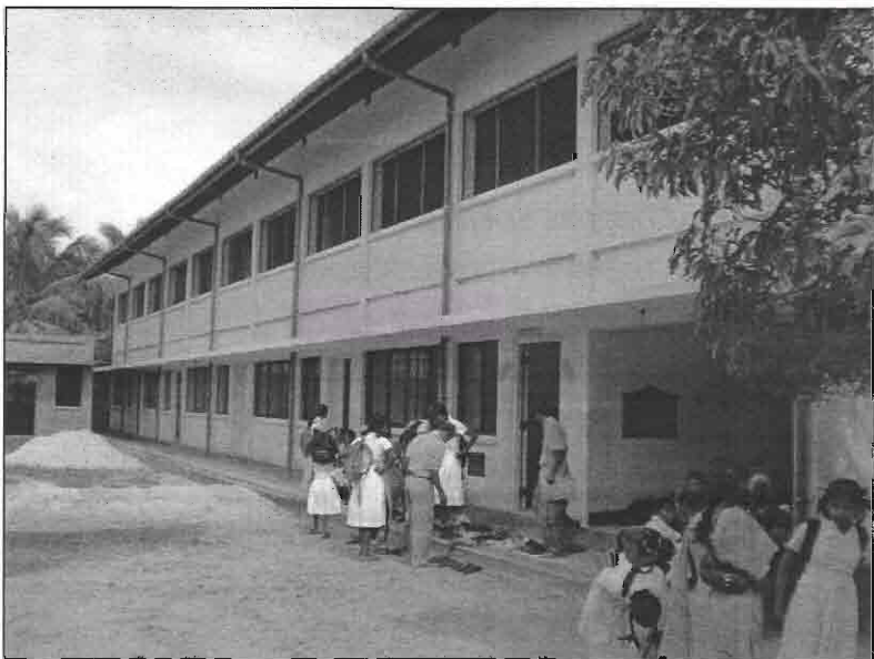
Seen here is the two story building donated to the school by the NGO - NECORD.