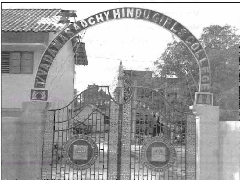
The new gate installed at the entrance to the school with help from the Sydney branch, Australia.