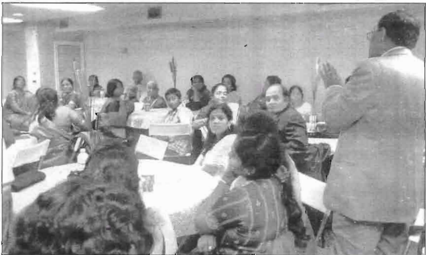
Cross Section of the VHGC PPA, Canada-USA Annaul General Meeting, 2009