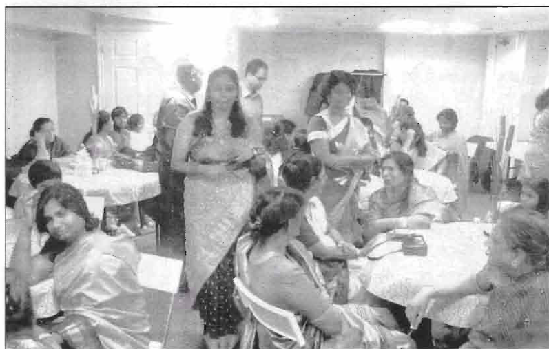
VHGC PPA, Canada-USA Annaul General Meeting, 2009