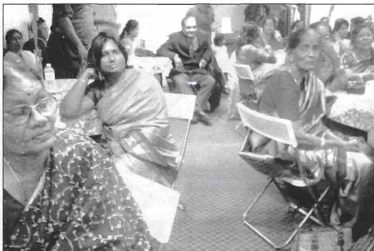
VHGC PPA, Canada-USA Annaul General Meeting, 2009