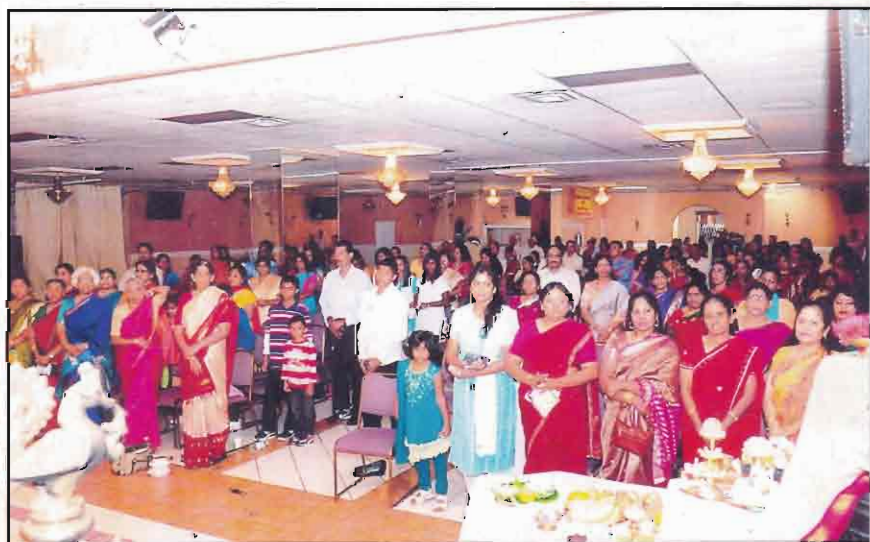
Section of the gathering participated at the Navarathiri function, 2009