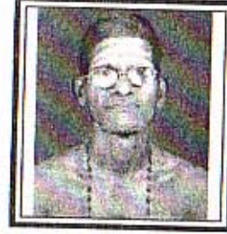
கு. க. சீவக்கொழுந்து