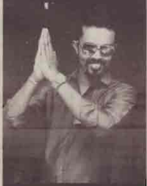
ஹோலிக்காரரின் வாக்குமுலம் (கோலிப் பண்டிகையை ஏற்பாடு செய்த தளர் அமிரிதலிங்கம் பூதாதித்திக்கு தெரிவித்த கருத்துக்கள்)

யாழ்ப்பாணத்து இளைஞர்களையும், புலதிகளையும் குறிசையத்துக் கூடிக் காலங்களில் நடத்தப்பட்ட பல திகழ்புகளில் பின்னணிகள் ஆழமான அரசியல் நோக்கங்கள் கொண்டதாக இருக்கதை அனைவரும் அறிந்தே இருக்கனர். கவாசாசி சிாழியினம் ஏற்படுத்தக் கூடிய பின்னணிகளைக் கொண்டு, எய்வாக் தீண்டாமை அடிப்படையில் அனைவரின் பட்டிப் பட்டிருக்கன. கூடிக் சில மாதங்களுக்கு முன்னர் ரதி சுவலம் மனேஜ்மென்ட் நிறுவனம் ஒரு இளைஞர்களைக் கள்ப்பூட்டுகின்ற நோக்கோடு, தெகிவளையில் நடத்திய திகழ்ச்சி ஒன்றில், ஆண்டுகளுக்குரிய அனுமதியை ரூபா.1000.- என்றும் பெண்டுகளுக்குரிய