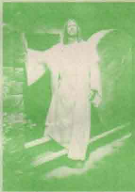
சிறுட்சிவ, கயூட்டிஸ்டிம்ப்ஸ் புனித ஈஸ்வரர் குருத்துவக் கல்லூரி

கிறிஸ்து ஏன் உயிர்த்தெழ வேண்டும்? என்ற வினாவிற்கு சமரந்தரமாக நாம் இன்று மொகு வினாவையும் எழுப்பமுடியும். நாம் ஏன் கிறிஸ்துவின் உயிர்ப்பில் நம்பிக்கை கொள்ள வேண்டும்? என்பது தான் அந்த சமரந்தரமான வினாவாகும். எபிரேயருக்கு எழுதப்பட்டிருள்ள மடலிலே குறிப்பிட்டுள்ளது போல "இயேசுக்கிறிஸ்து ஒரு மூறை தம் உடலை பலியாக செலுத்தியதன் மூலம் நம் தாயவராக்கப்பட்டிருக்கிறோம்" (எபி.10:10) இயேசுவின் உன்னத பலியான சினுவைச் சாவிலே எக்காலத்துக்குமுரிய உலக மக்கள் அனைவரும் மீட்கப்பட்டிருக்கின்றார்கள். எனவே நாம் ஏன் கிறிஸ்துவின் உயிர்ப்பிலே நம்பிக்கை கொள்ளவேண்டும்? தனது உடலை பலியாக்கியதன் மூலம் மானிடை குலத்தை மீட்டுக்கொண்ட இயேசு ஏன் உயிர்த்தெழ வேண்டும்?