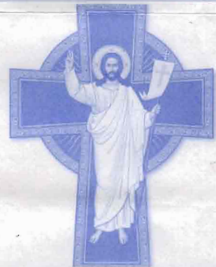
தொகுப்பு: டி.கே.வீகரன் ஆசிரியர்

கிறிஸ்துவின் உயிர்ப்பு ஒரு வரலாற்று நிகழ்வு. மறைக்க முடியாத மறுக்க முடியாத ஒரு சரித்திர உண்மை. சாவுக்கு சாவுமணி அடித்த பேரதிசயம். இயேசுவைப் போல் நாமும் உயிர்ப்பின் மக்களாக வாழ உயிர்த்த இயேசு மூன்று கொடைகளை எமக்கு வழங்கியுள்ளார்.