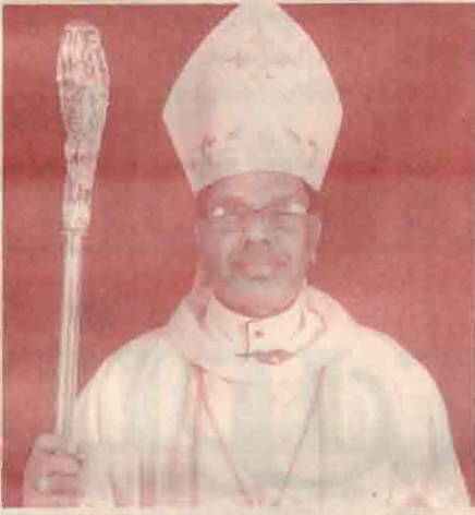
ஆண்டவன் இயேசுவின் உயிர்ப்புப் பெருவிழாவைக் கொண்டாடும் அனைவருக்கும் உயிர்ப்பு பெருவிழா வாழ்த்துக்களைத் தெரிவித்துக் கொள்கிறேன். ஆண்டவன் இயேசுவின் உயிர்ப்புப் பெரு

“உயிரோடு இருப்பவரைக் கல்லறையில் தேடுவதேன்? அவர் இங்கே இல்லை. அவர் உயிருடன் எழுப்பப்பட்டார்.” (லூக். 24: 5,6)