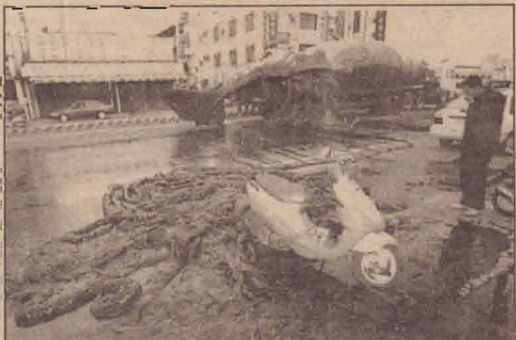
தாடிவானில் ஏற்றுமதிக்கு தயாராக வேளையில் வயிறு வெடித்து உட்புறம் சிதைந்து காணப்படும் 56அடி நீளமான திமிங்கலம்.

(வாஷிங்டன்) சதாம் ஹுசைனிமீ நடந்த விசாரணைகளின் போது தாம் மிகவும் பயனுள்ள தகவல் ஒன்றைப் பெற்றிருப்பதாக அவரிடம் விசாரணை நடத்திய அமெரிக்க புலனாய்வுத்துறை அதிகாரிகள் தெரிவித்துள்ளனர். ஆனால் அது என்ன தகவல்? என்பது குறித்துத் தெரிவிக்க அவர்கள் மறுத்துவிட்டனர். தாம் பெற்ற தகவலை உறுதி செய்த பின்னரே அது குறித்து அறிவிப்பீயம் என்றும் அவர்கள் தெரிவித்துள்ளனர். தொடர்ந்து அவரிடம் விசாரணைகள் நடத்தப்பட்டு வருகிறது. விரைவில் அவர் நிதிமன்றில் வழக்கிற்காக ஆஜர்ப்படுத்தப்படுவார் என்ற பென்டகன் அதிகாரியொருவர் தெரிவித்துள்ளார்.