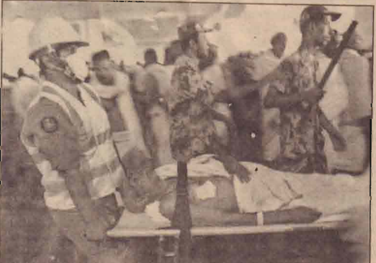
நேற்றுமுன்தினம் சவுதி அரேபியாவில் ஹஜ்யாத்திரையின் போது ஏற்பட்ட வெடிச்சலில் காயப்பட்ட ஒருவரை கொண்டு செல்லும் மருத்துவத் தொண்டர்கள்.

ஷெக் கூறியுள்ளார். இதேவேளை பி.பி.சி. செய்தி நிறுவனத்திற்கு களங்கம் ஏற்படும் வகையில் அமைந்திருக்கும் ஹட்டன்ஸ் அறிக்கைக்கு எதிராக ஆர்ப்பாட்டங்கள் தொடர்கின்றன.