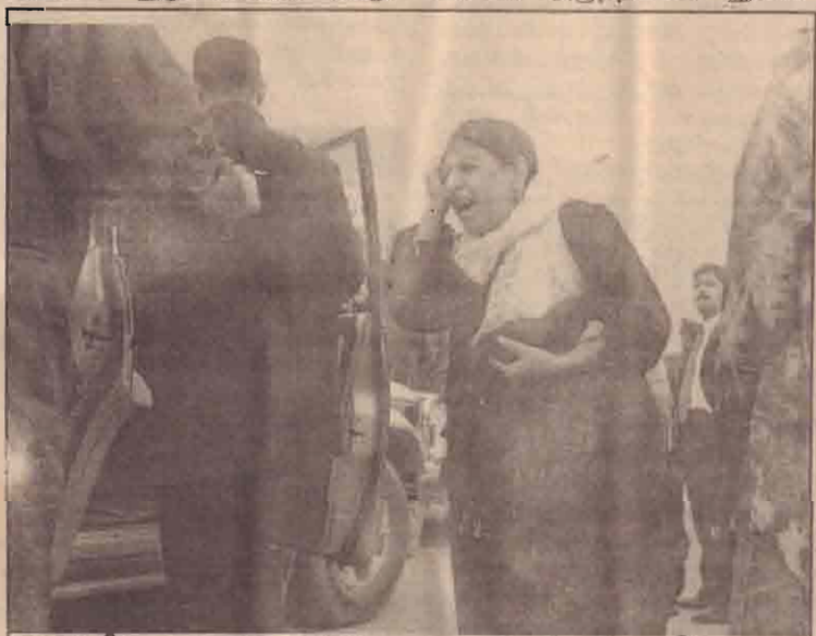
ஈராக்கில் நடைபெற்ற தற்கொலை குண்டுத்தாக்குதலில் தமது உறுவீனர் மலியானதையறிந்த குர்திஷ் பெண் வைத்தியசாலைக்கு முன்பாக புலம்புவதைக் காணலாம்.