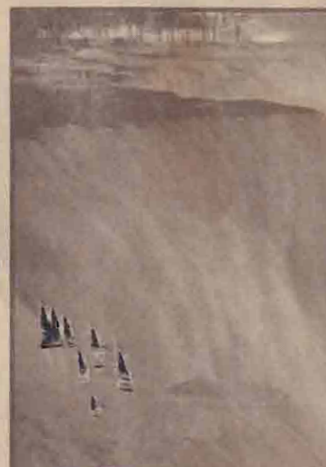
அமெரிக்காவிற்கும், கனடாவிற்கும் இடையிலுள்ள நயாக்கர் நீர்வீழ்ச்சி.

கொரியா, அவுஸ் திரேலியா, வடகொரியா, யப்பான், ரஷ்யா, சீனா ஆகிய நாடுகள் பீஜிங்கில் மேற்கொண்ட பேச்சுவார்த்தைகளைத் தொடர்ந்து இவ் இணக்கம் ஏற்பட்டுள்ளதாக அவுஸ்திரேலிய பேச்சாளர் ஒருவர் தெரிவித்துள்ளார்.