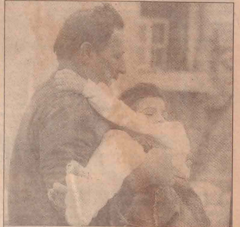
அண்மையில் ஈராக்கில் பாக்கித் நகரில் பொலிஸ் நிலைய மருகில் நடைபெற்ற குண்டுத்தாக்குதலில் காயமுற்ற தனது மகனை வைத்திய சாலைக்கு கொண்டு விரையும் ஈராக்கியர்.

ஒய்மான் பின்லேன் தலைமையிலான குழுவிடமிருந்து தகவல் வழங்க முற்பட்டதாகக் கூறப்படும் குற்றச் சாட்டில் அமெரிக்கப் படைப்பதினாரி ஒருவர் கைது செய்யப்பட்டுள்ளார். அமெரிக்க இராணுவ இரகசியங்களைத் தெரிவிக்க முற்பட்டதோடு பல்வேறு குற்றச் சாட்டுக்கள் தீவிர மீது சுமத்தப்பட்டுள்ளன.