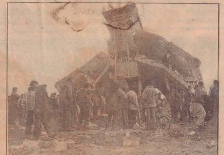
காசா முனையில் இஸ்ரேலிய இராணுவத்தால் தகர்க்கப்பட்ட வீடொன்றைப் பார்வையிடும் பலஸ்தீனர்கள்.

இச்சட்டத்தின் கீழ் கைது செய்யப்பட்டவர்களின் வழக்குகளை ஆராய்வு மாறு உயர்மட்ட பொடோ மறுஆய்வுக்குழு பரிந்துரைத்ததையடுத்தே, இத்தகைய முடிவு எடுக்கப்பட்டதாக மாநில உள்நுறை அமைச்சர் கூறியுள்ளார். மகாராஸ்திராவில் சோலாப்பூரில் சென்றவரும் நடந்த கலவரத்தில் சம்பந்தப்பட்டதாகக் கூறப்பட்டே 29 பேரும் பொடோ சட்டத்தில் கைது செய்யப்பட்டனர் என்பது குறிப்பிடத்தக்கது.