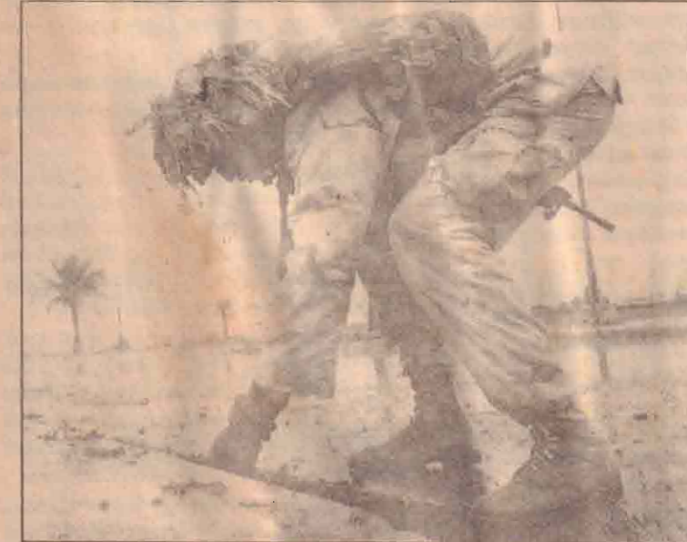
ஈராக்கில் அடிக்கடி குண்டுத்தாக்குதல்கள் நடைபெறுவதால் டிக்கிரிட் வீதியில் குண்டுக்களைத் தேடி சோதனையில் ஈடுபட்டிருக்கும் அமெரிக்க இராணுவ வீரர் ஒருவர்.