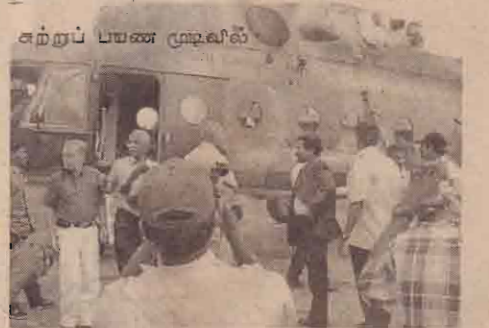
சுற்றுப் பயண முடிவில்

* ஐரோப்பிய நாடுகளுக்கான விஜயத்தை மேற்கொண்டிருந்த அரசியல் துறைப் பொறுப்பாளர் தலைமையிலான குழுவினர் கிளிநொச்சி வந்தடைந்தனர்.