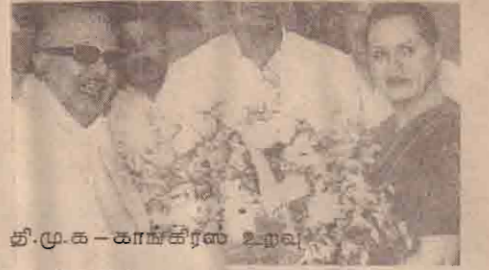
தி.மு.க - காங்கிரஸ் உறவு

* காங்கிரஸ் கட்சியும், திராவிட முன்னேற்றக் கழகமும் இருபத்தியிரண்டு வருடங்களுக்கு பின்னர் தேர்தல் கூட்டணி ஏற்பட்டபின் தி.மு.க. தலைமையகத்தில் சோனியா கருணாநிதியைச் சந்தித்தார்.