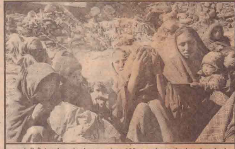
துருக்கியின் ஸ்தான்புல் நகருக்கு 100 மைல்களுக்கப்பால் ஏற்பட்ட பூமியதிர்ச்சியில் வீடு வாசல்களையழிந்து அகதிகளான நிலையில் காணப்படும் மக்கள்.

(பாரிஸ்) பிரான்ஸ் இஸ்ரேல் ஆகிய நாடுகள் தமக்கிடையிலான கடந்த கால கசப்புணர்வுகளை நீக்கி உறவுகளை வலுப்படுத்தும் முயற்சியில் ஈடுபட்டுள்ளனர். இஸ்ரேலிய சனாதிபதி மோசேகச்சாய் பிரான்சிற்கு விஜயம் செய்துள்ளார். இவர் இதன்போது பிரான்சின் தலைவர் ஜக்கிராக்குடன் பேச்சுவார்த்தையையும் நடத்தியுள்ளார். இந்தப் பயணமானது இஸ்ரேலிய தலைவர் ஒருவர் பதினெட்டு வருடங்களின் பின்னர் பிரான்சிற்கு விஜயம் செய்த முதல் சந்தர்ப்பமாக அமைந்துள்ளது. பிரான்ஸில் யூதர்களின் மீது மேற்கொள்ளப்பட்ட தாக்குதல்கள் மத்திய கருத்து பிரச்சினை தொடர்பாக தெரிவிக்கப்பட்ட கருத்துக்கள் என்பவற்றின் அடிப்படையில் இரண்டு நாடுகளுக்கிடையிலான