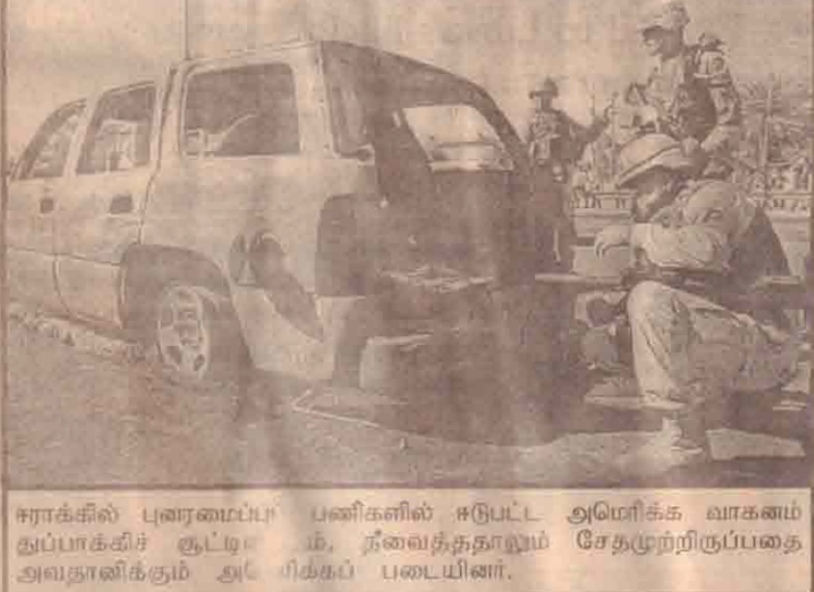
சராக்கில் புரையடிப்புப் பணிகளில் ஈடுபட்ட அமெரிக்க வாகனம் துப்பாக்கிச் சூட்டில் தீவைத்ததாலும் சேதமுற்றிருப்பதை அவதானிக்கும் அமெரிக்கப் படையினர்.

சனாதிபதி அரிஸ்ட்டிடஸ் பதவி களிர்க்கப் போராட்டம் கிளர்ச்சியாளர்கள் கெயிட்மியின் மையப் பகுதியில் உள்ள முக்கிய நகரை ஊடுருவி உள்ளனர். காங்கிரஸ்களின் இந்த ஊடுருவலின் போது ரொடின் நிலையம் ஒன்று தாக்கப்பட்டுள்ளதோடு உயர் அதிகாரி ஒருவரும் அவரது மெய்ப்பாதுகாவலர் ஒருவரும் கட்டுக் கொல்லப்பட்டுள்ளனர். இதேவேளை கெயிட்மியின் தலைநகரில் பத்திரிகையாளர் மாநாடு ஒன்றை நடத்திய அரிஸ்டிடஸ் இந்தப் படுகொலை ஒரு வெடிக்கேட்டான விடயமாகும் என்று கூறி இருக்கின்றார். தம்முடன் பேச்சுவார்த்தை நடந்து