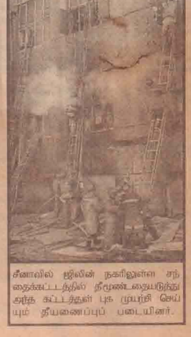
சீனாவில் ஜிஸின் நகரிலுள்ள சந்தேகப்பட்டத்தில் நீழுண்டதையடுத்து அந்த கட்டடத்தை புக முயற்சி செய்யும் தீயணைப்புப் படையினர்.

முக்கியமாக குற்றம் சாட்டப்பட்டிருந்த சந்தேகநபரான புதுடில்லியில் பலத்த பாதுகாப்பின் மத்தியில் இருக்கும் திகார் சிறையில் இருந்து தப்பியோடியுள்ளார். மேற்படிநபர் தப்பியது நேற்றுக் காலை பொலிசாருக்குத் தெரிய வந்துள்ளதாக செய்திகள் தெரிவிக்கின்றன. உத்தராஞ்சல் பொலிஸ் அதி காரிபோல் வேடமணிந்து வந்து அவர்களது கூட்டாளிகள் சிறையில் இருந்து அவரை அழைத்துச் சென்றாவிட்டனர். உத்தராஞ்சல் நீதிமன்றத்திற்கு அவரை அழைத்துச் செல்ல உத்தராஞ்சல் பொலிசார் வந்தபோது சந்தேக தப்பிச் சென்றது தெரியவந்துள்ளது. நாடாளுமன்ற உறுப்பினராக இருந்த பூலாந்தேவி 2001ஆம் ஆண்டு யூலைமாதம் புதுடில்லியில் அவரது அரச இல்லத்திற்கு வெளியே கட்டுக் கொல்லப்பட்டார் என உட்ப ஊந்து பேசும் இத்தகைய செய்தியைக் கைது செய்யப்பட்டிருந்தார்கள்.