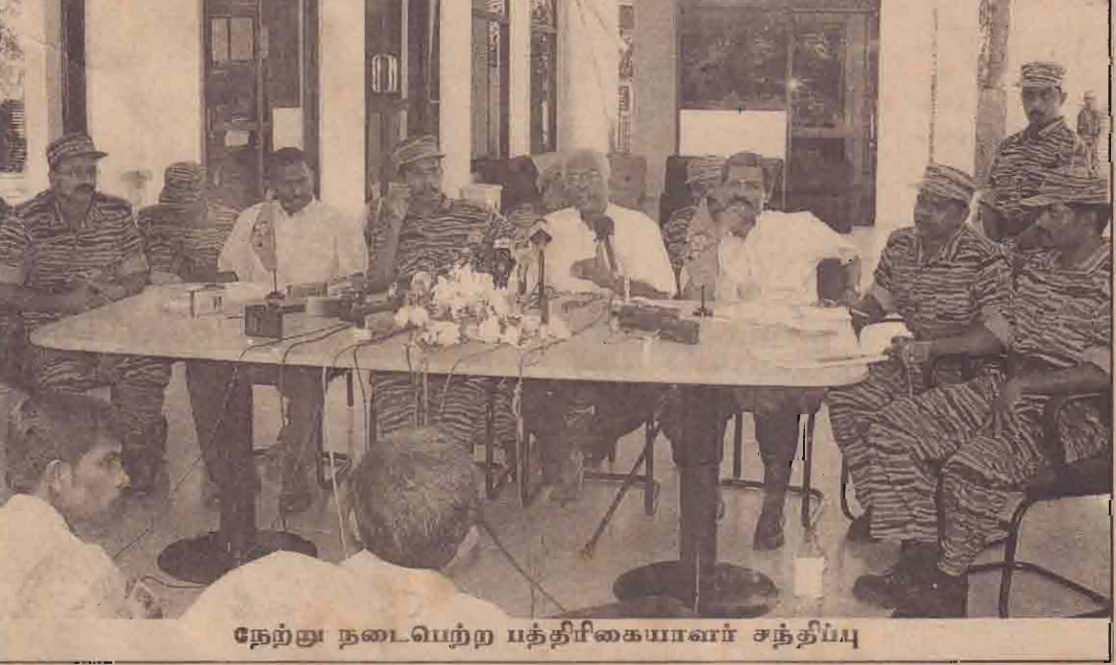
நேற்று நடைபெற்ற பத்திரிகையாளர் சந்திப்பு

செம்மணிப்பகுதியில் மனிதப் புதைகுழி ஒன்றைக் கண்டறிந்தது அதிலிருந்து மனித எச்சங்களை மீட்டெடுத்த "கலோரஸ்" மிதி வெடி அகற்றும் நிறுவனத்தைச் சேர்ந்த பணியாளர் ஒருவரை சிறி லங்கா பொலிசார் கைது செய்துள்ளனர். மேற்படி பகுதியில் கண்ணி வெடியகற்றும் நடவடிக்கையிலிருந்துகொண்டிருந்த மேற்படி குழுவினரால் மனிதப் புதைகுழி ஒன்றிலிருந்து எச்சங்கள் கடந்த வாரம் மீட்கப்பட்டது. இதனைத் தொடர்ந்து இது பற்றிய விசாரணைகளை மேற்கொள்வதற்கான நடவடிக்கைகள் மேற்கொள்ளப்பட்டுவருகின்ற சூழ்நிலையில் நேற்று இப்பணியாளர் திடீரெனக்கைது செய்யப்பட்டுள்ளார். (8ஆம் பக்கம் பார்க்க)