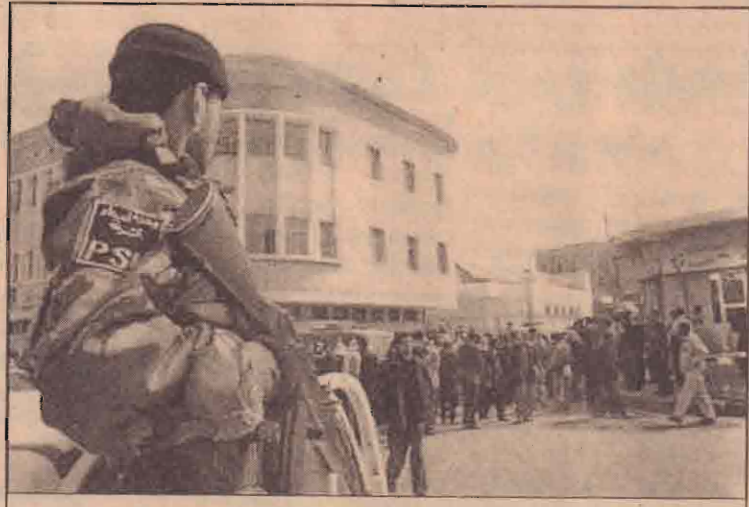
ஈராக்கின் பஸ்ராவில் பிரிட்டிஷ் படையினருடன் கண்காணிப்பில் ஈடுபடும் ஈராக்கிய பொலீசார் ஒருவர்

ஏற்படுத்துவதாக அமைந்துள்ளது. இதேவேளை ஈராக்கின் இடைக்கால நிர்வாகம் தொடர்பான இடைக்கால அரசியல் யாப்பு கைச்சாத்திடுவதற்கு முடியாமல் போனதை பெரிதுபடுத்துவதாக வெள்ளை மாளிகை ஈராக்கியர்களிடம் இறைமையைக் கையளிப்பது வரும் யூன் மாதம் முப்பதாம் திகதி இடம்பெறும் என்று தெரிவித்துள்ளது.