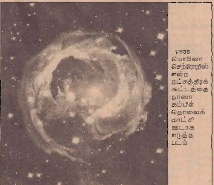
V838 மொனோ செற்றோவில் என்ற நட்சத்திரக் கூட்டத்தை நாலாகப்பீன் தொலைக்கார்ட் ஊடாக எடுத்த படம்

ஆனால் இந்த விடயத்தில் நீதிமன்றம் ஈடுபடமுடியாது எனக் கூறி அந்த மனுவைத் தள்ளுபடி செய்து விட்டது.