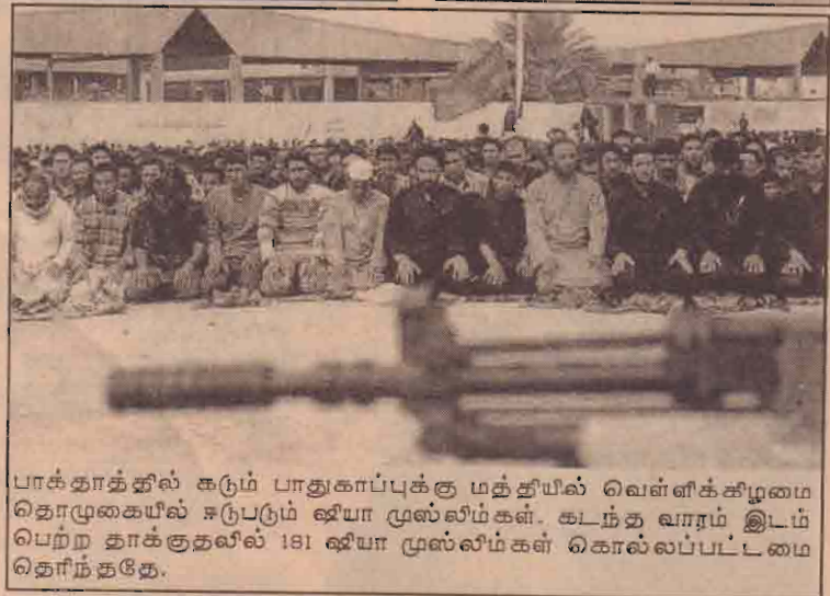
பாக்தாத்தில் கடும் பாதுகாப்புக்கு மத்தியில் வெள்ளக் கிழமை தொழிலாளர்கள் கூட்டம். ஈராக்கில் ஈயா மூஸ்லிம் கள். கடந்த வாரம் இடம் பெற்ற தாக்குதலில் 181 ஈயா மூஸ்லிம் கள் கொல்லப்பட்டமை தெரிந்ததே.

வடகொரிய அணுவாயுதப் பிரச்சினைக்குத் தீர்வுகாணும் ஆறு தரப்பினர் பங்கேற்கும் மூன்றாம் கட்டப் பேச்சுக்கள் எதிர்வரும் ஜூன் மாதம் நடைபெறவுள்ளது. 2ம் கட்டப் பேச்சுக்கள் இணக்கமின்றி முடிவடைந்தமை தெரிந்ததே.