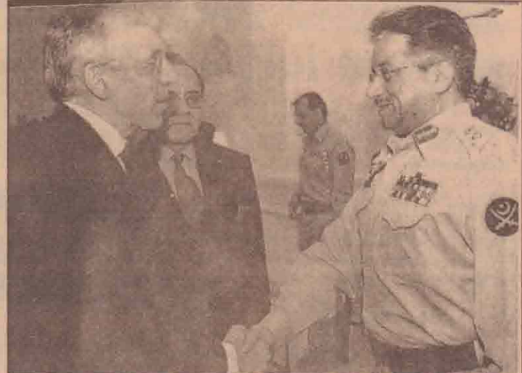
பிரிட்டிஷ் வெளியுறவு அமைச்சர் ஐக்ஸ்ரோவ்வும் பாகிஸ்தான் சனாதிபதி பர்வேஷ் முஷாரஃபும் கைலாகு கொடுக்கின்றனர். பாகிஸ்தானுக்கு மூன்று நாள் விஜயமாக வருகை தந்த அவர் ராவல் பிண்டியில் கடந்த வியாழன் சந்தித்து இருதரப்பு விவகாரங்கள் குறித்துப் பேசினார்.

(சென்னை) எதிர்வரும் 16 மாநிலங்களில் மக்களவைத் தேர்தல் மே 10ஆம் திகதி நடைபெறவுள்ளது. இதில் தமிழகமும் அடங்குகின்றது. தமிழகத்தில் 4 கோடியே 92 இலட்சத்து 68ஆயிரத்து 408 வாக்காளர்கள் உள்ளார்கள் என்று தேர்தல் ஆணையகம் அறிவித்துள்ளது. இதில் 2 கோடியே 50 இலட்சத்து 41ஆயிரத்து 108 பேர் பெண் வாக்காளர்கள் ஏனைய வாக்களர்கள் ஆக உள்ளார்கள் என்றும் தேர்தல் ஆணையகம் அறிவித்திருக்கின்றது.