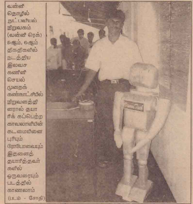
வன்னி தொழில் நுட்பவியல் நிறுவகம் (வன்னி ரெக்) ஆகும், ஆகும் தீகதிகளில் நடத்திய இலவச கணினி செயல் முறைக் கண்காட்சியில் நிறுவனத்தினரால் தயாரிக்கப்பெற்ற காவலாளியின் கூடமையினை பூரீயும் ரோபோவைப்பும் இதனைத் தயாரித்தவர்கள் கையில் ஒருவரையும் டட்டத்தில் காணலாம் (டபம் - சோதி)

இவ் உடற்பயிற்சி போட்டியில் ஆண்கள் பிரிவில் முத்து ஐயன் கட்டு அரசினர் தமிழ்க் கலவன் பாடசாலை 1ஆம் இடத்தினையும், முத்து ஐயன்கட்டு இடது கரை அரசினர் தமிழ்க் கலவன் பாடசாலை 2ஆம் இடத்தினையும், சுந்தரிலைமடு அரசினர் தமிழ்க் கலவன் பாடசாலை 3ஆம் இடத்தினையும், பெண்கள் பிரிவில் முத்து ஐயன் கட்டு இடது கரை அடக்கபாடசாலை 1ஆம் இடமும், சுந்தரிலைமடு அடக்கபாடசாலை 2ஆம் இடமும், முத்து ஐயன்கட்டு வலது கரை அடக்க பாடசாலை 3ஆம் இடத்தினையும் பெற்றுள்ளன. (05)