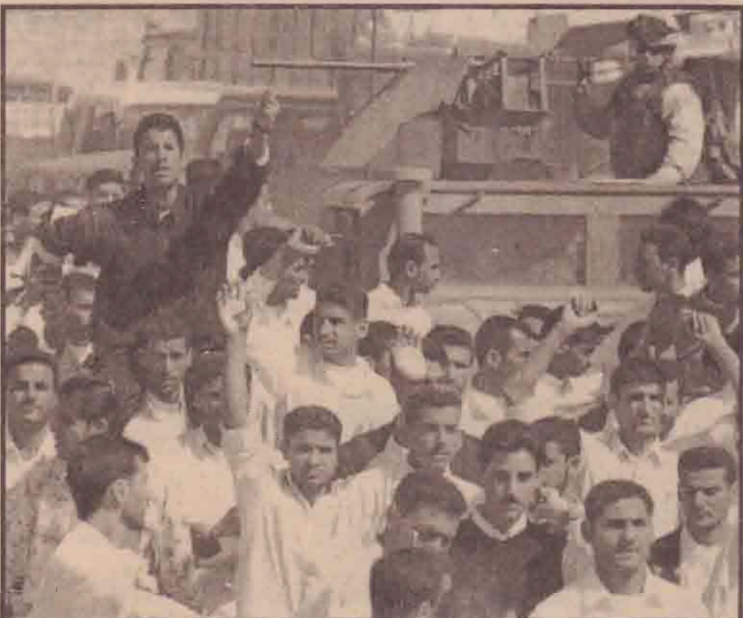
ஈராக்கில் புதிதாக கையெழுத்திடப்பட்ட இடைக்கால அரசியலமைப்புக்கு எதிராக ஈராக்கிலுள்ள கில்லா நகரத்தில் மாணவர்கள் நேற்று முன்தினம் ஆர்ப்பாட்டத்தில் ஈடுபட்டனர்.

கென்யாவின் வடக்கு-கிழக்குப் பகுதிகளில் உதைபந்தாட்டப் போட்டியில் ஏற்பட்ட மோதலின் போதும் அதனையடுத்து இடம் பெற்ற கலவரங்களிலும் பதினாந்துபேர் கொல்லப்பட்டுள்ளனர். உதைபந்தாட்டப் போட்டியில் ஏற்பட்ட மோதலை அடுத்து நடந்த இச்சம்பவத்தின் போது கொல்லப்பட்டவர்களில் மூன்றுபேர் சிறுவர்களாவர். இதேவேளை இக் கலவரங்களினால் ஏற்பட்ட சனநெரிச்சலில் சிக்கி கமர் நூற்பது பேர் படுகாயங்களுக்கு உள்ளாகியுள்ளதாகவும் தெரிவிக்கப்படுகிறது.