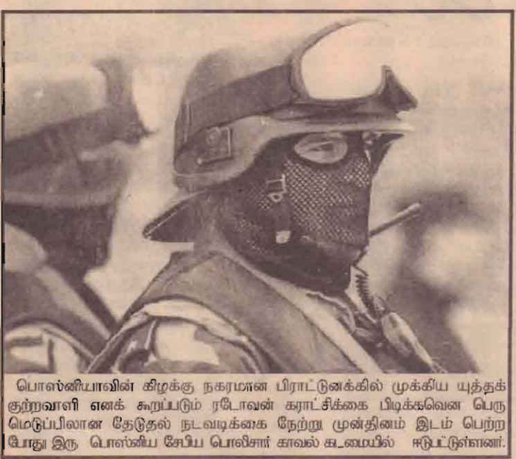
பொஸ்னியாவின் கிழக்கு நகரமான பிராட்டுன்க்கில் முக்கிய யுத்தக் குற்றவாளி எனக் கூறப்படும் ரடோவன் கராச்சிக்கை பிடிக்கவேன பெரு மெடுப்பிலான தேடுதல் நடவடிக்கை நேற்று முன்தினம் இடம் பெற்ற போது இரு பொஸ்னிய சேபி பொலிசார் காவல் கடமையில் ஈடுபட்டுள்ளனர்.

தொடர்பாக ஒரு குடும்பத்தினர் மத்தியில் ஏற்பட்ட சச்சரவே இந்த மரணங்களுக்குக் காரணம் எனப்பொலிசார் சந்தேகிக்கின்றனர். இறந்தவர்களில் அனேகமானவர்கள் சிறுவர்களாவர். இதேவேளை இந்தச் சம்பவம் தொடர்பாக மேற்படி இறந்த சிறுவர்களின் தந்தையென நம்பப்படும் 57 வயது நபர் ஒருவர்கைது செய்யப்பட்டுள்ளார்.