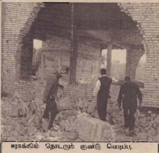
சராக் கில் தொடரும் குண்டு வெடிப்பு.

அத்துடன் சராக் மக்கள் விடுதலை பெறத்தகுப்பதை சிந்தித்துபார்க்குமாறு நெதர்லாந்திடம் கேட்டுக்கொண்டுள்ளார்.