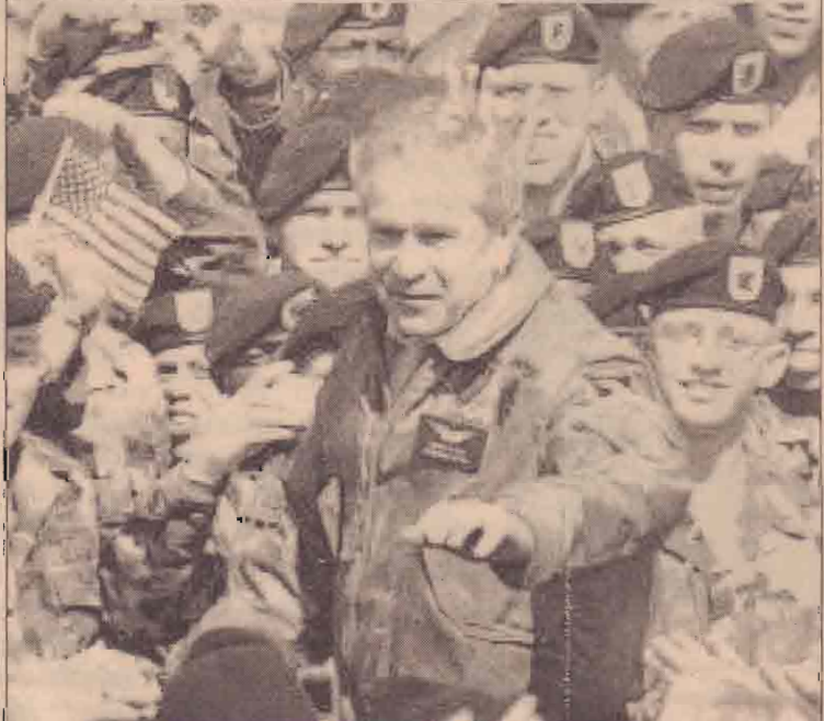
கடத்த விவாதம் அன்று 101 வது விமானப் படைபிளர் மத்தியில் உரையாட வருகை தந்திருந்த அமெரிக்க சனாதிபதி ஜோர்ஜ் புஷ்

பாகிஸ்தானில் பின்லேடன் பதுங்கி இருக்க வாய்ப்பில்லை இங்கு பதுங்கி இருந்தால் பாகிஸ்தான் இராணுவத்திடம் அவர் சிக்கியிருப்பார். கடந்த இரண்டு ஆண்டுகளாக பாகிஸ்தான் இராணுவம் தீவிர தேடுதல் வேட்டையை நடத்தி வருகின்றது. பாகிஸ்தானின் எல்லைப்பகுதி 2500 கி.மீ தூரத்திற்கு விரிந்து கிடப்பதால் தேடுதல் வேட்டை கடினமான பணியாக இருந்து வருகிறது. எல்லை ரோந்துப் பணியில் 70 ஆயிரம் வீரர்கள் ஈடுபட்டுள்ளனர். தற்போது எல்லை மூடப்பட்டுள்ளது என்றார்.