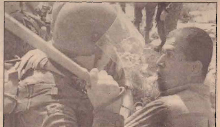
பலஸ்தீனத்தின் மேற்குக் கரை கிராமத்தைப் பிரித்து அமைக்கப்படும் இஸ்ரேலிய தடுப்புச்சுவர் தொடர்பாக ஆட்சேபம் தெரிவிக்கும் பலஸ்தீனரை மிரட்டும் இஸ்ரேல் படைவீரர்

அமெரிக்கா சிரியா மீது விதித்துள்ள புதிய தடைகளில் சிரியாவின் விமானங்கள் அமெரிக்கா வில் பிரவேசிப்பது தடை செய்யப்பட்டுள்ளது. அமெரிக்காவின் பயங்கரவாதப் பட்டியலில் அடங்கிய குழுக்களுக்கு சிரியா ஆதரவு வழங்குவதாக அமெரிக்கா சந்தேகிக்கின்றது.