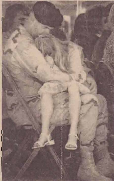
விடுமுறையில் நாடுதிரும்பிய அமெரிக்கப் படைவீரர்.

ளுக்கு மத்தியில் எண்ணெய் வளத்தை தனதுக்கிக் கொள்ளுது சராக் கை சராக் கியர்களிடம் ஒப்படைப்பது என்பது அவருடைய திட்டமாக இருக்கமாட்டாது.