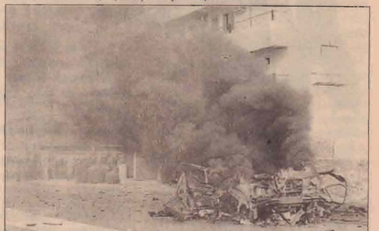
சுடானின் மீண்டும் ஒருகார் குண்டு வெடிப்புச் சம்பவம் நடைபெற்றிருப்பதைப் படத்தில் காண்க. இதற்கு முன்பும் நடைபெற்ற குண்டு வெடிப்பில் 7 பேர் பலியானதற்கு அல்ஹைதா அமைப்பு உரிமைகொரியுள்ளது.

கம்பூனியட் நாடான வடகொரியாவில் இதற்கு முன்னர் பணியாற்றிய ஐக்கிய நாடுகள் சோதனைக் குழுக்களையும் பார்க்க தற்போது அனுப்பப்பட இருக்கும் குழு மிகவும் கடுமையாக நடந்து கொள்ளும் என்று அல்பராடி கூறியுள்ளார்.