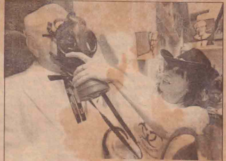
வில்லக்குகளை உணவுக்காக பயன்படுத்துவோருக்கெதிராக ஆர்ப்பாட்டம் நடத்துவோர்க்கு ஆதரவாக பாங்கொக்கில் உள்ள கேணல் சான்ட்ரீஸ் சீலைக்கு முகமூடிபணிவீக்கும் அமெரிக்கப்பாடகர் கிறிஸ்டி ஹென்டி.

இதேவேளை இதுவரை தொண்ணூறு அமெரிக்கக் குடும்பங்கள் கெயிட்டியில் இருந்து அமெரிக்காவிற்குத் திரும்பியுள்ளன. அமெரிக்கா மட்டுமன்றி பல்வேறு உலக நிறுவனங்களும் கெயிட்டியில் இருந்து மேலதிக உத்தியோகத்தர்களையும் குடும்பத்தினரையும் தத்தமது நாடுகளுக்குத் திருப்பி அழைத்து வருகின்றன.