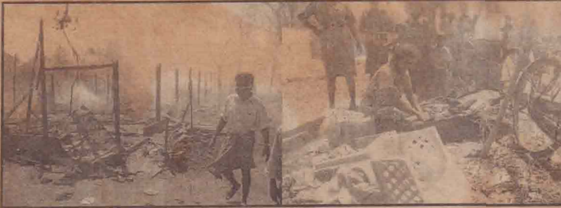
வவுனியா நலன்புரி நிலையத் தீவிபத்தில் எரிந்துள்ள குடியிருப்புகளையும், பாதிக்கப்பட்ட குடும்பங்களையும் மேலுள்ள படங்களில் காணலாம்.