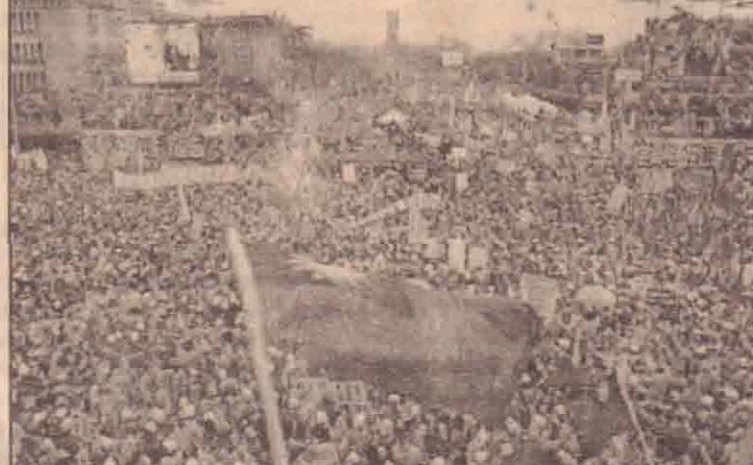
தாய்பே நகரிலுள்ள தாய்வானின் சனாதிபதி மாளிகைக்கு முன்னால் அணிதிரண்டிருந்து ஆர்ப்பாட்டத்தில் ஈடுபடும் அந்நாட்டு பிரதான எதிர்க்கட்சித் தலைவரின் ஆதரவாளர்கள்.

இவ்வாறு முன்னாள் பிரதமர் சந்திரசேகர் கூறியுள்ளார் நேற் றுமுன்தினம் செய்தியாளர்களிடம் பேசிய அவர், வெளிநாட்டில் பிறந்த ஒருவர் நாட்டின் பிரதமர் ஆவதைத் தடுப்பதற்கு அரசியல் சாசனத்தில் வழியில்லை என்றும் கட்டிக்காட்டியுள்ளார்.