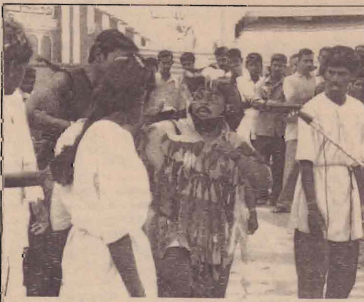
தேர்தல் விதப்புரை கருத்துக்களை மக்கள் மத்தியில் தெரிவிப்பதும் வகையில் நடத்தப்பட்டுவரும் "திருவிழா" விதிநாடகத்தின் காட்சியினைப் படத்தில் காணலாம்.

அத்துடன் 50 கிலோகிராம் கொண்ட உரத்துக்கு 500 ரூபா நிவாரணம் வழங்கவும், 1300 ரூபா பெறுமதியான உரப்பைக்கு 800 ரூபா வுக்கு பெற்றுக்கொள்ளவும் முடியும். நெல் வின் கொள்விலை 13.50 இல் இருந்து 15 ரூபாவாக அதிகரிக்கப்படவுள்ளது என்றும் அவர் கூறியுள்ளார்.