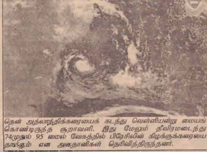
தென் அத்தலாந்திக்கரையைக் கடந்து வெள்ளியன்று மையங் கொண்டிருந்த குறாவளி. இது மேலும் தவிரமடைந்து 74முதல் 95 மைல் வேகத்தில் பிரேசிலின் கிழக்குக்கரையை தாக்கும் என அல்தானிகள் தெரிவித்திருந்தனர்.