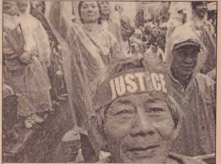
தாய்வானில் நடைபெற்ற சனாதிபதித் தேர்தலையும், சென்கய்யனின் வெற்றியையும் ஐ.நா. பாராட்டியுள்ளதையும் கண்டித்து தாய்வான் தலைநகரில் ஆர்ப்பாட்டம் நடத்தத் திரண்ட மக்கள்.

கொண்டு வரப்பட வுள் ளதாகக் கூறிய வழக்கறிஞர், இந்த மறுப்பானது அரேபிய சமூகத்தினிடையே சர்ச்சையை ஏற்படுத்தியுள்ளது. இது தொடர் பாக ஏரியல்ஷரோன் நாட்டுமக் களுக்கும், அரேபிய சமூகத் திற்கும் விளக்கமளிக்க வேண்டும் என்றும் அவர் கேட்டுள்ளார்.