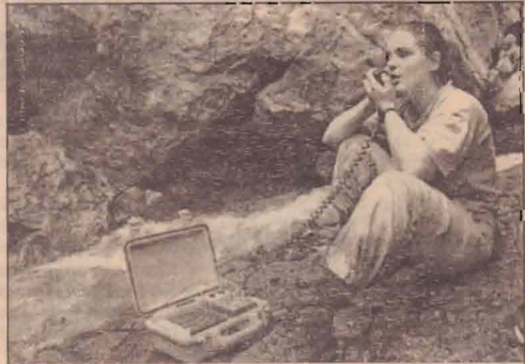
மெக்சிக்கோவில் குகையிற்குள் சிக்கியுள்ளவர்களுடன் தொடர்பு சாதன மூடாக உரையாடும் மீட்புப் பணியாளர் ஒருவர்.