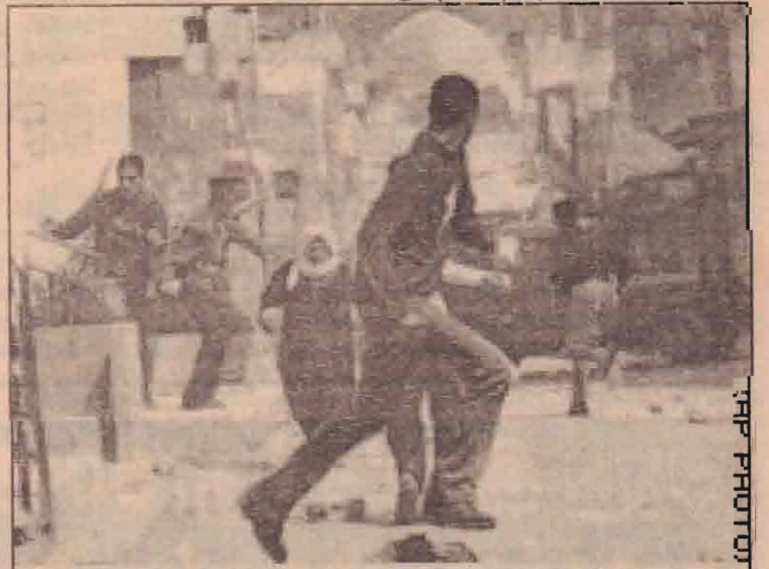
மேற்குக்கரை நேபாள நகர அகதிமுகாமில் சனியன்று நடந்த மோதலின் போது இஸ்ரேலியத் துருப்பினர் மீது கற்களால் தாக்கும் பலஸ்தீன இளைஞர்கள்.

ஸ்பெயினில் வீட்டு வன்முறை கள் நாளுக்குநாள் அதிகரித்து வருகின்றன. கடந்த வருடம் மட்டும் 60 பெண்கள் அவர்களது பெற்றோர்களால் கொல்லப்பட்டுள்ளார்கள். இதனை ஸ்பெயினின் பொலிஸ் திணைக்கள அறிக்கை கூறியுள் ளது. நேற்று முன்தினம் கூட ஒரு வயோதிபர் தனது மனைவியை கட்டுத்துப்பாக்கியால் கட்டுக் கொலை செய்துள்ளார். தனது மகனுக்கும் தனக்கும் குண்டை வெடிக்க வைத்துள்ளார். இதன் போது வயோதிபர் இறந்துள்ளார். மகன் படுகாயங்களுடன் வைத்தியசாலையில் அனுமதிக்கப்பட்டுள்ளார்.