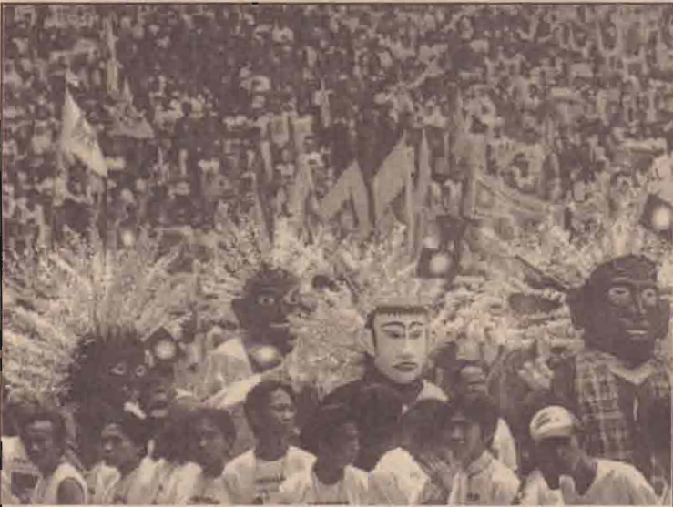
இந்தோனேசியாவின் பாராகாமன்மற்றத் தேர்தல்வரும் தீங்கட்கிழமை நடைபெறவுள்ளதையடுத்து தேசியக்கட்சி ஆதரவாளர் பேரணி.

பிலிப்பைன்ஸ் தலைநகர் மணிலாவில் தீவிரவாதிகளால் நடத்தப்பட்ட இருந்த பாரிய தாக்குதல் முறியடிக்கப்பட்டதாக பிலிப்பைன்ஸ் அரசு அறிவித்துள்ளது. ஸ்பெயினில் தாக்குதல் நடத்திய குழுவே இத்தாக்குதலையும் நடத்தத்திட்டமிட்டிருந்ததாகவும் பிலிப்பைன்ஸ் அரசு அறிவித்துள்ளது.