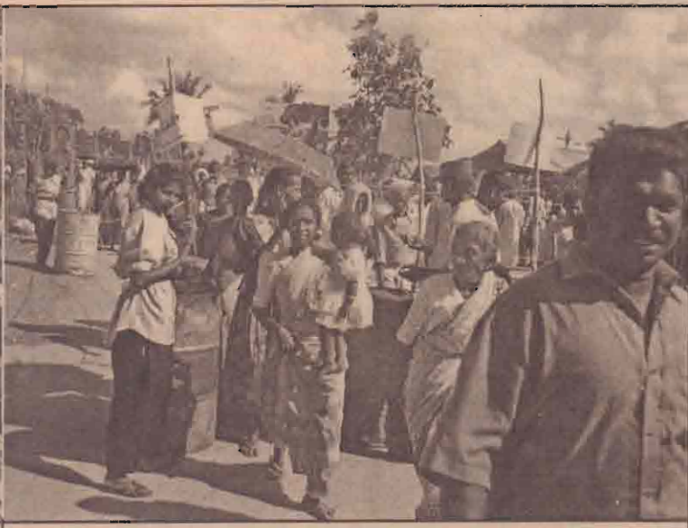
ஓமந்தை சோதனைச்சாவுடியூடாக வாக்களிக்கச்செல்லும் மக்கள்