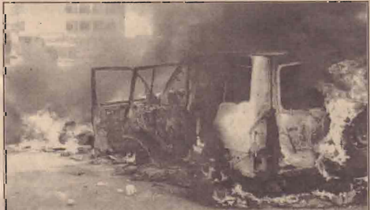
சுராக் பஜாஜாவில் கடந்த புதன் கிழமை தாக்குதலுக்கு உள்ளான இரு வாகனங்கள் எரிசின்முன்: இதில் எட்டு வெளிநாட்டவர் கொல்லப்பட்டனர்.

இந்தப் பேச்சுக்கள் அனைத்திலும் எட்டப்பட்ட முன்னேற்றம் தொடர்பாக ஆராய்வதற்காக ஆகஸ்ட் மாதத்தில் இரு நாடுகூடாது வெளிவிவகார அமைச்சர்கள் சந்திக்கவுள்ளார்கள்.