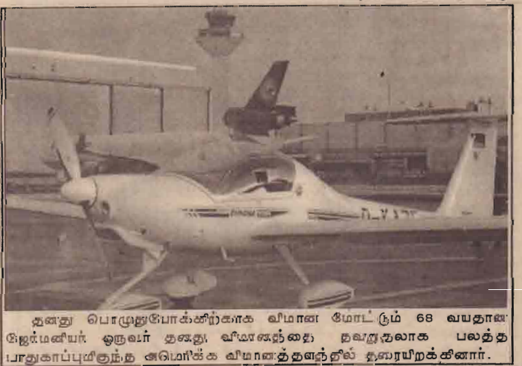
தனது பொழுதுபோக்கிற்காக விமான மோட்டும் 68 வயதான ஜெர்மனியர் ஒருவர் தனது விமானத்தை நவநூலாக பலத்த பாதுகாப்புக்குட்படுத்த அமெரிக்க விமானத்தளத்தில் தவறியறக்கினார்.

இந்தக் கண்காட்சியின் மூலம் அதிக எண்ணிக்கையான முதலீட்டாளர்களைக் கவர முடியும் என அமெரிக்கா நம்பிக்கை கொண்டிருந்தமை குறிப்பிடத்தக்கதாகும்.