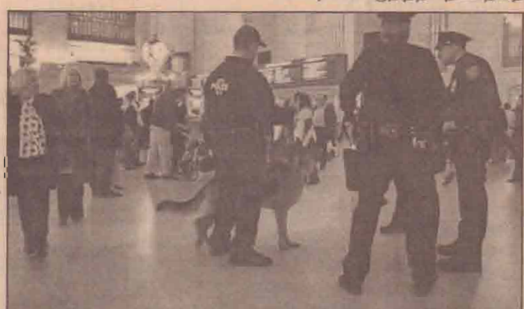
பயங்கரவாத தாக்குதல்கள் எதிர்கொள்ளப்படுவதால் அமெரிக்காவின் றீயூயோர்க் நகரில் சோதனைகளில் ஈடுபடும் பொலீசார்.

பிடிக்காமல் இருந்தால் புகைப் பிடிக்காமல் இருப்பவர்களின் ஆரோக்கியத்தைப் பெற்றுவிட முடியும் என்று ஆராய்ச்சிகள் தெரிவித்துள்ளன.