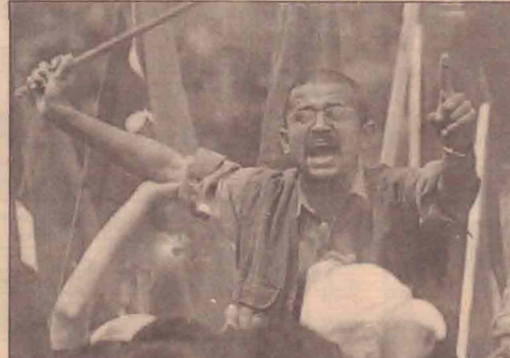
நேபாள தலைநகர் காட்மண்டூவில் லீயாமுக் கீழமை இடம்பெற்ற ஆர்ப்பாட்டமொன்றில் பங்கேற்றோர்.

இரண்டு நாடுகளுக்குமிடையேயான பேச்சு வார்த்தைகளின் முன்னேற்றங்கள் ஐ-லை மாதமளவில் எதிர்பார்க்கப்படுகின்றன. இந்நிலையில் காஷ்மீர் பிரச்சினைக்கு தீர்வுகிடைக்குமென எதிர்பார்ப்பதாக அவர் மேலும் கூறியுள்ளார்.