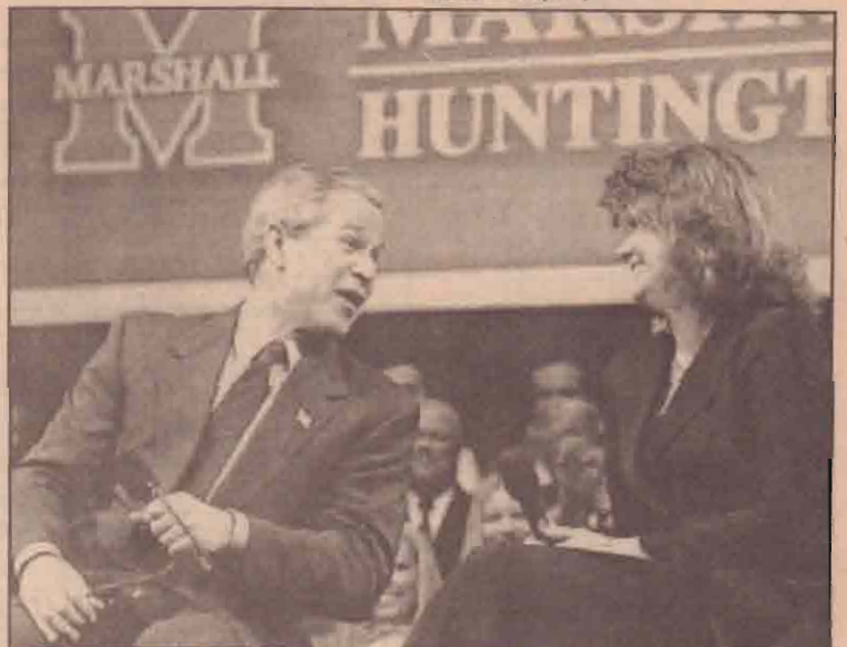
அமெரிக்க சனாதிபதி ஜோர்ச் டபிள்யூ புஷ் மேற்கு ஜோர்ஜினியா வீலுள்ள மார்ஷல் பல்கலைக்கழகத்திற்கு விஜயம் ஒன்றை நேற்று முன்தினம் மேற்கொண்டிருந்த வேளை தொழில் வளர்ச்சி பற்றி உரையாற்றுகின்றார்.

பலஸ்தீன பிரதமர் அகமட்கூரி ஷரோனின் கருத்துக்கள் பொறுப்பற்றவை, கண்டிக்கத்தக்கவை என்று கூறியுள்ளார்.