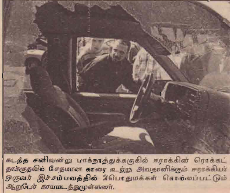
கடந்த சனியன்று பாக்காத்துக்கருகில் ஈராக்கின் ரொக்கத் தாக்குதலில் சேதயான காரை உட்பற்ற அவதானிக்கும் ஈராக்கியர் ஒருவர் இச்சம்பவத்தில் தீயொழிவுக்கள் கொல்லப்பட்டும் ஆறப்பேர் காயமடைந்துமுள்ளனர்.

அவர் மேலும் கூறுகையில், வரும் தேர்தலில் வெற்றிபெற்று மத்தியில் ஆட்சியமைக்கும் வாய்ப்பு காங்கிரஸ்கட்சிக்கு ஏற்படுமானால் அதன் தலைவர் யார் என்பதை தெளிவுபடுத்தவேண்டும். உயர்பதவிகளில் வெளிநாட்டவர்கள் இருப்பது குறித்த பிரச்சினையில் பாரதீய ஜனதாக்கட்சி எந்தவொரு தனிப்பட்டவருக்கும் எதிராகவும் எழுப்ப