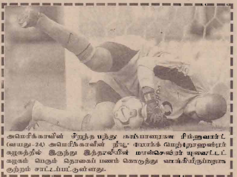
அமெரிக்காவின் சிறந்த பந்து காப்பாளரான ரிச்சுவார்ட் (வயது-24) அமெரிக்காவின் தீயு: ராயார்க் மெற்றோஹன்சர் கழகத்தில் இருந்து இத்தாலியின் மான்செஸ்டர் யுனைட்டட் கழகம் வரும் தொகைப் பணம் கொடுத்து வாங்கியிருப்பதாக குற்றம் சாட்டப்பட்டுள்ளது.

படுவதால் நாளை லாகூரில் நடைபெறவுள்ள 5வது இறுதியுமான போட்டி மிகவும் பரபரப்பாகவும் திகில் நிறைந்ததாகவும் அமையும் என்பதும் கடைசிப்