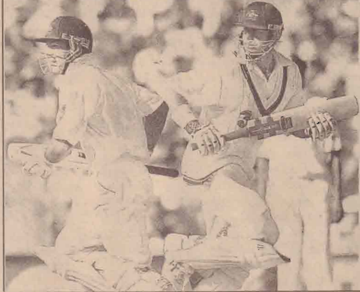
அணி இரண்டாவது இனிங்சுறகாக பெரும் நெருக்கடியிலும் நிதானமாக ஆடிய விதமும் பின்னா சவாலாக ஏற்ற அவுஸ். அணி போட்டியை தமக்கு சாதகமாக மாற்றி வெற்றிபெற்றமை மகத்தா

எது. இதன் மூலம் ஐந்து போட்டிகள் கொண்ட ஒருநாள் தொடரை 3-2 என்ற நிலையில் கைப்பற்றிய அவுஸ்திரேலிய அணி டெஸ்ட் தொடரையும் தம் வசம் எடுத்துக்கொண்டது. சிறிலங்கா அணியைப் பொறுத்தவரையில் மேற்படி போட்டித் தொடர்கள் சவால் நிறைந்ததாக அமைந்த போதும் சோதனைகளும் வேதனைகளும் அவ் அணியை பெரிதும் பாதித்திருக்கும். ஏனெனில் வெற்றியின் விளிம்புக்கு சென்றும் வெற்றிபெற முடியாத போனமை அவ் அணியைப் பெரிதும் பாதித்திருப்பதுடன் ரசிகர்களின் வெறுப்பையும் சம்பாதிக்க நேர்ந்தது. இது அவ் அணியை விமர்சனத்துக்கும் உள்ளாக்கியுள்ளது. இது ஒருநாள் போட்டித் தொடரை இழந்த சிறிலங்கா அணிக்கு டெஸ்ட் தொடரையாவது கைப்பற்றிவிட வேண்டும் என்ற கனவை கலைத்ததுடன் மூன்றாவதும் இறுதியுமான டெஸ்ட் போட்டியில் பரபரப்பையும் இல்லாது செய்துள்ளது. இந்நிலைக்கு கடந்த 12 மாதங்களாக தடைக்கு உட்பட்டிருந்த கழற்பந்து வீச்சாளர் லேஷ்வோர்னின் மீள் வருகை பெரும் பங்காற்றியது. அவர் இரண்டு டெஸ்ட் போட்டிகளிலும் 20 விக் கெட்டுக்களைக் கைப்பற்றி சிறிலங்கா துடுப்பாட்ட வீரர்களின் நிலைகுலையச் செய்தார். ஒட்டுமொத்தத்தில் இச்சுற்றுப் போட்டி சர்வதேச அளவில் வெற்றிநாயகர்களாக வலம் வரும் அவுஸ்திரேலியர்களின் வெற்றிப்பயணத்தில் அனுகூலமாக அமைந்துள்ளதுடன் கிரிக்கெட் உலகின் ஜாம்பவாஷ்கர்கள் அவுஸ்திரேலியர்கள் என்பதையும் நிரூபித்துள்ளது.