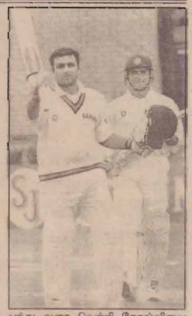
பந்து வரை வெற்றி தோல்வியை நிர்ணயிக்கமுடியாத ஒன்றாகவும் அமையும் என்பதுடன் இறுதிப் போட்டி அமைதியாக நடைபெற வேண்டும் என்பதும் ரசிகர்களின் அவாவாகும்.

மான துடுப்பாட்டம் பாகிஸ்தான் அணிக்கு சிறந்த அடித்தளமாக அமைவதுடன் எதிர்காலத்தில் சிறப்பாக அமையும். அதே போன்று இந்தியாவின் பந்துவீச்சாளர்களான பதான், பாலாஜி ஆகியோரும் பந்து வீச்சுலுடன் துடுப்பாட்டத்திலும் சளைத்தவர் களல்ல என்பது புலனாகிறது. 3வது போட்டியில் 12 பந்துகளில் 1சிக்சரும் 3பவுண்டரிகள் அடங்கலாக 21 ஓட்டங்களைப் பெற்றது குறிப்பிடத்தக்கது. எனவே இரு அணி ளும் இத் தொடரில் ச பலத்துடன் காண்ப