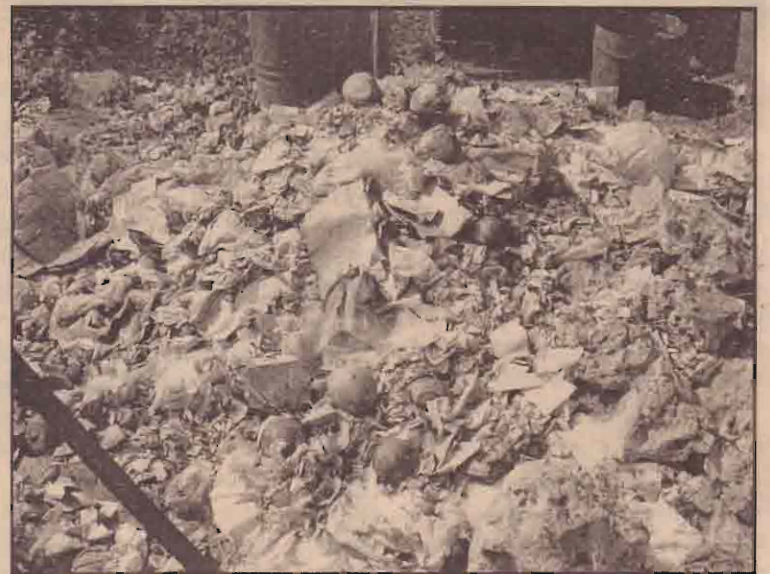
கடந்த சில நாட்களாக கிளிநொடி வலத்தியசாலை வளாகம் முன்பாக அகற்றப்பட்டது தூர்நாற்றமெடுத்த நிலையில் உள்ள கும்பை மேட்டினைப் பட்டத்தில் காணலாம் (படம்.சோதி)

இவ்வாறாக மக்கள் செய்யும் மாற்றமே இடைக்கால நிர்வாக சபையின் திட்டவரைவு அடிப்படையில் சமாதானப்பேச்சுக்கள் முன்னெடுக்கப்படவும் தமிழ்த் தேசிய இனத்துக்குள்ளே சுயநிர்ணய அடிப்படையில் தமிழ் மக்களின் உரிமைகளை நிலைநாட்டவும் இதற்குரிய சர்வதேச ஆதரவை வென்றிடவும் உதவும் என்றார். இம்மாற்றத்தை புலிகள் விரும்புவது போல் சனநாயக வழியில் உருவாக்க மக்கள் தமக்குள்ள வாக்குரிமைகளை சரிவரப் பயன்படுத்தவேண்டும் என்றார். (33)