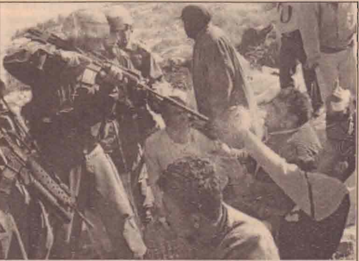
றமலலாவுக்கருகில் கிராமம் ஒன்றில் இஸ்ரேலியர் உருவாக்கிய தடுப்புச் சுவரை நீக்கக் கோரி ஆர்ப்பாட்டம் நடத்தும் பலஸ்தீனர் மீது துப்பாக்கியை நீட்டி அச்சுறுத்தும் இஸ்ரேல் படையினர்

ஆப்கான் எல்லைப்பகுதியில் செயற்படுவதாக கூறப்படுகின்ற அல்-ஹைதா பிரதிநிதிகளுடனான யுத்தத்தை தற்காலிகமாக நாம் நிறுத்திக்கொள்கிறோமென இராணுவத்தினர் தெரிவித்துள்ளனர். இதேவேளை இரு தரப்பினருக்கு யுடையான பேச்சுவார்த்தைகளை ஆரம்பிக்க இவ் யுத்த நிறுத்தம் சாதகமாக அமையுமென கருத்து வெளியிடப்பட்டுள்ளது. அத்துடன் மலைப் பிராந்திய எல்லைப்பகுதியில் இதுவரை நூற்றுக்கும் அதிகமான அல்-ஹைதா சந்தேக நபர்கள் சரணடைந்துள்ளதாக பாகிஸ்தான் தரப்பில் கூறப்பட்டுள்ளது. பாகிஸ்தானின் இந்த யுத்த நிறுத்த ஏற்பாடு அல்-ஹைதா உறுப்பினர்களை சரணடைய கோரும் நடவடிக்கையென பாகிஸ்தான் அறிவித்துள்ளது. போதிலும் அதன் எதிர்பாக்கைக்கு மாறாக இந்தத் தாக்குதல் நடைபெற்றுள்ளது குறிப்பிடத்தக்கது.