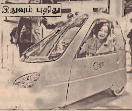
இதவும் புதிது பார்தால் காட் தீரையும் ஆனால் இது மூன்று சக்கர வாகனம். எல்லா சிதோஷ்டை நலைய்யும் மின்சாரத்தில் ஓடும் நவீன வாகனம் இது. ஜப்பானின் பிரபல 'ஹிரோவா' நிறுவனம் இதை வடிவமைத்துள்ளது. இந்த மூன்று சக்கர வாகனம், ஜப்பானில் நடக்கும் சர்வதேச சைக்கிள் கண்காட்சி நிகழ்ச்சிக்காக அறிமுகப்படுத்தப்பட்டது. மொத்த எடை 50 கிலோகிராம்.