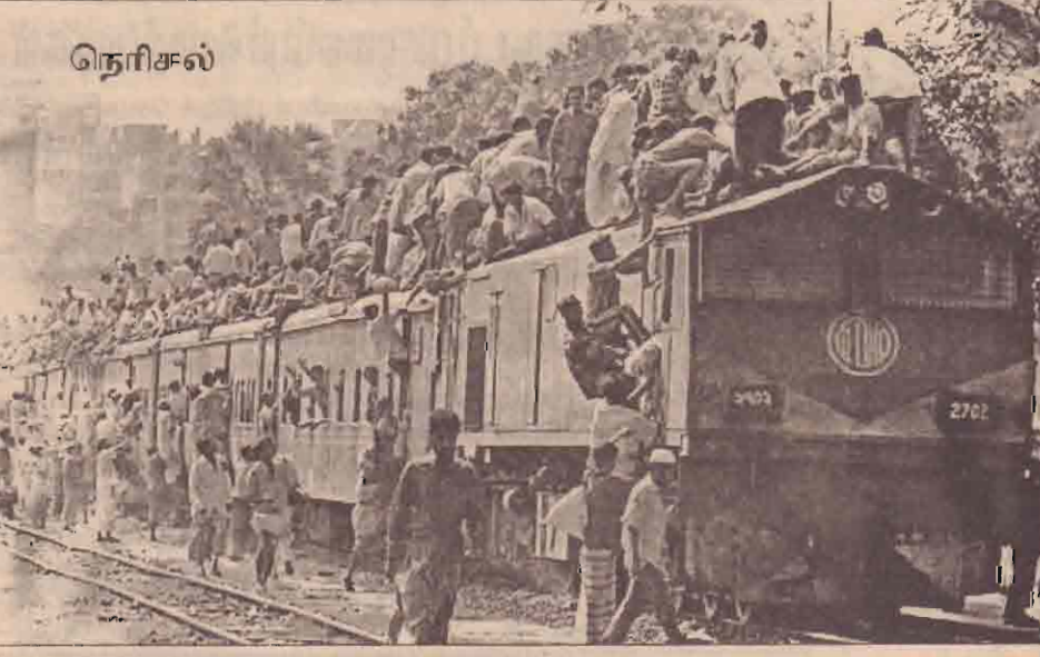
நெரிசல் இஸ்லாமியர்களின் புனித ரம்முான் பண்டிகையை முன்னிட்டு பங்களாதேஷ் முஸ்லிம்கள் தங்கள் சொந்த ஊர்களுக்குக் கிளம்பிச் செல்கின்றனர். தலைநகர் டாக்காவில் இருந்து செல்லும் புகையிரதங்களில் இடம் கிடைக்காமல், ஜன்னலிலும், கூரைகளிலும் தெற்றிக் கொண்டு செல்கின்றனர்.