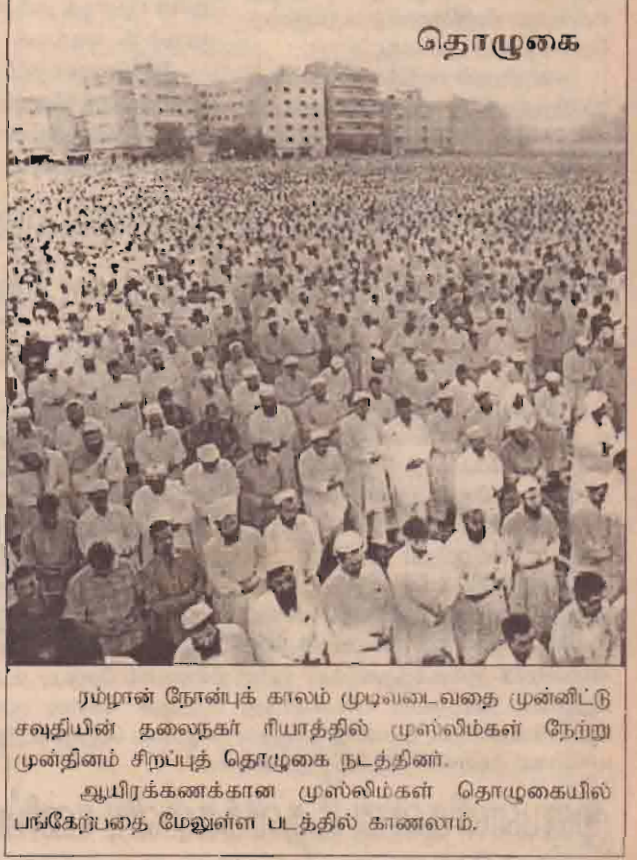
தொழுகை ரம்முான் நோன்புக் காலம் முடிவடைவதை முன்னிட்டு சவுதியின் தலைநகர் ரியாதத்தில் முஸ்லிம்கள் நேற்று முன்தினம் சிறப்புத் தொழுகை நடத்தினர். ஆயிரக்கணக்கான முஸ்லிம்கள் தொழுகையில் பங்கேற்பதை மேலுள்ள படத்தில் காணலாம்.

திலும் தீர்மானம் ஏகமனதாக நிறைவேற்றப்பட்டுள்ளது. எங்கள் உரிமையை விட்டுக்கொடுக்கமாட்டோம். இந்தத் தீர்மானம் சட்ட விரோதமானது என்று சிலி கூறுகிறது. இந்தத் தகராறு காரணமாக இரு நாடுகளுக்கும் இடையே போர்மூலும் அபாயம் அதிகரித்து வருகிறது. ஏற்கனவே 19ஆம் நூற்றாண்டில் இருந்தே இருநாடு களுக்கும் இடையே எல்லைத் தகராறு இருந்து வருகிறது. 1879 முதல் 1883ஆம் ஆண்டு வரை நடந்த போரில் பெருநாட்டின் சில பகுதிகளை சிலிநாடு பிடித்துக் கொண்டது குறிப்பிடத் தக்கது.