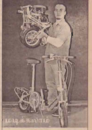
மடிக்கலாம் இந்தச் துவிச்சக்கரவண்டி ஜப்பானில் தயாரிக்கப்பட்டுள்ளது. இதனை மடித்த வைத்துக்கொள்ள முடியும். அடுத்த ஆண்டு இது விற்பனைக்கு வருகின்றது.

அமெரிக்கக் கண்டத்திலுள்ள நாடு களின் சனாதிபதிகள் மாநாடு ஆர்ஜென்டீனா வில் நேற்று ஆரம்பமாகியது. இதற்குமுன்னையாக அமெரிக்கக்கண் டத்திலுள்ள நாடுகளின் வெளிவிவகார அமைச்சர்கள் நேற்று முன்தினம் ஆர்ஜென் டீனா வில் உள் விவகாரக் குழுவினரைச் சந்தித்துப் பேச்சுவார்த்தை நடத்தியுள்ளனர். இந்த நாடுகளின் வெளிவிவகார அமைச்சர்களுக்கு ஆர்ஜென்டீனாவில் இரா ஜுவ மரியாதையுடன் கூடிய வரவேற்பு அளிக்கப்பட்டுள்ளது. இந்த மாநாட்டில் 34 அமெரிக்கக் கண்ட நாடுகள் பங்குபற்றுகின்றன குறிப்பிடத்தக் கது. இந்த மாநாட்டில் பல முக்கிய விடயங் கள் குறித்து ஆராயப்படவுள்ளதாகத் தெரி விக்கப்படுகின்றது.