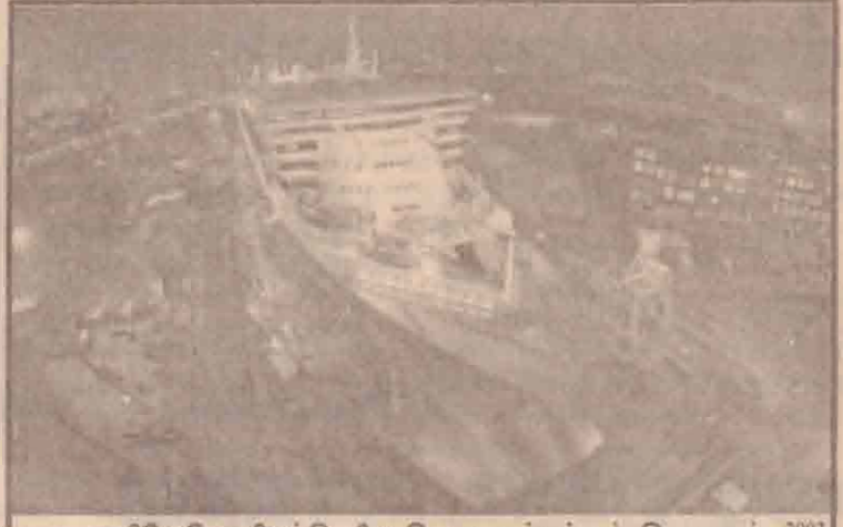
உலகிலேயே மிகப்பெரிய சொகுசுக்கப்பல் இதுதான். 2003 ஆம் ஆண்டு கட்டப்பட்ட 'ராணிமேரி-2' என்று இந்த இலங்கைத்து சொகுசுக் கப்பல் உலக சுற்றுப் பயணத்துக்கு இடையே ஜேம்ஸன் மீன் ஹாய்ப்க் நகரில் உள்ள துறைமுகத்தில் இப்போது பராமரிப்புக்காக நிறுத்திவைக்கப்பட்டுள்ளது. இந்தப்பராமரிப்புப் பணியின் போது கப்பலுக்கு வர்ணம் பூச 50 தொன் வர்ணம் தேவைப்பட்டது.

அவுஸ்திரேலியாவின் பண்டா கடல் பகுதியில் நேற்றுக்காலை திடீரென்று நிலநடுக்கம் ஏற்பட்டது. டார்வின் நகரில் இருந்து 500 கிலோ மீட்டர் வடமேற்கில் இந்த நிலநடுக்கம் உருவானது. ரிச்டர் அளவில் இது 5.3 புள்ளிகள் பதிவானது. ஆசியாக் கண்டத்திலும் அவுஸ்திரேலியக் கண்டத்திலும் உள்ள புவியியல் நகர்ந்து ஒன்றுக்கொன்று மோதியதால் இந்த நிலநடுக்கம் ஏற்பட்டதாக புகழ்பவியல் நிபுணர்கள் தெரிவித்துள்ளனர். இந்த நடுக்கத்தால் கனாமப்பேரலைகள் எதுவும் ஏற்படவில்லை. ஆனாலும் கடலோரப்பகுதிகளில் உலர் நடவடிக்கைகள் எடுக்கப்பட்டன.