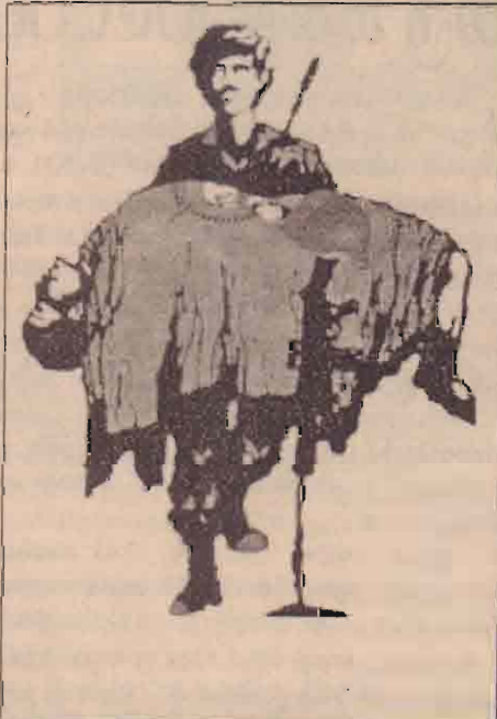
தமிழீழ மாவீரர் பணிமனை

1989 ஆம் ஆண்டில் நவம்பர் 27 ஆம் நாளை மாவீரர் நாளாகவும் 1990 ஆம் ஆண்டில் இருந்து 1994 ஆம் ஆண்டு வரை நவம்பர் 21ஆம் நாளிலிருந்து 27 ஆம்நாள்வரை மாவீரர் ஏழலாகவும் (வாரமாகவும்) தமிழீழ மக்கள் எழுச்சி நிகழ்வாக நடைபெற்று வந்த தமிழீழ மாவீரர் எழுச்சி நாள் நிகழ்வுகள் 1995 ஆம் ஆண்டிலிருந்து நவம்பர் 25 ஆம் நாள் முதல் 27 ஆம் நாள் வரை மூன்று நாட்களில் எழுச்சி நாட்களாகக் கடைப்பிடிக்கப்படுகிறது.