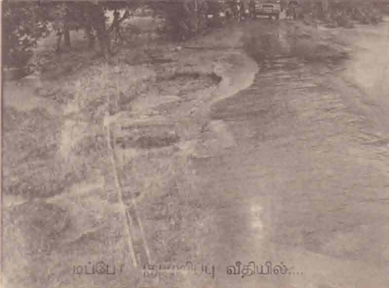
டிப்போ இயந்திரம் வீதியில்...

கரடிப்போக்கினூடான மூன்றாம் வாய்க்கால் பிரதான வீதியில் வெள்ள நீர் குறுக்கறுத்துப்பாய்வதனால் அதனூடாக போக்குவரத்துக்கள் யாவும் தடைப்பட்டுள்ளன. மற்றும் உருத்திர புரம் ஏராம் வாய்க்கால் பிரதான வீதியினை குறுக்கறுத்துப் பாய்ந்த வெள்ளத்தில் அகப்பட்ட உந்துருளியொன்று நேற்றுக்காலை வெள்ளத்தால் அடித்துச் செல்லப்பட்டுள்ளதாகவும், வெள்ளம் தொடர்ந்தும் பாய்வதன் காரணமாக நேற்று நண்பகல் வரை உந்துருளி மீட்டப்படவில்லைமென்பது குறிப்பிடத்தக்கது. (சோதி)