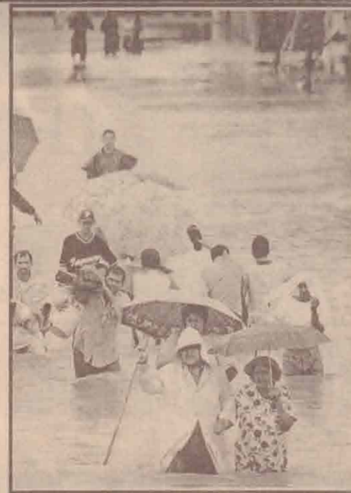
ஹாண்ட்ரோஸ் கடற்கரையில் "காமா" சூறாவளி மையம் கொண்டுள்ளது. இதனால் அந்த நாட்டின் சான் பெட்ரோ சூலா நகரில் கனமழை பெய்து வருகிறது. வெள்ளத்தில் சிரமப்பட்டு நடந்து செல்லும் மக்கள்.

மேற்குப் பகுதியிலுள்ள கமோலா என்ற இடத்தில் மோசமான வானிலை காரணமாக குட்டி விமானம் விழுந்து நொருங்கியது. இதில் விமானி உட்பட அதில் பயணம் செய்த மூன்று பேர் பலியானார்கள்.