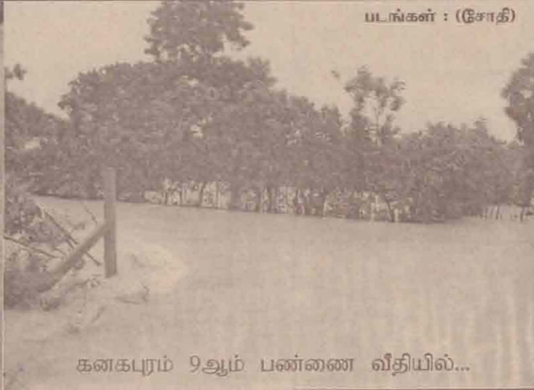
கனகபுரம் 9ஆம் பண்ணை வீதியில்...