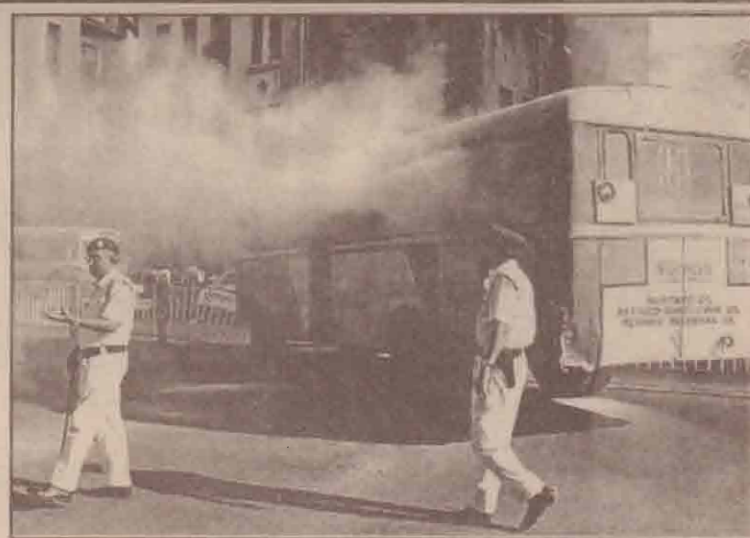
காங்கிரஸ் எம்.பி.அதிர்சுவத்ரி கைது செய்யப்பட்டதற்கு எதிர்ப்பு தெரிவித்து கொல்கத்தாவில் கட்சியின் தொண்டர்கள் நேற்று முன்தினம் ஆர்ப்பாட்டம் செய்தனர். இதில் அரச பஸ்ஒன்று ஆர்ப்பாட்டக்காரர்களால் கொழுத்தப்பட்டது.

இந்தியாவில் உள்ள அரசியல் கட்சி தலைவர்களுக்கு ரஷ்ய உளவு நிறுவனம் பணம் வழங்கியது பற்றி வெள்ளை அறிக்கை தாக்கல் செய்யும்படியும் அவர்கள் வழறுத்த உள்ளனர். மற்றொரு முக்கிய பிரச்சினை ஈரான் அணுஆயுத பிரச்சினை விவகாரமும் குடு பிறக்கும் என தெரிவிக்கப்படுகிறது.