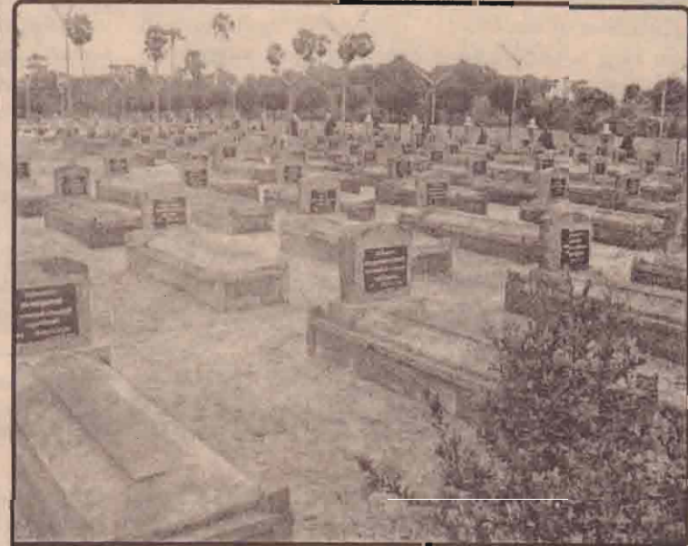
தமிழீழ மாவீரர் நினைவுத் தூய்மையில்லங்கள் புனரமைக்கப்பட்டு துயால் நிலைமையில் வைக்கப்பட்டுள்ள யாழ். போன்றும் துயில்லத்தில் புனரமைக்கப்பட்டுள்ளதை படத்தில் காணலாம். (41.)

யட்டாரிகளாக இருந்தும் வாக்களிப்பது சம்பந்தமாக சுயமாக நடந்து கொள்ள முடியாமல் வாக்களித்ததையிட்டு இவ்வைய தலைமுறையினரும், முதியோர்களும் எள்ளி நகையாடுகின்றார்கள். (41)