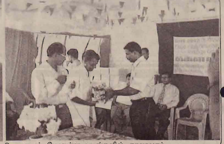
வதிவிட வேளாண்மையில், வெற்றியீட்டியோரையும், பரிசில்கள் வழங்கப்படுவதையும் மேலுள்ள படங்களில் காணலாம்.