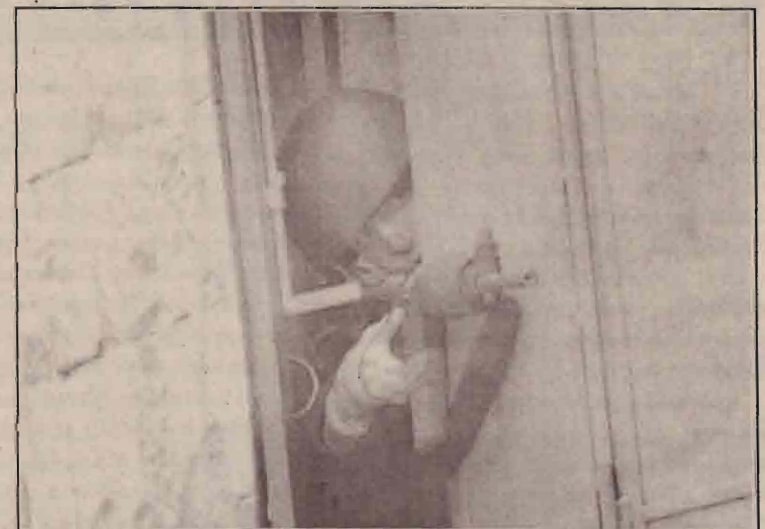
மேற்குக்கரை நேப்லஸ் நகரில் இஸ்ரேலிய இராணுவம் வீடுவீடாகத் தேடுதல் நடத்தும் வேளையில் பலஸ்தீனரின் கடையொன்றில் நிலையெடுத்து நிற்கும் இராணுவ வீரன்.

நடவடிக்கைகள் பிரான்சின் ஆதரவுடன் முன்னெடுக்கப்பட்டு வரும் வேளையில் அதனை எதிர்த்து வரும் பிற்தொரு கிளர்ச்சி குழுவினரே தொடர்ந்து மோதல்களில் ஈடுபட்டு வருகின்றனர் என்பது குறிப்பிடத்தக்கது.