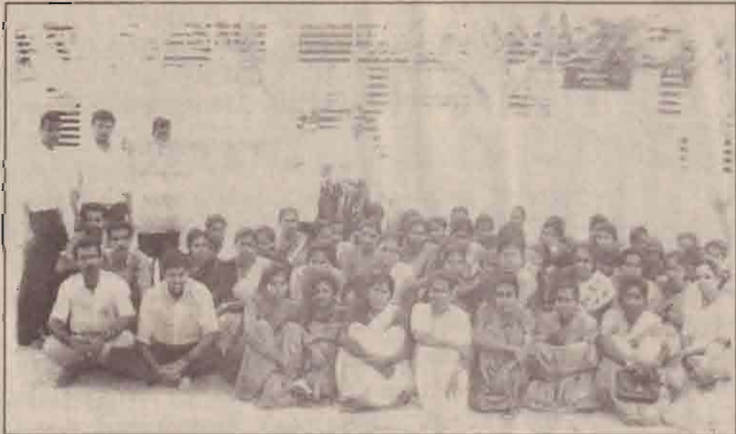
நிரந்தர நியமனம் வழங்கக் கோரி முல்லை வலய தொண்டராசிரியர்கள் கடந்த புதனன்று வலயக் கல்வி பணி மனை முன்பாக ஒரு நாள் அடையாள வேலை நிறுத்தத்தில் ஈடுபட்டிருப்பதைப் படத்தில் காண்க.

உண்டு. இதே போல் தூசால், வேறு நுகர்வுப் பொருட்கள் பாவனைப் பொருட்களும் பழுதடையக் கூடிய சந்தர்ப்பமும் காணப்படுகிறது. இத் தூசிப்படலம் எழுவதைத் தடுக்கும் வகையில் வீதியை தார் போட்டுச் செப்பி நுமாறு மக்கள் வேண்டுகோள் விடுத்துள்ளனர். (19)