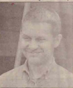
(08 ஆம் பக்கம் பார்க்க)

னைத் தராது என்பதை அனுபவ ரீதியாக அறிந்துள்ளோம். பேச்சுக்கள் மூலமாகவே இலங்கை இனப்பிரச்சனைக்குத் தீர்வுகாண வேண்டும் என இரு தரப்பினரும் விரும்புகின்றனர். சிறிலங்கா அரசு உலக நாடுகள் பலவற்றிற்குச் சென்று சமாதான முயற்சிகளுக்கு ஆதரவைத் திரட்டி