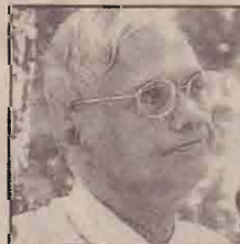
தெரிவித்துள்ளார். இதன்அடிப்படையிலேயே விடுத

(வவுனியா) இந்த நாட்டின் இனப்பிரச்சினைக்கு இராணுவத்தீர்வு உகந்தது அல்ல எனவும் அரசியல் தீர்வே இறுதியானதும், சாத்தியமானதாகும் என்று அமைச்சர் ஜீ.எல்.பீரீஸ் தெரிவித்துள்ளார். இதன்அடிப்படையிலேயே விடுதலைப்பலிகளுக்கும், அரசாங்கத்திற்கும் இடையில் சமாதானப் பேச்சுவார்த்தைகள் நடைபெற்று வருகின்றன. இதையிட்டு ஆயுதப்படையினர் எந்தவித சந்தேகமும் கொள்ளத் தேவையில்லை என்று தெரிவித்த அமைச்சர் இனப்பிரச்சினைக்கு ஓர் நல்ல தீர்வு ஏற்படவேண்டும் என்று அரசாங்கம் விரும்புவதாகவும் இதற்கு படைத்தரப்பினர் பூரண ஒத்து (08 ஆம் பக்கம் பார்க்க)