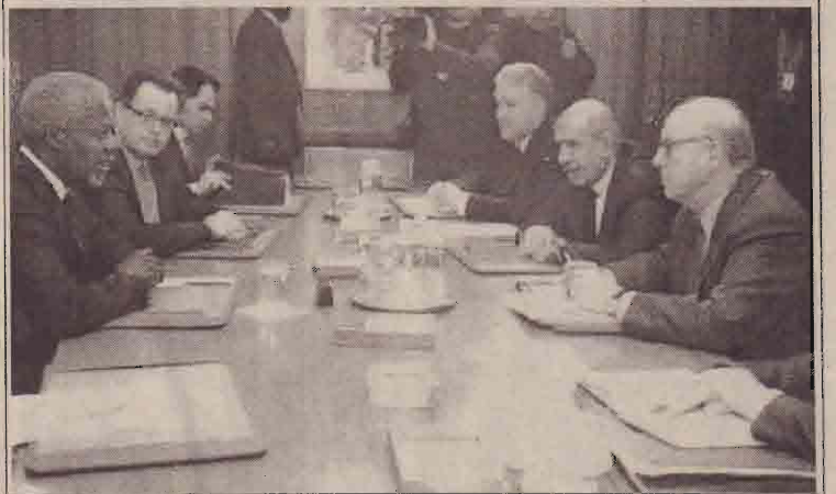
கடந்த 7ஆம் திகதி பாதுகாப்புச் சபையில் பரிசோதகர் குழுவினரால் ஈராக் தொடர்பான அறிக்கை சமர்ப்பிக்கப்பட்ட வேளையில்.....

பிராந்தியத்தில் கப்பல் சேவைகளைத் தடுக்கும் நோக்கில் வடகொரியா இத்தகைய முயற்சிகளில் ஈடுபடுவதாக அவர் குற்றம் சாட்டியுள்ளார்.