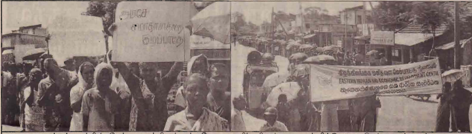
மட்டக்களப்பில் நேற்று முன்தினம் சர்வதேச மகளிர் தினத்தை முன்னிட்டு நடைபெற்ற ஊர்வலம்