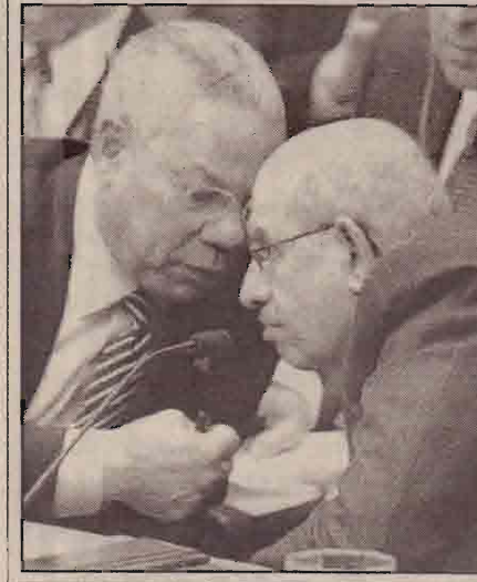
அமெரிக்க இராணுவக் கமாண்டர் ஜெனரல் டிபிள்யூ டிபிள்யூ புஷ், சர்வதேச அணு சக்தி ஏஜென் சியின் தலைவர் முகமட் எல் பராய்டியும் கலந்துரையாடுவதைக் காண்க.

இந்நிலையில், ஈராக் தொடர்பாக இரண்டாவது தீர்மானத்திற்கு எதிராக ரஷ்யா, சீனா, ஜேர்மனி, பிரான்ஸ் ஆகிய நாடுகள் தொடர்ந்தும் குரல் எழுப்பி வருகின்றன. அத்துடன், ஈராக்கின் ஆயுதச் சேதனைகளை மேற்கொள்ள மேலும் போதிய கால அவகாசம் வழங்கப்பட வேண்டும் என அந்நாடுகள் வலியுறுத்துகின்றன.