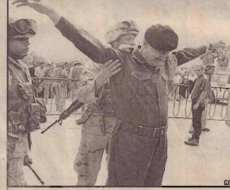
சராக்கிய படைவீரர் ஒருவரை சோதனையிடும் அமெரிக்க படையினர்

இந்தப் பிரச்சினைக்கு ஜப்பான், தென்கொரியா உட்பட ஐந்து நாடுகள் கொண்ட குழு மூலம் சமரசம் காண முடியும்