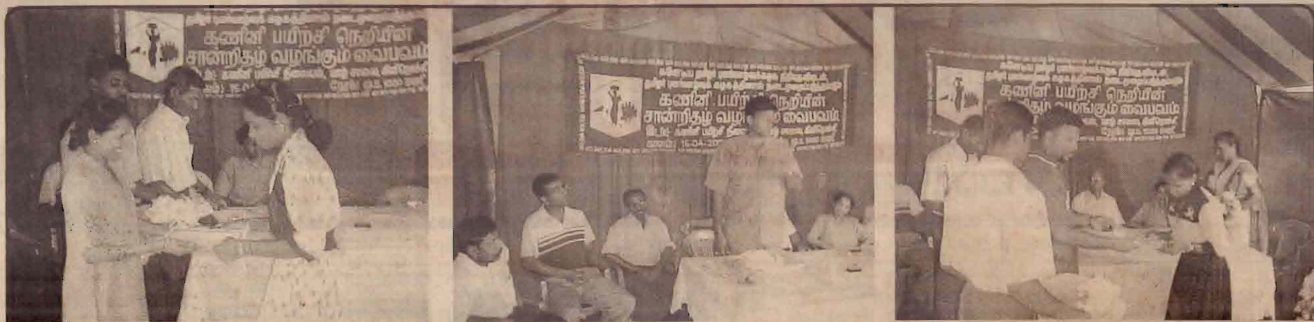
தமிழர் புனர்வாழ்வுக் கழகத்தினால் நடைமுறைப்படுத்தப்பட்டிருக்கும் கணினிப்பயிற்சி நெறியில் பயின்ற மாணவர்களுக்குத் தமிழர் புனர்வாழ்வுக் கழகத்தின் வெளிநாட்டுப் பிரதிநிதிகள் சான்றிதழ்களை வழங்கும் வையவம். (மடம் - லோகீசன்)