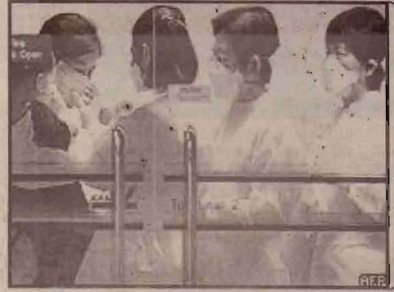
பாங்கொக் விமான நிலையத்தில் 'சார்ஸ்' பாதுகாப்பு நடவடிக்கைகளுடன் பயணிகள்

இவரது கைதை அடுத்து மத்திய கிழக்கு பகுதியில் பட்டம் அதிகரித்துள்ளது.