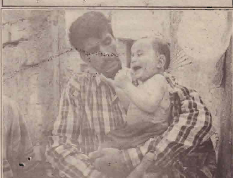
குண்டுவெடிப்பில் கடும் எரிசுமங்களுக்குள்ளான தனது 9 மாதக் குழந்தையை தாக்கிச் செல்லும் சளக்கிய தொழிலாளி

மேலும் இத்தாக்குதலின் பின்னணியில் இருந்தவர்களை விரைவில் கண்டுபிடித்து அவர்கள் மீது பூச்சிக்கொடுமையான நடவடிக்கை எடுக்கப்படும் என்று துணைப்பிரதமர் அத்வானி கூறியுள்ளார்.