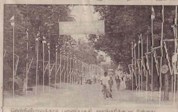
வெற்றிவிழாவுக்காக பணைப்பகுதி அலங்கரிக்கப்பட்டுள்ளது

வீரச்சாவைத் தழுவிய இடத்தில் அமைக்கப்பட்ட நினைவுக்கல் துறைக்கல் செய்து வைக்கப்படும். மேற்படி தாக்குதலின் ஞான்றம் ஆண்டை நினைவு கண்டு மரம் நடுகை இடம்பெறும் மாலை நூல் வெளியீடு, நடன நிகழ்வுகள், கவிதா நிகழ்வு, ஒலிப்பெறவு வெளியீடு, கவிதா நிகழ்வு கரை தேடும் ஓடங்கள் நடக்கம் போன்ற நிகழ்வுகளும் இடம்பெறும் இறுதியாக இசை நிகழ்வு இடம்பெறும். (லே)