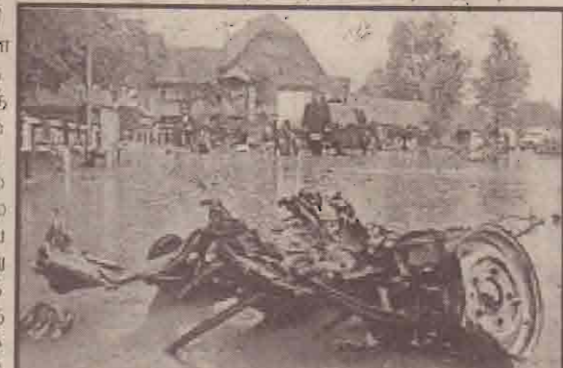
தற்கொலை தாக்குதலில் பயன்படுத்தப்பட்ட கார் சின்னாபின்னமாக வீட்டைக் காண்க.

நிலையங்கள் மீது தீவிரவாதிகள் தற்கொலைத் தாக்குதல் நடத்தினர். இதில் பெரியளவில் பாதிப்பு ஏதுவும் ஏற்படவில்லை என இந்திய படைத்தரப்பு கூறுகின்றது. அத்தோடு தாக்குதல் முறியடிக்கப்பட்டதாகவும் அது கூறுகின்றது. பிரதேசின் வயப் பகுதியிலுள்ள