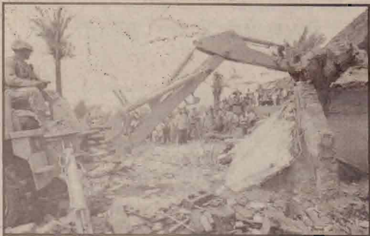
சராக்கில் அமெரிக்க ஆயுதக் களஞ்சிய வெடிப்புத் தில் சீதையும் பகுதிகளை அகற்றும் அமெரிக்கப் படைவீரர்

என்னெய் வளம் மிக்க அப்பிராந்தியத்தில் அமெரிக்காவின் வருங்கால இராணுவ விவகாரங்கள் பற்றி கனத்துரைப்பதே அவரது பயணத்தின் முக்கிய நோக்கமெனவும் குறிப்பிடப்பட்டுள்ளது.