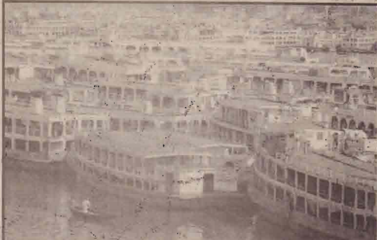
டாக்காவில், தற்போது நிலவும் சீரற்ற காலநிலையால் மாலை நேரப் பட்டும் பிணைத்தீற்ற அரசு தடைவிதித்துள்ளது. இதனை எதிர்த்து படகு உரிமையாளர்கள் தங்களை படகுகளை நீர்த்தி போராட்டத்தில் ஈடுபடுத்தினர்