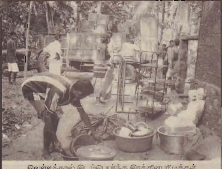
வெள்ளத்தால் இடம்பெயர்ந்த இரத்தினியார் மக்கள்

தென்னிலங்கையில் வெள்ளத்தால் பாதிக்கப்பட்ட மக்களுக்கு மாவட்ட தீயியாக முல்லை, மாவட்டத்திலும் உடை, உணவு, நிதி, ஆகியன சேகரிக்கப்படுகின்றது. இச்சேகரியானது தேசிய வருச்சிப் பேரவையின் செயலாளர்களுக்கடாக நிதி, உணவு, உடை என்பன கிராமங்கள் தோறும் சென்று சேகரிக்கப்பட்டுள்ளது. இச்சேகரியானது நேற்று ஆரம்பமாகி இன்றும் நடைபெறுகின்றது. (பு)