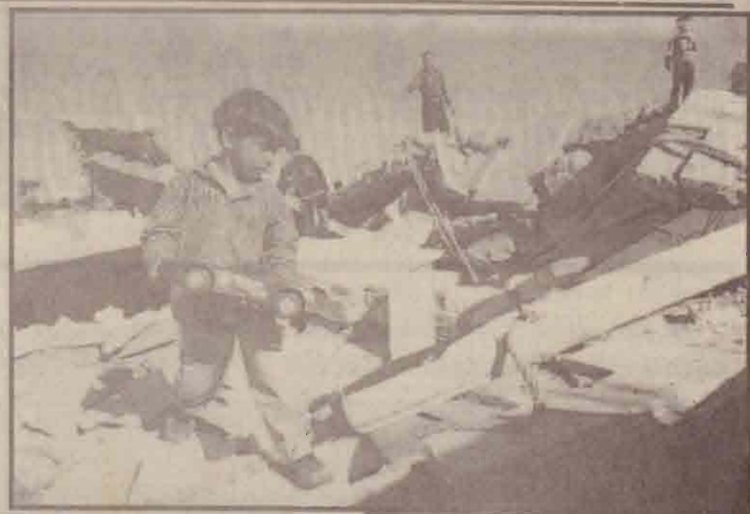
மேற்கூக்கரை கொடோன் நகரில் இஸ்ரேலிய இராணுவத்தால் தீர்மானிக்கப்பட்ட விடொன்றின் இடியாடுகள் மேல் நிற்கும் பலஸ்தீன சிறுவன்.

இஸ்ரேலியர்களுக்கு எதிராகத் தொடர்ச்சியாகப் பல தாக்குதல்கள் இடம்பெற்றதைத் தொடர்ந்து இஸ்ரேல் பலஸ்தீனத்துடனான அதன் எல்லைகளை மூடியமை தெரிந்ததே.