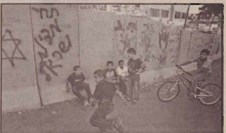
மேற்குக் கரை ஈராமமொன்றையும் ஜெருசலேமைமும் பிரிக்கும் மதில் அருகே லீகையாட்டில் ஈடுபடும் பலஸ்தீன சிறுவர்கள்.

பாரபட்சம் இவர்கள் மீதுகாட்டப்படுவதில்லை. இந்த நடைமுறைகளை மனித உரிமை அமைப்புகளும், ஐக்கிய நாடுகள் சபையும் வெகுவாகக் கண்டித்துள்ளன. இதேசமயம் புகலிடம்கோருவோர் விடயத்தில் பிரதமர் ஜோன்ஹவாண்ட் தலைமையிலான அரசாங்கம் தொடர்ந்தும் இறுக்கமான நிலையையே கடைப்பிடித்து வருகின்றது என்பது குறிப்பிடத்தக்கது.