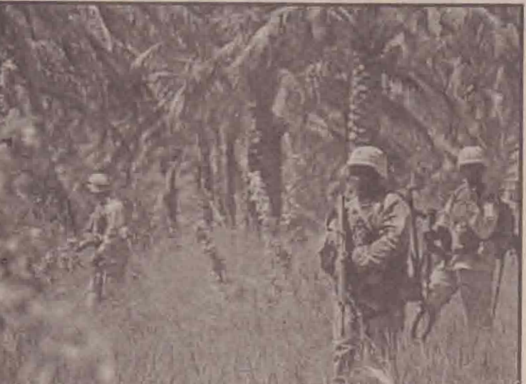
பாக்தாஜீன் வடகிழக்கில் ஈராமம் ஒன்றில் ஆயுதக்களைவு நடவடிக்கையில் ஈடுபடும் அமெரிக்க இராணுவம்.

(புதுடில்லி) அயோத்திப் பிரச்சினை குறித்து ஆர்.எஸ்.எஸ், விஸ்வவறிந்து பரிஷத் என்பன கூறியுள்ள கருத்துக்கள் அவர்களின் சொந்தக் கருத்துக்கள் என பா.ஜ.க.சி செய்தித் தொடர்பாளர் முப்தால் அபாஸ் நசி நேற்று முன்தினம் கூறியுள்ளார். அயோத்தியில் இராமர் கோயில் கட்ட வேண்டும் என விஸ்வ வறிந்து பரிஷத் விரும்பினாலும் அது பேச்சுவார்த்தை மூலமோ அல்லது நீதிமன்றத் தீர்ப்பு மூலமோ தான் நிறைவேற வேண்டும் என உறுதியுடன் இருப்பதாகவும் அவர் கூறியுள்ளார். ஆனால் அயோத்தியில் நான்கு கிலோ மீற்றருக்குள் மசூதி அமைக்க அனுமதிக்கமாட்டோம் என விஸ்வவறிந்து பரிஷத் அமைப்பின் பொதுச் செயலாளர் பிரவீன் தொகாடியா வலியுறுத்திக் கூறியுள்ளார்.