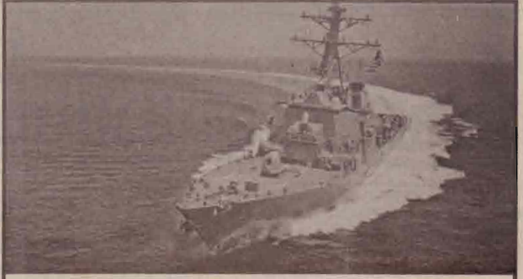
அமெரிக்காவின் நாசகாரக் கப்பல். இராணுவ செலவுக்குத் தாய்வான் நிதியொதுக்காததால் இத்தகைய நாசகாரகளை விற்பதை அமெரிக்கா நிறுத்தியுள்ளது.

மீட்டு சண்டைக்கு முற்படப்படுவதை பற்றி ஐக்கிய நாடுகள் சபை சிந்தித்து வருகின்றது. ஸைபீரியாவுக்கான அமைதி காக்கும் படைக்கு அமெரிக்கா தலைமை வகிக்க வேண்டும் என ஐநா செயலாளர் நாயகம் கொபி அனான் வலியுறுத்தியுள்ளார்.