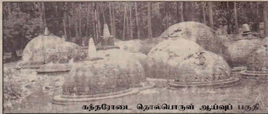
கந்தரோடை தொல்பொருள் ஆய்வுப் பகுதி

இலங்கையில் பௌத்த-சிங்களவர்கள் பெரும்பான்மையினராக இருக்கலாம். ஆனால், இலங்கை பல இன மக்கள் வாழும் நாடு என்பதை பௌத்த-சிங்களவர்கள் ஏற்றுக் கொள்ளாதல் வேண்டும். அவ்வாறு அவர்கள்