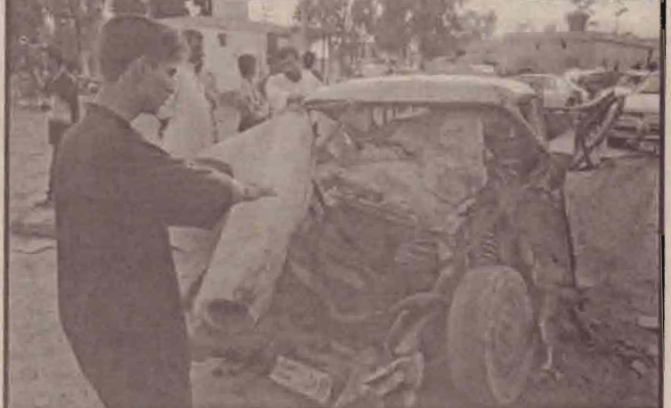
பலூயா நகரில் அமெரிக்கத் தாக்குதலில் சேதமாக்கப்பட்ட வாகனத்தை அவதானிக்கும் ஈராக் சிபர்கள் (இத்தாக்குதலில் 3 ஈராக் சிபர்கள் கொல்லப்பட்டனர்.)

சதாம் ஹுசைனும் அவரது புதல்வர்களும் சென்றதாகக் கருதியே இந்த வாகனத்தொடரணி மீது தாக்குதல் மேற்கொள்ளப்பட்டது. காயமடைந்த இவர்களை சிரியா விடம் ஒப்படைக்காது அமெரிக்கா தன்வசம் வைத்திருந்தது. இது குறித்து சிரியா கண்டனம் தெரிவித்ததை அடுத்தே இவர்கள் ஒப்படைக்கப்பட்டனர்.