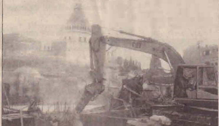
நகரத்திலுள்ள பிரதான கிறிஸ்தவ ஆலயத்தின் அத்திவாரத்தை இடித்தழிக்கும் இஸ்ரேலிய "பெக்கோ" இயந்திரம் இதன்காரணமாக வத்திக்கானில் மதச்சார்பு பட்டநிலை தோன்றியுள்ளது. நீதிமன்றத்தின் அழிப்பு அனுமதியுடன் வந்த ருஸ்லீம்களுக்கும் பொலீசாருக்குமிடையில் மோதலும் ஏற்பட்டது. (பிரிசி நகரத்திலும்)