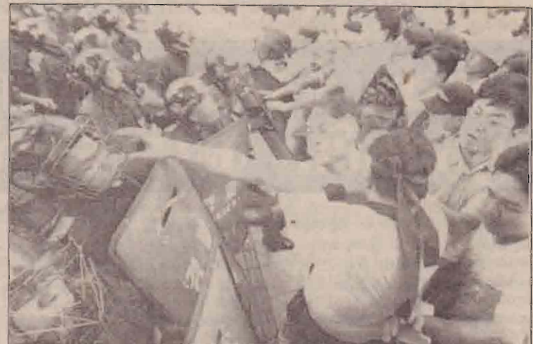
கொரியாவில் ரயில் போக்குவரத்தை மாறுசீரமைக்கும் கொரியாவின் திட்டத்தை எதிர்த்து ஆர்ப்பாட்டம் செய்யும் தொழிலாளர்களுக்கும் பொலீசாருக்குமிடையில் ஏற்பட்ட கலவரம்.

அப்படகில் 08 சிறுவர்கள், ஒரு குழந்தை உட்பட 54 பேர் இருந்தனர். இவர்கள் அனைவரும் வியட்நாமைச் சேர்ந்தவர்கள். அகதிகள் கைது செய்யப்பட்டதை சர்வதேச மனித உரிமை அமைப்புகள் கண்டித்துள்ளன.