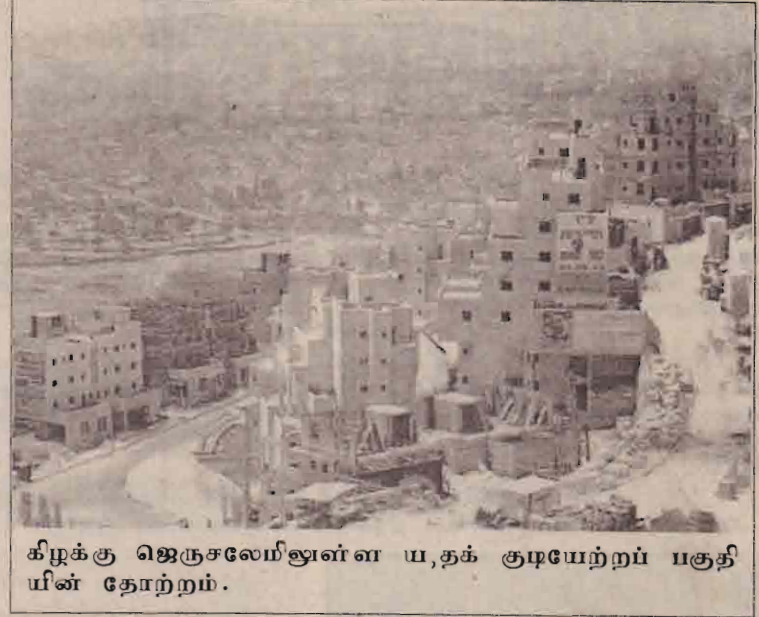
கிழக்கு ஜெருசலேமில் உள்ள யூதக் குடியேற்றப் பகுதியின் தோற்றம்.

உருவாகியுள்ளதாக ஏரியல் ஷரோன் கூறியுள்ளார். 1967ஆம் ஆண்டு போரின் போது இஸ்ரேலியர்களால் கைப்பற்றப்பட்ட பகுதியிலுள்ள பலஸ்தீனர்களை ஆட்சிபுரியவோ, அவர்களது எதிர்காலத்தை நிர்ணயிக்கவோ இஸ்ரேல் விரும்பவில்லையென்றும் அவர் மேலும் கூறியுள்ளார். எனினும் பலஸ்தீனர்களது பயங்கரவாத நடவடிக்கைகள் தொடர்ந்தால் நிரந்தர சமாதானம் ஏற்படுவது சாத்தியமல்ல என அவர் மேலும் சுட்டிக் காட்டியுள்ளார். அத்துடன் மோதல்களை முடிவுக்கு கொண்டு வர வேண்டும் என்பதே பலஸ்தீனர்களின் எதிர்பார்ப்பென பிரதமர் அபாஸ் கூறியுள்ளார்.