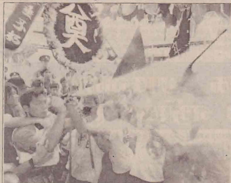
ஹொங்கொங் அரசு பிரகடனப்படுத்தியுள்ள ஈயங்கரவாதத் தடைச்சட்டத்தை எதிர்த்து நடைபெற்ற ஆர்ப்பாட்டத்தின் போது எரிக்கப்பட்ட கம்யூனிஸ்ட் கொடியை அணைக்கும் ஹொங்கொங் பொலீசார்.

தமிழக அரசின் கடுமையான எச்சரிக்கைகளையும் மீறி இந்தப் போராட்டம் மீண்டும் இடைக்கப்படுகிறது. நேற்று 90 விதமான ஊழியர்கள் மாநிலம் முழுவதும் போராட்டத்தில் ஈடுபட்டனர்.