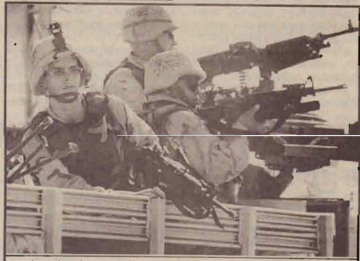
பாக்தாத்தில் அமெரிக்க இராணுவ முகாம் தாக்கப்பட்டதை அடுத்து ரமாத் நகரில் ரோந்துப் பணியில் ஈடுபடும் அமெரிக்கத் துருப்பினர்.

இதனிடையே பேரழிவு ஆயுதங்களுக்காக சதாம் ஹுசைன் ஆபிரிக்காவில் இருந்து யுரேனியம் வாங்கியதாக தான் கூறிய குற்றச்சாட்டுக்கள் உண்மையே என்று பிரிட்டன் மீண்டும் வலியுறுத்தியுள்ளது.