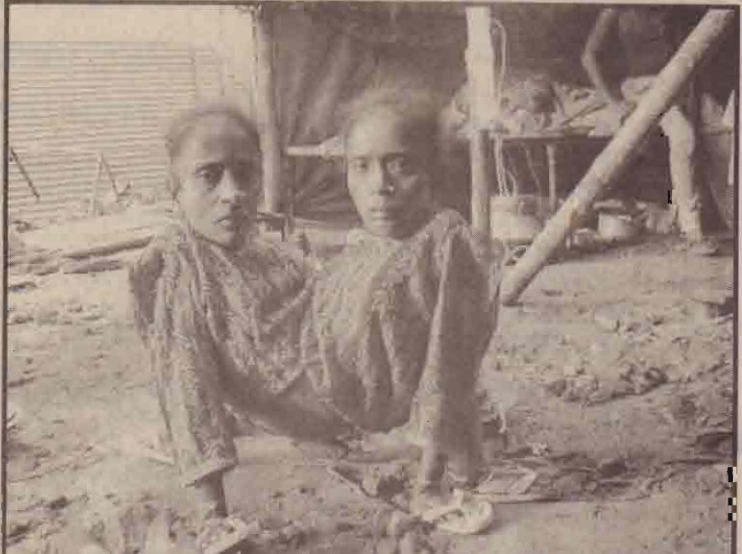
இந்தியாவின் அகமநாயாத்தில், இடுப்புப் பகுதியில் இணைந்த இரு பெண்கள் இவர்களுள் ஒருவர் அண்மையில் ஈரானிய இராணுவங்களின் சத்திர சீக்கீச்சை தோல்வியடைந்ததை அடுத்துத் தப்பி சத்திரசீக்கீச்சுக்கு மறுப்புத் தெரிவித்துள்ளார்.

அரசாங்கம் ஒன்றை அமைக்க ருவண்டா ஆதரவான கீனர்ச் சிக்குமுலின் தலைவர் புதிய அரசாங்கத்தின் நான்கு உதவி சனாதிபதிகளில் ஒருவராக அடுத்த வாரம் பதவிப்பிரமாணம் செய்து கொள்ளவுள்ளார். புதிய அரசு முதற்கடவையாக இம் மாதம் 19ஆம் திகதி கூடவுள்ளது.