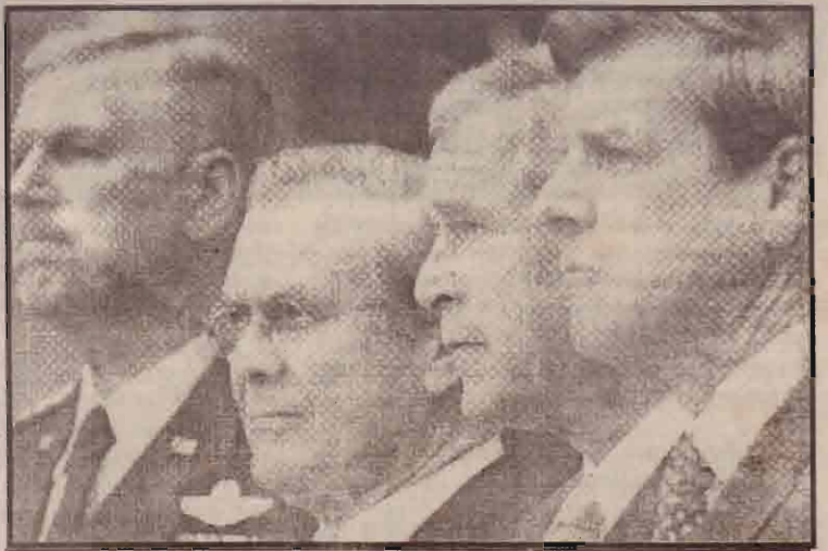
சதாமின் புதல்வர்கள் கொல்லப்பட்டதாக வெள்ளையாளிகையிலிருந்து அறிவிக்கும் அமெரிக்க சனாதிபதி ஜோர்ஜ் புஷ்