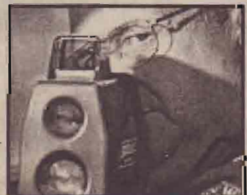
உலகளாவிய ரீதியில் பெருசி வரும் வீதி விபத்துகளுக்கு மிதமிஞ்சிய வேகமே காரணம் என விதிப் போக்குவரத்தைக் கண்காணிக்கும் அதிகாரிகள் கூறிவருகின்றனர். குறிப்பாக இணைஞர்கள் வேகமாக வாகனங்களைச் செலுத்தி பாயிய விபத்துகளுக்குள் சிக்கி உயிரிழப்பிற்கும், உடல் உறுப்புகளின் இழப்பிற்கும் உள்ளாகின்றனர். இளைஞர்கள் வீதிகளில் கார்பந்தயங்களைப் போன்று போட்டியிட்டு வாகனங்களை மக்கள்

போக்குவரத்துச் செய்யும் வீதிகளில் ஓட்டிச் செல்வது பெரும் பிரச்சினையாக உருவெடுத்துள்ளது. இதனைக் கட்டுப்படுத்த கடும் நடவடிக்கைகள் எடுக்கப்பட்டாலும் விபத்துக்கள் தொடர்கின்றன. படத்தில் வேகக்கட்டுப்பாட்டை நடைமுறைப்படுத்த வாகனங்களின் வேகத்தை அளவிடும் நவீன ராடருடன் போக்குவரத்து அதிகாரி ஒருவர்.