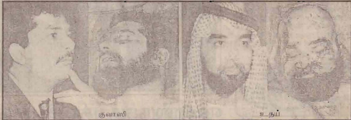
சதாமின் புதல்வர்களின் சடலங்களின் படங்களும், முன்னர் எடுக்கப்பட்ட படங்களும்

பணி நீக்கம் செய்யப்பட்ட அரசு ஊழியர்கள் நிபந்தனையற்ற மன்னிப்புக் கோருவதன், வரும் காலத்தில் இது போன்ற வேலை நிறுத்தத்தில் ஈடுபட்ட மாட்டேன் என உறுதி கூறி கடிதத்தில் கையெழுத்திட்ட பின்னரே, வரவுப் பதிவேட்டில் கையெழுத்திட்ட அனுமதிக்க வேண்டும் என்று அதிகாரிகளுக்கு உத்தரவிடப்பட்டுள்ளது.