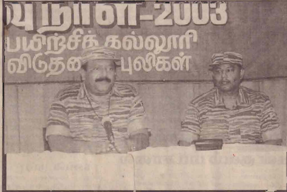
பயிற்சி கல்ஷாரி விடுதலை புலிகள் இளநிலை அதிகாரிகள் பயிற்சி நிறைவு நாள் விழாவில் தமிழிழத் தேசியத்தலைவர் மேதகு வேபிரபாகன் அவர்கள் கலந்து கொண்டு விசேட பெறுபெறு பெற்றவர்களுக்கு பரிசில் கலையும் தேர்ச்சி பெற்றவர்களுக்கு சான்றிதழ்களையும் வழங்கிக் கொளரவித்துள்ளார். நேற்று வன்னியில் உள்ள புலிகளின் பரிசரையில் இடம்பெற்ற நிகழ்வின் பயிற்சியை முடித்ததக்