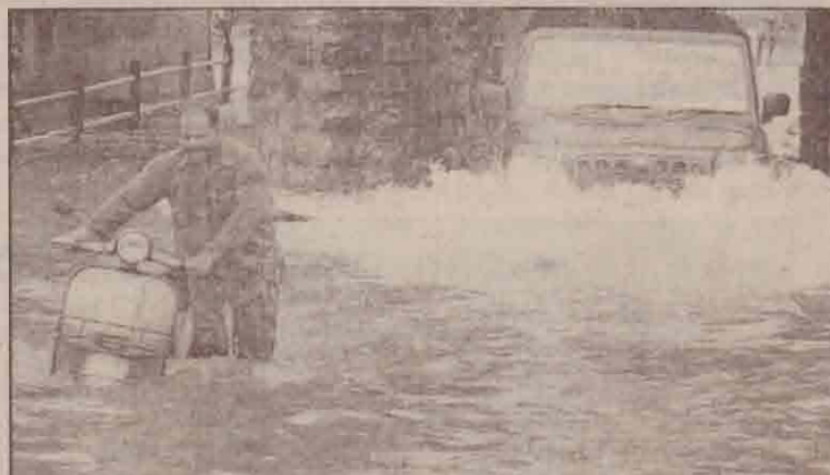
இந்தியாவின் போபால் நகரில் வெள்ளத்தினூடாக மோட்டார் சைக்கிளொன்றை உருட்டிச் செல்லும் நபர்.