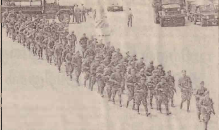
பிலிப்பைன்ஸ் சனாதிபதி குளோசியா மகபகல் ஆரோபோலுக்கு விகவாசமான படையினர் மனிலா நெடுஞ்சாலையில் ரோந்து செல்கின்றனர். சிறியளவிலான சதிப்புரட்சி நேற்றிரவு முறியடிக்கப்பட்டது குறிப்பிடத்தக்கது.

(பாரிஸ்) அல்-ஹைதா இயக்கத்தினர் தொடர்ந்தும் ஐரோப்பிய நாடுகளுக்கு அச்சுறுத்தலாக இருந்து வருகின்றனர் என்று பிரான்ஸின் புலனாய்வுத்துறை கூறுகின்றது. அல்-ஹைதா இயக்கத்தின் தகவல் பரிமாற்று சேவை பாதிக்கப்பட்டுள்ளது என பிரான்ஸ் இரகசியப் பொலீஸ் பிரதம அதிகாரி தெரிவித்துள்ளார். ஆயினும் இந்த இயக்கம் தொடர்ந்தும் தனது செயற்பாடுகளை முன்னெடுத்து வருவதற்கான தகவல்கள் கிடைத்துள்ளதாக அவர் தெரிவித்துள்ளார்.