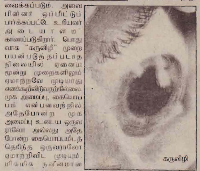
கருவிழி வைக்கப்படும். அவை பின்னர் ஒப்பீட்டுப்பார்க்கப்பட்டு உரியவர் அடையாளம் காணப்படுகிறார். பொதுவாக "கருவிழி" முறை பயன்படுத்தப்படாத நிலையில் ஏனைய மூன்று முறைகளிலும் ஏமாற்றவே முடியாது எனக்கூறிவிடுவதற்கில்லை முக அமைப்பு, கையொப்பம் என்பனவற்றில் அதேபோன்ற முக அமைப்பு உடைய ஒருவராலே அல்லது அதே போன்ற கையொப்பமிடத் தெரிந்த ஒருவராலே ஏமாற்றிவிட முடியும். மிகமிக நவீனமான

இம்முறையில் கைரேகை, கையொப்பம், குரல், கருவிழி அமைப்பு முகஅமைப்பு என்பன உரிய கருவிகள் மூலம் பதிவு செய்யப்பட்டு கணினியில் சேமித்து