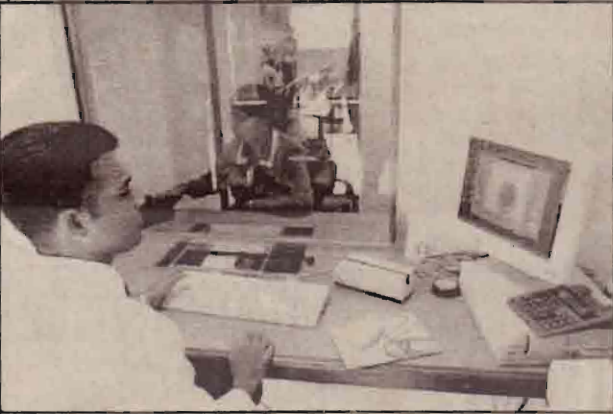
பெருவிரல் ரேகை கணினி மூலம் ஒப்பீட்டப்படுகிறது.

பிரித்தானிய அரசாங்கம் தனது நாட்டுக்கு அனுமதி வழங்கும் (VISA) முறையில் புதிய நடைமுறைகளைக் கொண்டு வந்துள்ளதாக செய்திகள் மூலம் அறிகின்றோம். இவ்வளவு காலமும் ஒருவரை அடையாளம் காண்புகைப்படமும் கையொப்பமும் இணைந்த கடவுச்சீட்டுக்கள் பயன்படுத்தப்பட்டு வந்தன. இப்போது அவைபோதாதென கைவிரல் அடையாளம், குருதிவகை என்பனவும் பெறப்பட்டுவதாக இப்போது தகவல்கள் வெளிவருகின்றன. முன்னர் குற்றவாளிகளை அடையாளம் காணவே பெரும்பாலும் விரலடையாளங்கள் பயன்பட்டன. பின்னர் வேறும் பல விடயங்களில் மாறக்கூடிய கையொப்பங்களை விட மாற்றமடையாத விரலடையாளங்கள் பயன்பட்டன. பின்னர் வேறும் பல விடயங்களில் மாறக்கூடிய கையொப்பங்களை விட மாற்றமடையாத விரலடையாளங்கள் நீண்ட காலத்தின் பின்பும் ஒருவரை அடையாளம் காண்பயன்பட்டு வருகின்றன.