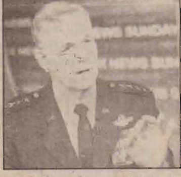
அமெரிக்காவின் ஆயுதப் படையில் தலைவர் ஜெனரல் நிச்சட் மியர்ஸ் புதுடில்லிக்கு நேற்று விஜயம் செய்துள்ளார்.

ஈராக்கிற்கு இந்தியப்படையின் 17 ஆயிரம் பேரைக்கொண்ட இரு அணிகளை அனுப்புவதற்கு சாதகமான சூழலை உருவாக்குவதை இலக்காகக்கொண்டு அவர் இந்திய உயர் அதிகாரிகளுடன் பேச்சுவார்த்தை நடத்தி வருகிறார்.