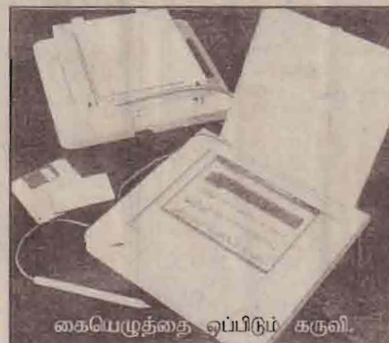
கையெழுத்தை ஒப்பிடும் கருவி.

கேள்விகேரல்களுக்கான விண்ணப்பங்கள், அந்தரங்கக் கடிதங்கள் என்பன கணினி மூலம் தயாரிக்கப்படும் போது அவற்றை வலையமைப்பைப் பயன்படுத்தி பலரும் பார்த்துவிடாமல் போகிறது. இதனைத் தடுக்க கடவுச் சொல் (Password) பயன்படுத்தப்படுகிறது. எனினும் இது எவருக்காவது தெரிந்துவிட்டால் அவர் இந்த இரகசிய விடயங்களை அறிந்துகொள்ள முடியும். சிலவேளைகளில் கடவுச் சொல்லை சம்பந்தப்போரே மறந்து விட்டால் பலசிரமங்களை அனுபவிக்க வேண்டிவரும். ஆனால் உயிரளவையில் இப்பிரச்சினை இல்லை. குறிப்பிட்ட சிலரின் மேலே குறிப்பிட்ட ஐந்து விடயங்களில் ஏதாவது ஒன்றைக் கணினியில் பதிவு செய்து வைத்தால் அவர் மட்டும் குறிப்பிட்ட கோப்புக்களைப் பார்வையிட கணினி அனுமதிக்கும். கைரேகை, முகஅமைப்பு, குரல், கண்கருவிழி என்பன ஆளுக்கு ஆள் மாறுபடுவதால் இவ்வகை உயிரளவைகளை ஒப்பிடும் கருவிகளை எளிதில் ஏமாற்றிவிட முடியாது. உயிரளவைத் தொழில்நுட்பத்தை ( Biometric Technology ) பல்வேறு விடயங்களுக்கு பயன்படுத்தலாம். அன்றாடச் செயற்பாடுகளில் கூட இதனைப் பயன்படுத்த முடியும்.