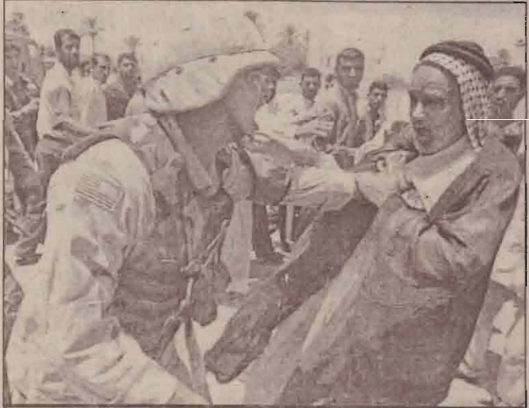
பாக்காத் நகரில் தெற்கேயுள்ள கர்பாலா நகரில் சராக் கியர் ஒருவரை தள்ளிச் செல்லும் அமெரிக்க இராணுவ வீரர்.

ஆனால், சதாம் ஹுசைன் அங்கு இல்லையென்பது உறுதி செய்யப்பட்ட நிலையில் அவ்வேளை, அங்கிருந்து புறப்பட்ட காரில் சதாம் ஹுசைன் தப்பிச் செல்வதாக சந்தேகித்த அவர்கள் அதன் மீது குண்டுகளை வீசியும் துப்பாக்கியால் சுட்டும் தாக்குதல் நடத்தியதில் அதில் பயணம் செய்த ஐந்து பேர் உயிரிழந்தனர்.