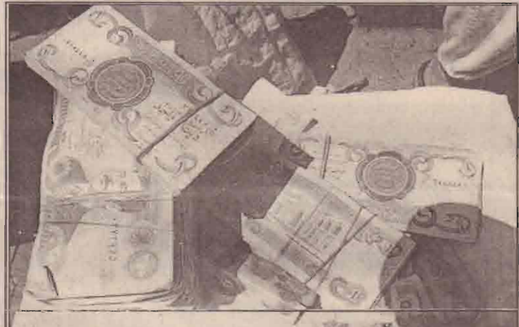
நாணயமாற்று நிறுவனம் ஒன்றில் காட்சிக்கு வைக்கப்பட்டு வகைப்படுத்தப்பட்டுள்ள ஈராக்கிய டினார். இதில் சதாம் ஆட்சியிலும் அதன்பின் தற்போது புழக்கத்திலுள்ளதொரு நாணயத்தாங்கள் உள்ளன.