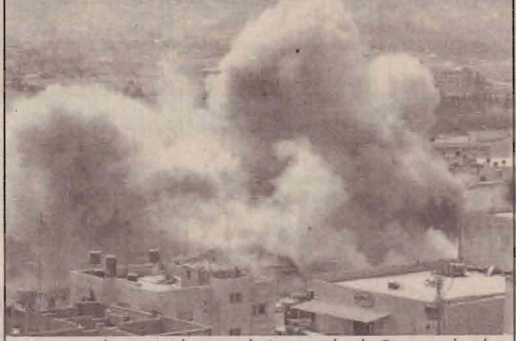
அகதி முகாம் பகுதியில் ஹமாஸ் போராளிக் குழு இராணுவத்துக்கு மிடையில் நடைபெறும் துப்பாக்கிச் சமரில் ஏற்பட்ட புகை மண்டலம்

இச் சம்பவத்தைடுத்து மேற்குக்கரைப் பகுதியில் பலஸ்தீனர்கள் இஸ்ரேலியர்களுக்கு எதிராகக் கோஷமிட்டனர். கமாஸ் அமைப்பைச் சேர்ந்த போராளிகள் இஸ்ரேல் மீது தாக்குதல் நடத்தத் திட்டமிட்டதால் தான் தாங்கள் இந்தத் திடீர்த் தாக்குதலை நடத்த வேண்டியது என்று இஸ்ரேலிய இராணுவத் தயாரிப்பு ஒருவர் தெரிவித்தார். இதற்கு விரைவில் பதிலடி கொடுப்போம் என்று பலஸ்தீனர்கள் கூறியிருப்பதால் மத்திய கிழக்குப் பகுதியில் மீண்டும் பதட்டம் ஏற்பட்டுள்ளது.