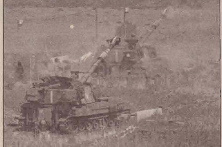
இஸ்ரேல் - வெபனான் எல்லையில் வெபனான் ஹிஸ்புல்லா முன்னணிசீனரை நோக்கி இஸ்ரேலியப்படைபீனரால் நடத்தப்படும் ஆட்டிஸி தாக்குதல்

(டெல்அவில்) தெற்கு வெபனாவில் உள்ள ஹிஸ்புல்லா கொளில்லாக்கள் இஸ்ரேலின் வடபகுதியில் தாக்குதலை நடத்துவதனால் அந்தப்பிராந்தியத்தின் அமைதி நிலை சீராகுலர்