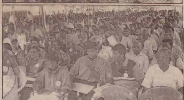
பணையில் நடைபெற்ற தேசிய எழுச்சிப் பேரவை மாநாட்டில் கலந்துகொண்ட பேராளர்களில் ஒரு பகுதியினர்.