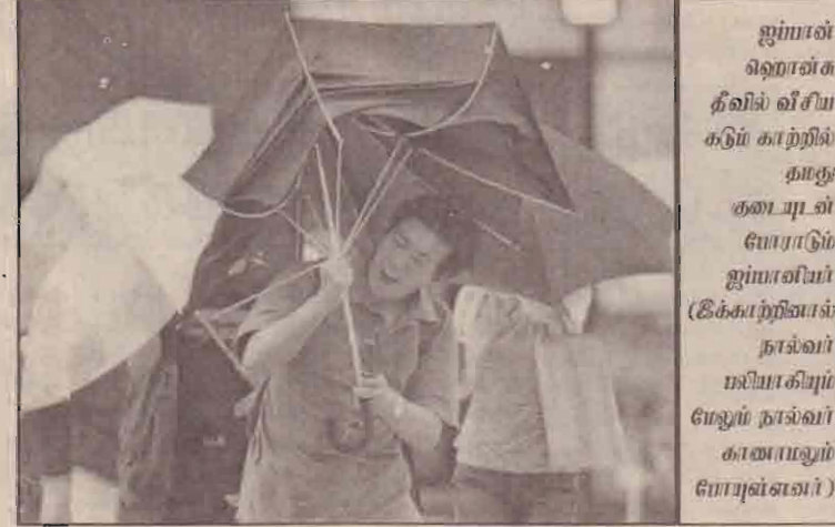
ஐப்பால் ஹொன்சு தீவில் வீசிய கடும் காற்றில் தாது குடைபுள் போராடும் ஐப்பாலியர் (கீக்காற்றிப்பால் நாவல் மலியாகியும் மேலும் நாவல் காணாமலும் போயுள்ளனர்)

(புதுடில்லி) கொக்கோ கோலா, பெப்சி போன்ற குளிர்மானங்களில் அனுமதிக்கப்பட்ட அளவை விட பூச்சிக் கொல்லி மருந்துகள் கலந்திருப்பதால் தயாரிப்பு நிறுவனங்களின் உரிமைகள் ரத்துச் செய்யப்படலாம் என மத்திய உணவு பதப்படுத்தும் துறை இணையமைச்சர் சண்முகம் கூறியுள்ளார். அரசியல்வாதிகளும் மற்றும் சுற்றுச்சூழல் மையமும் குளிர்மானங்களில் பூச்சிக்கொல்லி மருந்துகள் இருப்பது குறித்து பிரச்சாரம்செய்வதை நிறுத்தக்கோரி பெப்சி நிறுவனத்தின் மனு டில்லி உயர் நீதிமன்றத்தில் இன்று விசாரணை செய்யப்படவுள்ளது.