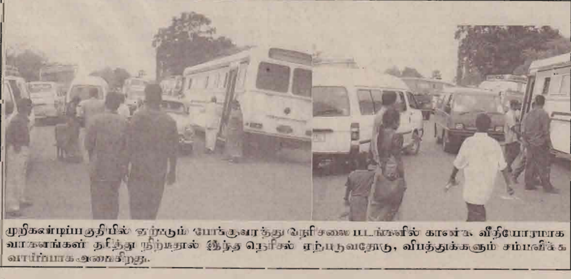
முற்கணிப்பகுதியில் ஏற்படும் போக்குவரத்து நெரிசலை பட்டங்களில் காணும் வீதியோரமாக வாகனங்கள் நெரிந்து நிற்குதல் இந்த நெரிசல் ஏற்படுவதற்கு, விபத்துக்களும் சம்பந்திக்க வாய்ப்பாக அமைகிறது.

குறிப்பிடப்பட்டிருந்ததால் இந்நிலையேற்பட்டது. வெளிநாட்டு உதவிகள் மூலம் போது மக்களுக்குக் கிடைக்கப்பட வேண்டிய நன்மைகள் சிறிலங்காவின் இரு பெரும் அரசியல் கட்சிகளினதும் போக்கு காரணமாக அவர்களை சென்றடையாதுள்ளாமைபற்றி அப்பகுதி மக்கள் கவலையடைந்துள்ளனர்.