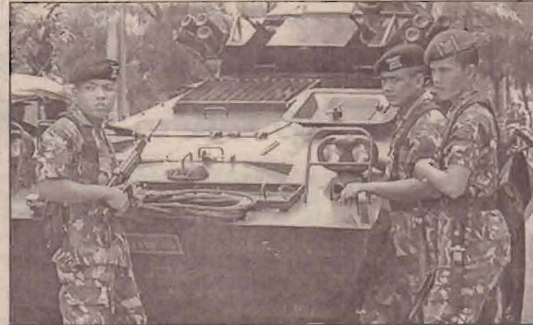
அண்மையில் யகார்த்தாவில் விடுதி ஒன்றில் ஏற்பட்ட குண்டு வெடிப்பை அடுத்து இந்தோனேசிய சனாதிபதி வாகனம் கைத்தில் கவர் வாகனத்துக்கு கைகில் காணப்படும் இந்தோனேசிய இராணுவம்.