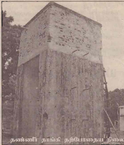
தண்ணீர் தாங்கி தற்போதைய நிலை அனுப்பி வைக்கப்படுவதாக அவ்வட்டாரங்கள் மேலும் தெரிவித்தன.

இங்கு வரும் அவசர நோயாளிகள் மகப்பேற்றுத் தாய்மார் வொனியா அல்லது புதுக்குடியிருப்பிற்கு