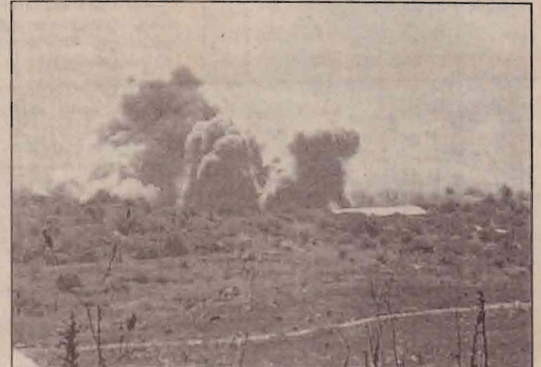
கின்புஷா தீவிரவாதிகள் இஸ்ரேலிய இராணுவ நிலைகளை மீது தாக்கதல் நடத்தியதை அடுத்து இஸ்ரேலிய விமானப் படை மின் குண்டு தாக்குதலால் தெற்கு வெவனாவில் எழும் புகை மண்டலம்.

நெஜீரிய சமாதான படையினரை லைபீரியாவில் பணியாற்றுவதற்கு அனுமதிப்பது பற்றி தங்கள் தலைமைப்பீடமே தீர்மானிக்க வேண்டும் என கிளர்ச்சியாளர்கள் அறிவித்துள்ளனர். இந்நிலையில் தலைநகர் மொன்ரோவியாவிலுள்ள முக்கிய துறைமுகம் ஒன்றின் முற்றுகையை கைவிட்டு அகதிகளுக்கும் தலைநகர் வாசிகளுக்கும் உணவு பொருட்களையும், ஏனைய உதவிப்பொருட்களையும் கொண்டு செல்ல அனுமதிக்குமாறு அமெரிக்க மற்றும் மேற்காபிரிக்க அதிகாரிகள் கிளர்ச்சிவாதிகளைத் தொடர்ந்து வலியுறுத்தி வருகின்றனர்.