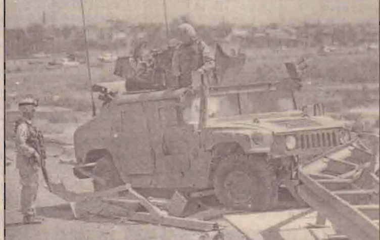
பாக்காத் வீதியில் ஏற்பட்ட குண்டு வெடிப்பில் சேதமடைந்த 82ஆவது விமானப்படை மின் வாகனத்திலிருந்து சூழல்களை அகற்றும் அமெரிக்க இராணுவப் பொலிசார்.