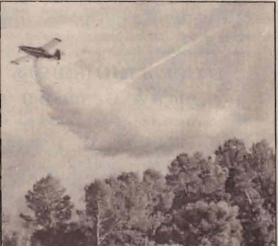
என்மயிலில் ஏற்பட்ட காட்டுத்தீயை அகணக்கும் முயற்சியிலீடு மும் விமானம் ஒன்று.

வேலை நிறுத்தத்தில் ஈடுபடும் தார்மிக உரிமை தொழிலாளர்களுக்கும் அரசாங்க ஊழியர்களுக்கும் இல்லை என்ற உச்ச நீதிமன்றத்தின் கருத்து அவசிய மற்றது என்றும் புரிந்துகொள்ள முடியாதது என்றும் சட்டமா அதிபர் சோலி சிராஜி தெரிவித்துள்ளார். ஒருங்கிணைந்த பேரம் செய்யும் உரிமையும், வேலை நிறுத்தத்தில் ஈடுபடும் துணை உரிமையும் ஊழியர்களின் மதிப்பிட முடியாத உரிமைகள் என்றும் பல ஆண்டுகளாகப் போராடி முயற்சி செய்தே இந்த உரிமைகளை தொழிலாளர்கள் பெற்றார்கள் என்றும் தங்களது குறைகளுக்குத் தீர்வுகாண பயனுள்ள வழிகள் இல்லாதபோது வேலை நிறுத்தத்தில் ஈடுபடுவதைத் தவிர வேறு வழியில்லை என்றும் கூட்டிக் காட்டியுள்ளார்.