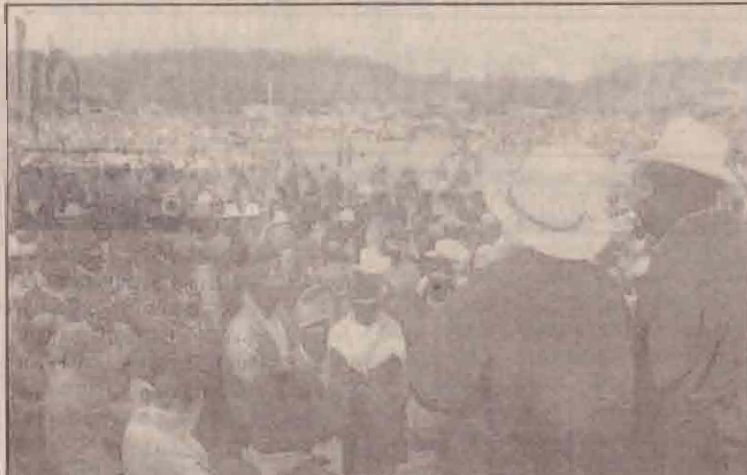
மெக்ஸிகோவில் கிளர்ச்சிவாதிகளின் ஒதுக்குப்பறம் ஒன்றில் நடைபெறும் கூட்டத்தில் தலைவரின் உரையை அவதானிக்கும் கூட்டத்தினர்

மண்ணுக்குள் மறைத்து வைத்திருக்கும் கண்ணிவெடிகளை அகற்றும் பணியில் அமெரிக்கப் படையினர் தொடர்ந்து ஈடுபட்டு வருகின்றனர். இதேவேளை, நேற்று முன்தினம் நடைபெற்ற தாக்குதலொன்றில் இரு அமெரிக்கப் படையினர் கொல்லப்பட்டதாகவும் அறிவிக்கப்பட்டுள்ளது. இந்நிலையில் சதாமையும் அவரது ஆதரவாளர்களையும் பிடிக்கும் நடவடிக்கைகளுக்காக அமெரிக்க மற்றும் பிரிட்டிஷ் படைகள் தீவிர தேடுதல்களையும் மேற்கொண்டு வருகின்றன.