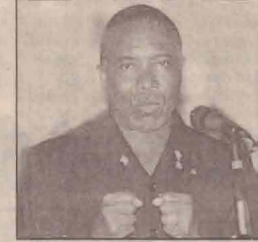
யில் குறிப்பிட்டுள்ளார். அத்துடன் இறுதியாக நான் மீண்டும் சனாதிபதியாக வருவேன் என வலியுறுத்தினார்.

வாக்கிறேன் இதை மக்கள் புரிந்து கொள்வார்கள் என தனது உரை