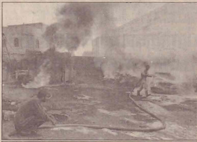
பாக்தாத்திற்கு அண்மையில் வாகனங்கள் பழுதாயாக்கும் பெற்றோல் குண்டு வெடிப்பில் ஏற்பட்ட தீயை அணைக்கும் ஈராக்கிய தயணைப்புப் படை.

நடைபெற்ற நிகழ்வில் பன்னாட்டுப் படைகளின் தற்போதைய தலைவர்களான ஜேர்மன், டச் அதிகாரிகள் நேட்டோவிடம் பொறுப்பை ஒப்படைத்துள்ளார்கள். நேட்டோ எனப்படும் வடஅத்திலாந்திக் ஒப்பந்த அமைப்பில் 19 உறுப்பு நாடுகள் சர்வதேச பயங்கர வாதத்தின் சவாலை எதிர்கொள்ள வேண்டியிருக்கும்.