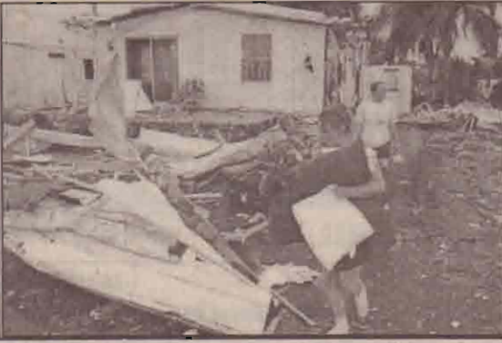
அமெரிக்காவின் புளோரிடா மாகாணத்தில் விசிய குறாவளியால் கார் ஒன்றின் மீது விழ்ந்துள்ள மரமும் பாதிக்கப்பட்டோருக்கு வழங்கப்படுவதற்காக உதவிப் பொருட்களை கொண்டு செல்லும் மீட்புப் படையினரும் (இதன்போது 500 வீடுகள் சேதமடைந்தன)