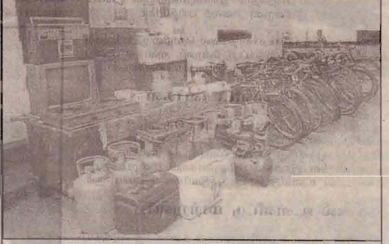
கொள்ளையர் குழுவொன்றினால் கொழும்பில் பல இடங்களில் கொள்ளையடிக்கப்பட்ட பொருட்கள் இவை. சந்தேக நபர் ஒருவரும் கிரான்யால் பொலீசாரால் கைது செய்யப்பட்டுள்ளார்.

திருகோணமலை-மட்டக்களப்பு கரையோரப் பாதையான ஏ-15 இல் உள்ள உப்பாறு, சுக்கை, முதுர் ஆகிய துறைமுக புதிய மிதவை பாதைகள் தயார் படுத்தப்பட்டு வருகின்றன. கடந்த 10 வருடங்களுக்கு மேலாக திறக்கப்படாத இவ்விதி அண்மையில் திறக்கப்பட்ட போதிலும் போக்குவரத்து வசதிகள் இல்லாததால் மக்கள் பயணம் செய்வதில் பல சிக்கல்களை எதிர்நோக்கி வந்தனர்.