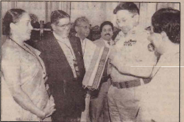
இந்தியாவிலிருந்து சென்ற பாராஸ்காந்தர் நட்புறவுக்கு பாகிஸ்தான் சனாதிபதி முஷாரஃபைச் சந்தித்து சால்வையொன்றை வழங்கியது.

இதேவேளை கடந்த ஜூன் மாதத் தில்லுந்து லைபீரிய சமாதான முயற்சிகள் இடம்பெற்று வரும் காலாவில் தலைநகர் அக்ராவிற்று மோசஸ் பிளாஹ் நேற்று முன்தினம் சென்றுள்ளார். ரெயிலருடன், மோசஸ் நெருக்கிய தொடர்புகளைக் கொண்டவர் என்ற கருவத்தினால் மோசஸை நிராகரித்துள்ள கொரில்லாக்களுடன் ஊராவில் மோசஸின் சந்திப்பு எதுவும் இடம்பெறாது என்றும் தெரிவிக்கப்பட்டுள்ளது.