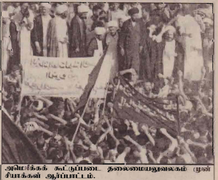
அமெரிக்கக் கூட்டுப்படை தலைமையலுவலகம் முன் சியாக்கள் ஆர்ப்பாட்டம்.

யோக்குவிரத்தும் பாதுபடைந்துள்ளன. மக்களின் பயத்தைப் போக்கும் வகையில் வானொலியில் செய்திகள் மூலம் உடனுக்குடன் தகவல்கள் தெரிவிக்கப்பட்டன. இந்நிலையில் செய்தியாளர்களிடம் பேசிய அமெரிக்க சனாதிபதி ஜோர்ஜ் புஷ், நயாகரா நீர்வீழ்ச்சியிலுள்ள மின் உற்பத்தி மையத்தை பின்னல் தாக்கியதால் இந்த மின்தடை ஏற்பட்டதாகக் கூறியுள்ளார். இதுதொடர்ச்சியாக நடவடிக்கைகள் எடுக்கப்பட்டுள்ளதாகவும் அவர் கூறியுள்ளார்.