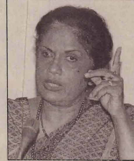
வகிக்கும் முஸ்லிம் காங்கிரஸ் தனது அரசியல் நடவடிக்கைகளை ஓர் ‘பிளாக் மெயில்’ பாணியிலானதாக அமைத்துக் கொண்டுள்ளது போல் தெரிவதாக அரசியல் அவதானிகள் அபிப்பிராயம் தெரிவிக்கின்றனர். இந்நிலையானது எல்லை மீறிச்