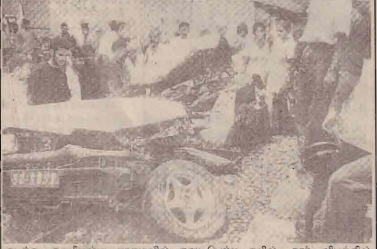
கடந்த ஞாயிறன்று நாகமவில் நடைபெற்ற ரயில்-கார் விபத்தில் சின்னாபின்னமாகிய கார்- இவ்விபத்தில் இருவர் பலியானதுடன் ஒருவர் பலத்த காயங்களுக்கள்ளாளார் (இக்கார் 200மீற்றர் இழுத்துச் செல்லப்பட்டமை குறிப்பிடத்தக்கது.)

விண்ணப்பிக்கத் தகுதியானவர்கள் எதிர்வரும் 23.08.2003 சனியன்று மு.ப.9.00மணிக்கு சிறிகப்பிரமணிய வித்தியாசாலையில் சிரேஷ்ட