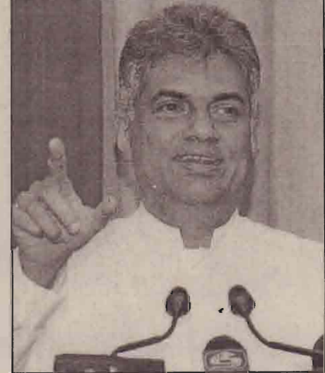
மாநாட்டிற்கு முன்பாக அரசு தரப்பினர் முன்வைத்திருந்த இரண்டு யோசனைகள் நிராகரிக்கப்பட்டிருந்தன.

கடந்த யூனில் டோக்கியோவில் இடம் பெற்ற சிறிலங்காவிற்கு உதவி வழங்கும் நாடுகளின் மாநாட்டிற்கு முன்பாக இடைக்கால நிர்வாகக் கட்டமைப்புக் குறித்துத் திட்டவரைவை அரசாங்கம் முன்வைக்க வேண்டும் எனக் கோரியவேளை, அதை அடுத்து அரசாங்கம் முன்வைத்த யோசனைகள் விடுதலைப்புலிகளால் நிராகரிக்கப்பட்டிருந்தன. இந்த வகையில் டோக்கியோ