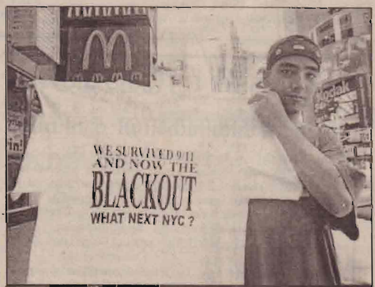
இருளில் மூழ்கியிருந்த நியூயோர்க் நகரில் மீண்டும் மின்சாரம் கிடைத்தபின் "தப்பிப் பிழைத்திருக்கிறோம்" என்ற வாசகத்தைக் கொண்ட T சேட்டை விற்பனை செய்யும் வியாபாரி.

அல்ஜீரியாவின் தென்பகுதியில் பயணம் செய்து கொண்டிருந்த போது கடத்தப்பட்ட 32 ஐரோப்பியர்களில் 17 பேர் முன்னர் இராணுவ நடவடிக்கைகள் மூலம் விடுவிக்கப்பட்டார்கள்.