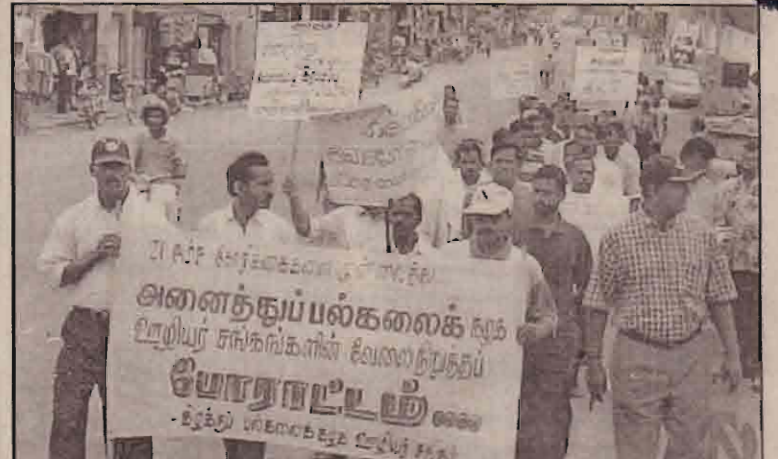
சம்பள முரண்பாட்டை நீக்குதல், பல்கலைக்கழகங்களைத் தனியார் மயப்படுத்துதலைக் தடுத்தல் போன்ற 21 கோரிக்கைகளை முன்வைத்து வடக்கு கிழக்குக்குட்பட்ட இலங்கை முழுவதிலுமுள்ள 13 பல்கலைக்கழகங்களையும் சேர்ந்த 12 ஆயிரம் கல்விசாரா ஊழியர்கள் தொடர்ச்சியான வேலை நிறுத்தத்தில் ஈடுபட்டுவருகின்றனர்.

பின்னர் சங்கப் பிரதிநிதிகள் குழு ஒல்லாந்தர் கோட்டையில் இயங்கும் மாவட்ட செயலகத்திற்குச் சென்று அரச அதிபருக்கு முகவரியிட்ட மனுவை மேலதிக அரச அதிபர் பண்ணியமூர்த்தியிடம் கையளித்துள்ளனர்.