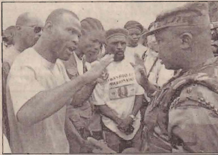
அமைதி ஒப்பந்தம் ஏற்பட்ட நிலையில் தடை முகாம் ஒன்றில் வாக்குவாதப்படும் நைஜீரிய அமைதிப்படை வீரரும் லைபீரிய கிளர்ச்சிக்குழு உறுப்பினரும்.