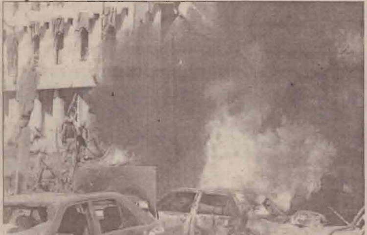
வெடிமருந்து நிரப்பிய ட்ரக் கொண்டு தாக்குதல் நடத்தப்பட்டுள்ளது. இது ஒரு தற்கொலைக்

இத்தாக்குதல் ஒரு காட்டுமிரண்டித்தனம் என்று ரஷ்யா கூறியுள்ளது.